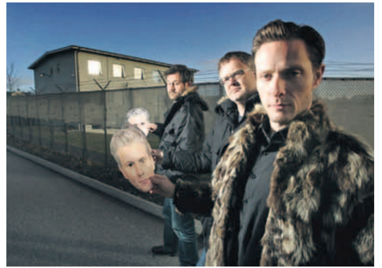
Íslandslög Ný danskir ætla að taka upp nýja plötu á flakki sínu um landið en hún verður tekin upp í Önundarfirði, á Akureyri og í Vestmannaeyjum.