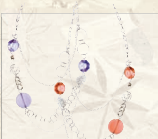
SKARTGRIPIR 6 litir á aðeins 1.490,-