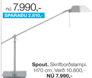
Spot. Skrifborðslampi. H70 cm. Verð 10.800,- NÚ 7.990,-