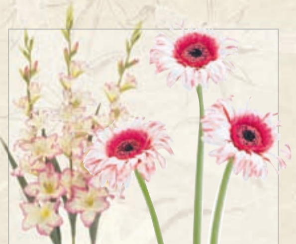
SILKIBLÓM mikið úrval verð frá 190,-