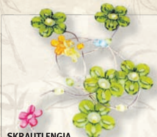
SKRAUTLENGJA fjórir litir á aðeins 1.190,- fyrir veisluborð, á beltí, í glugga ... eða bara hvar sem er!