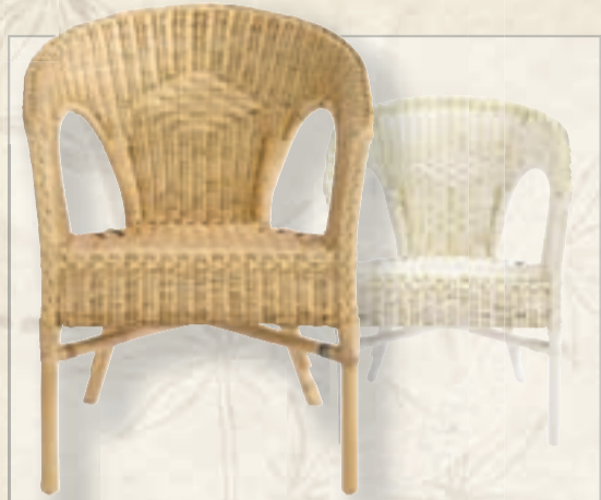
BASTSTÓLAR , þrjú litir á aðeins 3.990,-