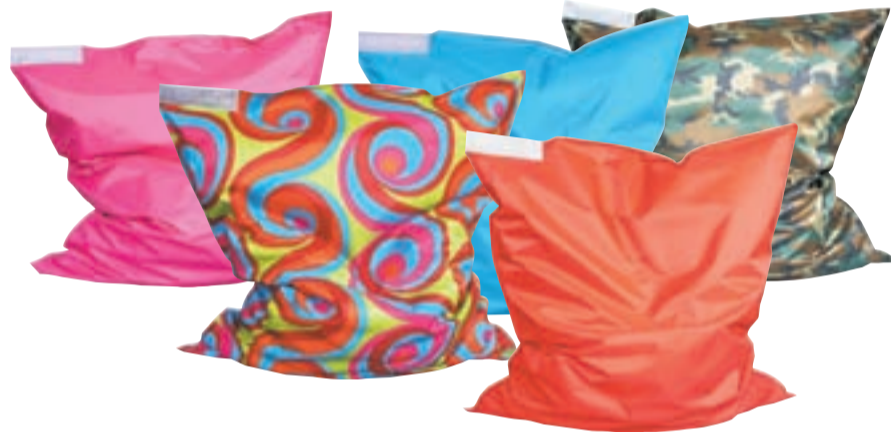
Fredsack. Grjónapúðar. 135 x 165 cm. Ýmsir litir. Verð 14.900,- Einnig til gylltur og silfurritaður. Verð 19.900,-