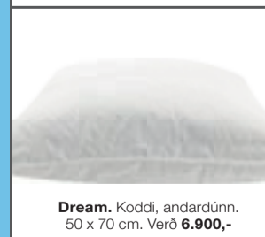
Dream. Koddli, andardúnn. 50 x 70 cm. Verð 6.900,-