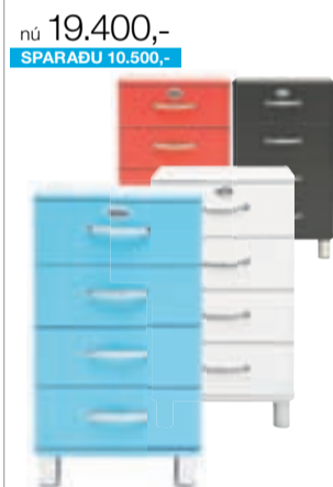
Malibu. Kommóða. 4 skúffur. 50 x 92 x 41 cm. Verð 29.900,- NÚ 19.400,- Ýmsir litir.