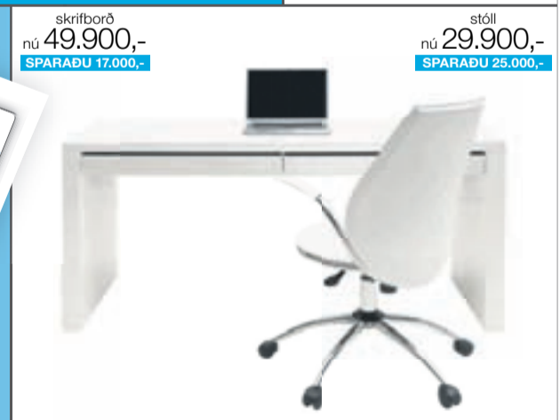
Contract. Skrifborð m/2 skúffum. Háglans hvít. 65 x 158 cm. Verð 66.900,- NÚ 49.900,- Spinn. Skrifborðsstóll m/gaspumpu. Hvítt leður. Verð 54.900,- NÚ 29.900,-

Verslaðu á www.ilva.is Sendum um allt land