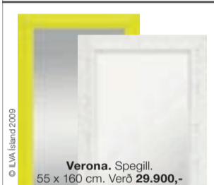
Verona. Spéggill. 55 x 160 cm. Verð 29.900,-