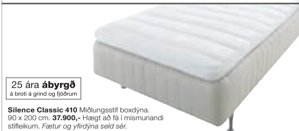
25 ára ábyrgð á broti á grind og fjöðrum Silence Classic 410 Miðlungsstíf boxdýna. 90 x 200 cm. 37.900,- Hægt að fá í mismunandi stílfleikum. Fætur og yfirdýna seld sér.