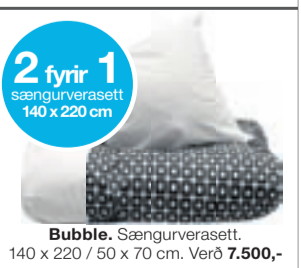
2 fyrir 1 sængurverasett 140 x 220 cm Bubble. Sængurverasett. 140 x 220 / 50 x 70 cm. Verð 7.500,-