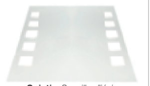
Quintin. Spéggill m/ljósi. 50 x 60 cm. Verð 17.900,- 60 x 80 cm. Verð 19.900,-