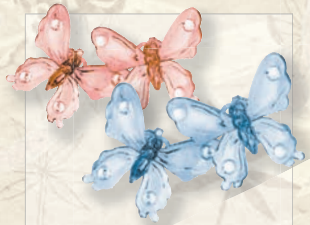
FIÐRILDI , tvö saman á aðeins 990,- Klemmur sem geta prýtt hvað sem er!