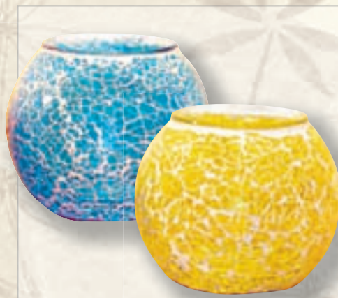
MÓSAIK STJAKI til í þremur litum á aðeins 1.990,-