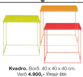
Kvadro. Borð. 40 x 40 x 40 cm. Verð 4.900,- Ýmsir litir.