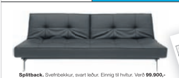
Splittback. Svefnbekkur, svart leður. Einnig til hvítur. Verð 99.900,-