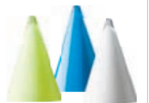
Pyramid. Borðlampi. H26 cm. Verð 6.990,-