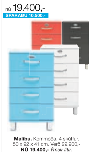
Malibu. Kommóða. 4 skúffur. 50 x 92 x 41 cm. Verð 29.900,- NÚ 19.400,- Ýmsir litir.