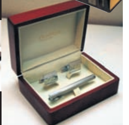
ÁLETRADIR ERMAHNAPPAR og bindisnæla sem ég fékk í afmælisgjöf frá kærustunni minni. Ég reyni að flagga þessu þegar ég vil vera virkilega finn.