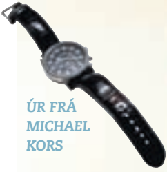
ÚR FRÁ MICHAEL KORS