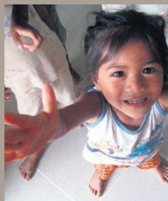
Munaðarlaus María Sigrún upplifði oft þá tilfinningu að vilja taka