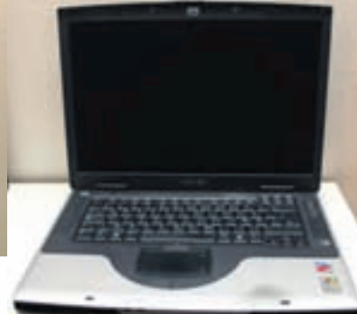
HP-FARTÖLVA Hefur reynst mér vel, þó að ég sé hægt og bitandi að tapa baráttunni við almannatengslamaskínu Apple.