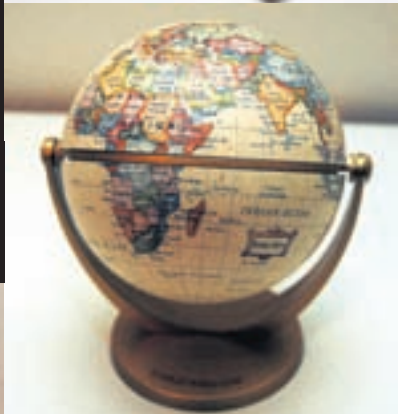
HNATTLÍKAN. Ég elska að ferðast og finnst gaman að skoða mögulega áfangastaði. Ekki veitir af að fara með hugann burt þó að líkaminn sitji fastur.