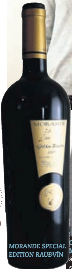
MORANDE SPECIAL EDITION RAUÐVÍN