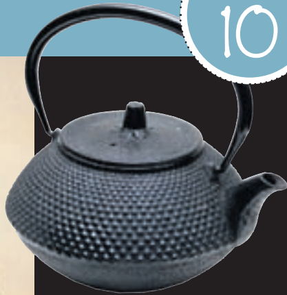
JAPANSKUR TEKETILL sem ég keypti í Kyoto í Japan fyrir ári síðan. Ég heillaðist af japanskri menningu og reyni að fara þangað í huganum með því að hella upp á grænt te endrum og sinnum.