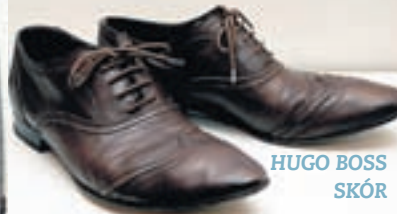
HUGO BOSS SKÓR