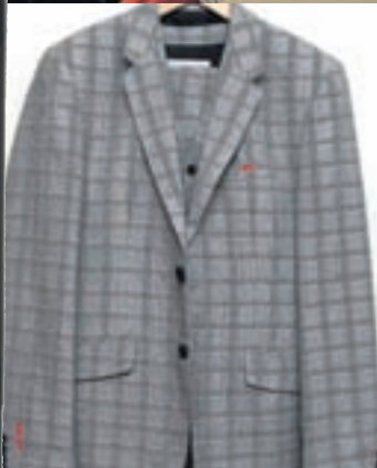
GRÁTEINÓTT JAKKAFÖT ÚR MOODS OF NORWAY. Ég tók strax ástföstri við þessi föt, sem mér finnst skemmtilega öðruvísi.