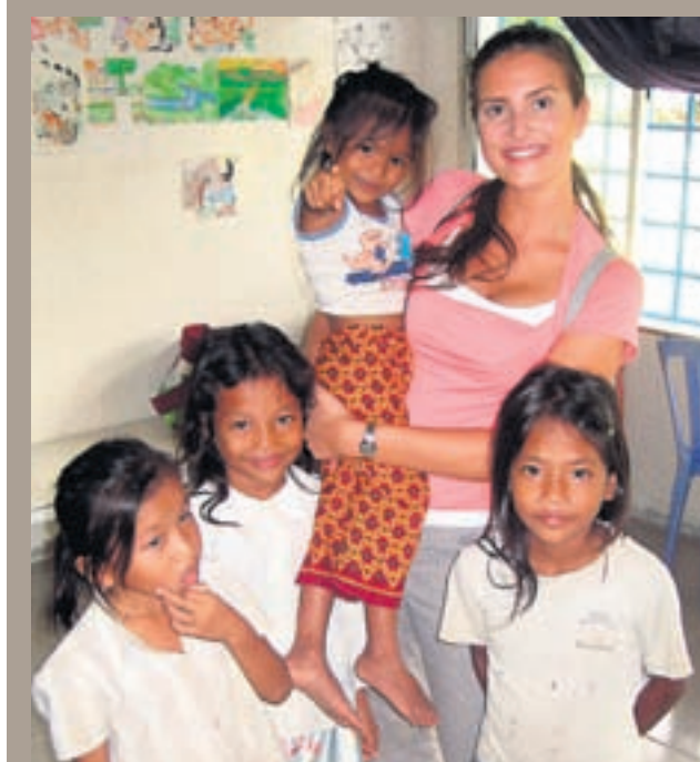
Sæt Börnin í Kambódíu eru afar lagleg með stór og falleg augu.