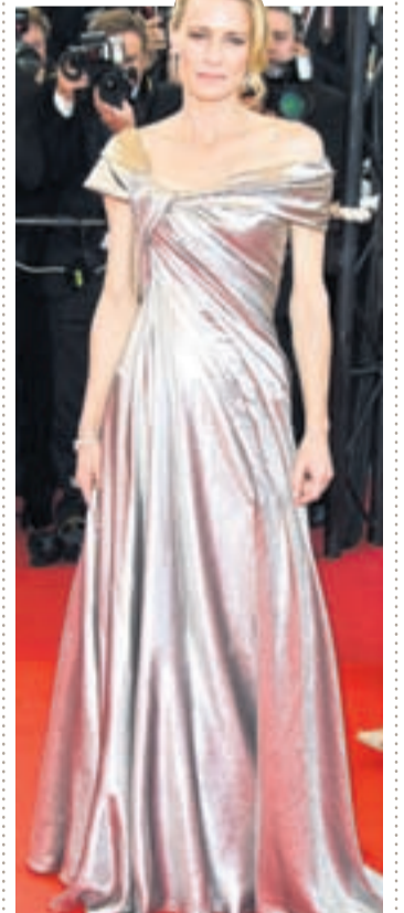
GLÆSILEG Bandaríska leikkonan Robin Wright-Penn ljómaði á kvikmyndahátíðinni í Cannes í vikunni en hún er að skilja við Sean Penn.