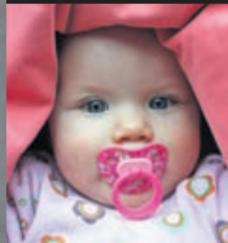
SNÚÐ DÓTTUR MINNAR.