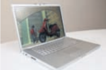
APPLE-TÖLVAN MÍN Er glugginn minn bæði í einkalífínu og vinnunni.