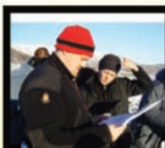
FERÐAMÁLADEILD BA í ferðamálafræði diplóma í ferðamálafræði diplóma í viðburðastjórnun

Miklar vonir eru bundnar við okkar greinar