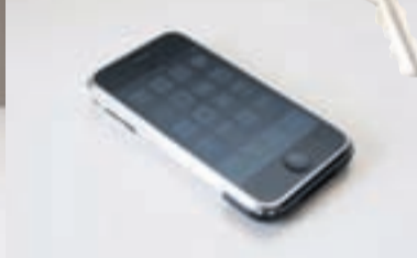
SÍMINN MINN. Allt of háður honum, bæði í vinnu og einkalífi.