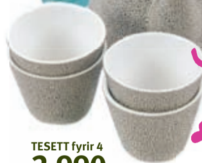
TESETT fyrir 4 2.990,-