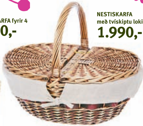
NESTISKARFA með tvískiptu loki 1.990,-