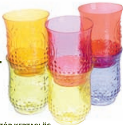
STÓR KERTAGLÖS 490,-