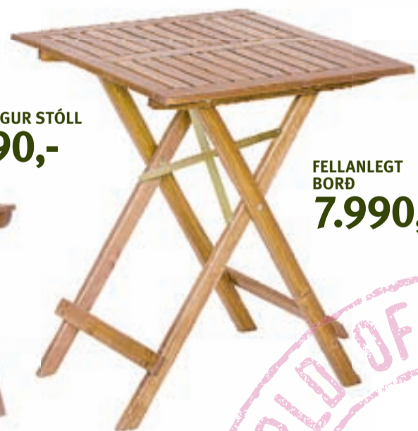
FELLANLEGT BORÐ 7.990,-