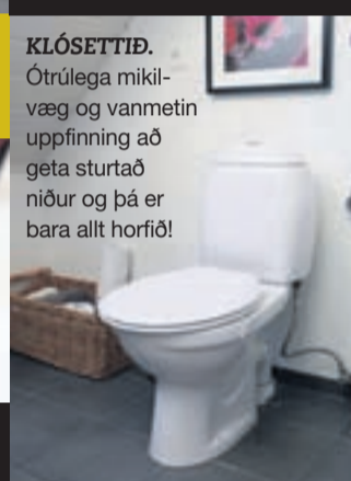
KLÓSETTID. Ótrúlega mikil- væg og vanmetin uppfinning að geta sturtað niður og þá er bara allt horfið!