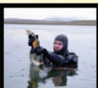
FISKELDIS- OG FISKALIFFRÆÐIDEILD diplóma í fiskeldisfræði einnig boðið í fjarnámi BS í sjávar- og vatnalíffræði í samvinnu við HI