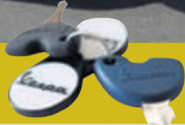
LYKLARNIR AÐ VESPUNNI eru nauðsynlegir. Annars er Vespan ónothæf.