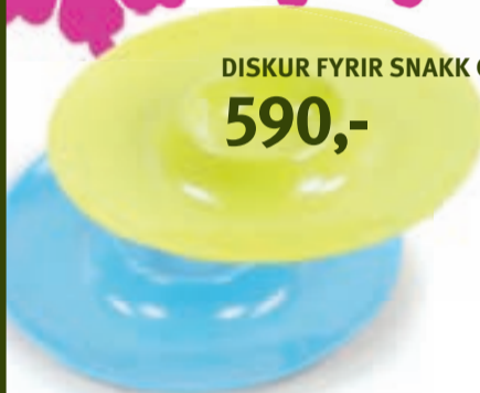
DISKUR FYRIR SNAKK OG DÝFU