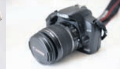
MYNDAVÉLIN MÍN. Ótrúlega gaman að taka myndir á almennilega ljósmyndavél.