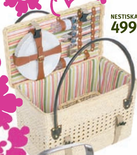
NESTISKARFA fyrir 4 4990,-