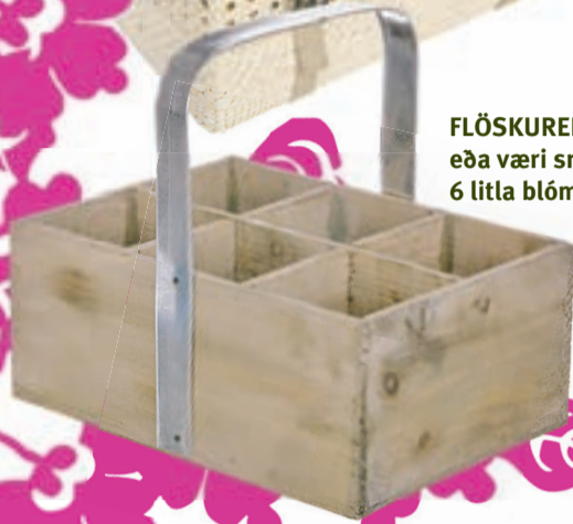
FLÖSKUREKKI eða væri sniðugt að setja 6 litla blómappotta í hirsluna?