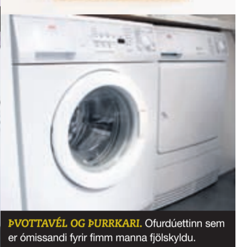
ÞVOTTAVÉL OG ÞURRKARI. Ofurdúettinn sem er ómissandi fyrir fimm manna fjölskyldu.