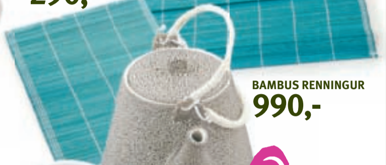
BAMBUS RENNINGUR 990,-