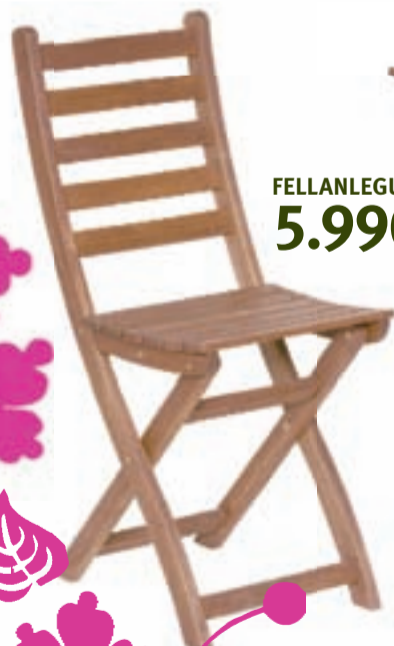
FELLANLEGUR STÓLL 5.990,-