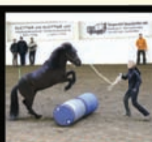
HESTAFRÆÐIDEILD hestafræðingur og leiðbeinandi tamningamaður þjálfari og reiðkennari

Námið er boðið í staðnámi og fjarnámi með staðb. lotum