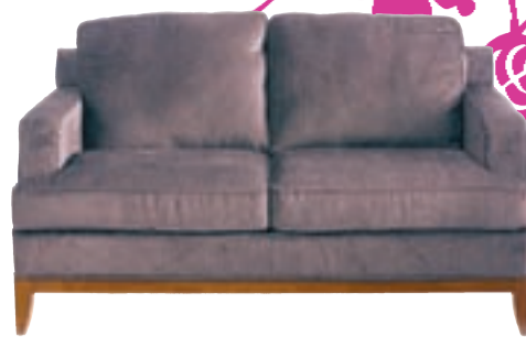
BRÚNN SÓFI verð 69.900,- nú 41.940,-