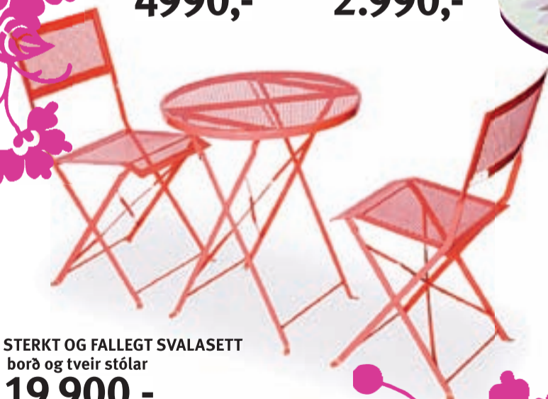
STERKT OG FALLEGT SVALASETT borð og tveir stólar 19.900,-

Vinsælu keramik borðin komin aftur frábært verð!