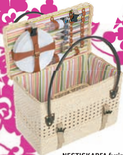
NESTISKARFA fyrir 4 4990,-