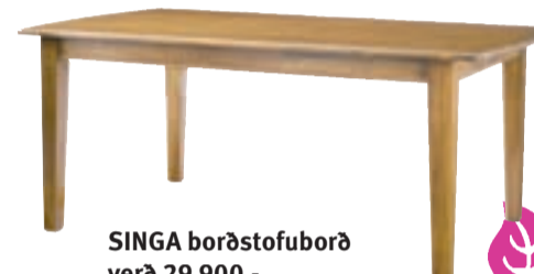
SINGA borðstofuborð verð 29.900,- nú 14.950,-