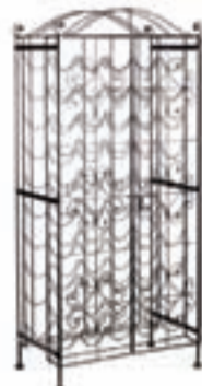
VINREKKI verð 15.900,- nú 6.360,-