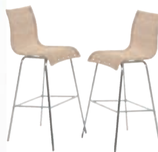
BARSTÓLAR tveir saman verð 17.900,- nú 8.950,-