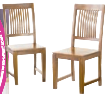
KERALA stólar verð 9.990,- nú 5.994,-

3 fyrir 2 af öllum snyrtivörum um helgina