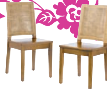
STÓLAR tveir saman verð 19.900,- nú 11.940,-