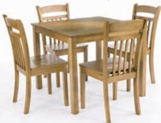
TAMMANSETT borð og fjórir stólar verð 29.900,- nú 17.940,-