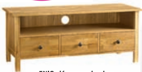
ENIS sjónvarpsskenkur verð 24.900,- nú 15.540,-