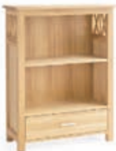
NEWPORT bókkaskápur verð 29.900,- nú 17.940,-