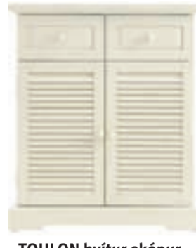
TOULON hvítur skápur verð 19.900,- nú 7.960,-