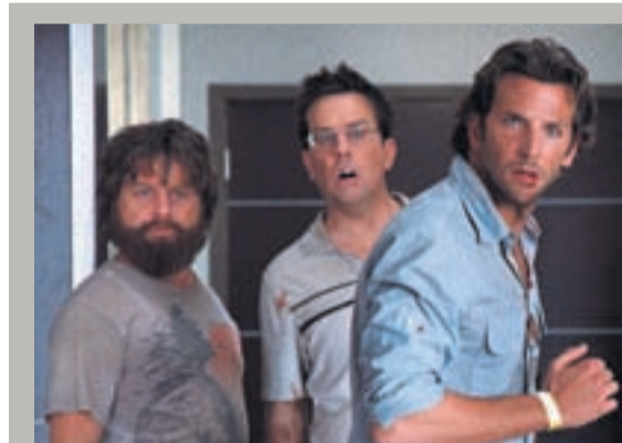
The Hangover Gamanmyndin hélt efsta sæti sínu yfir vinsælustu myndirnar vestanhafs.