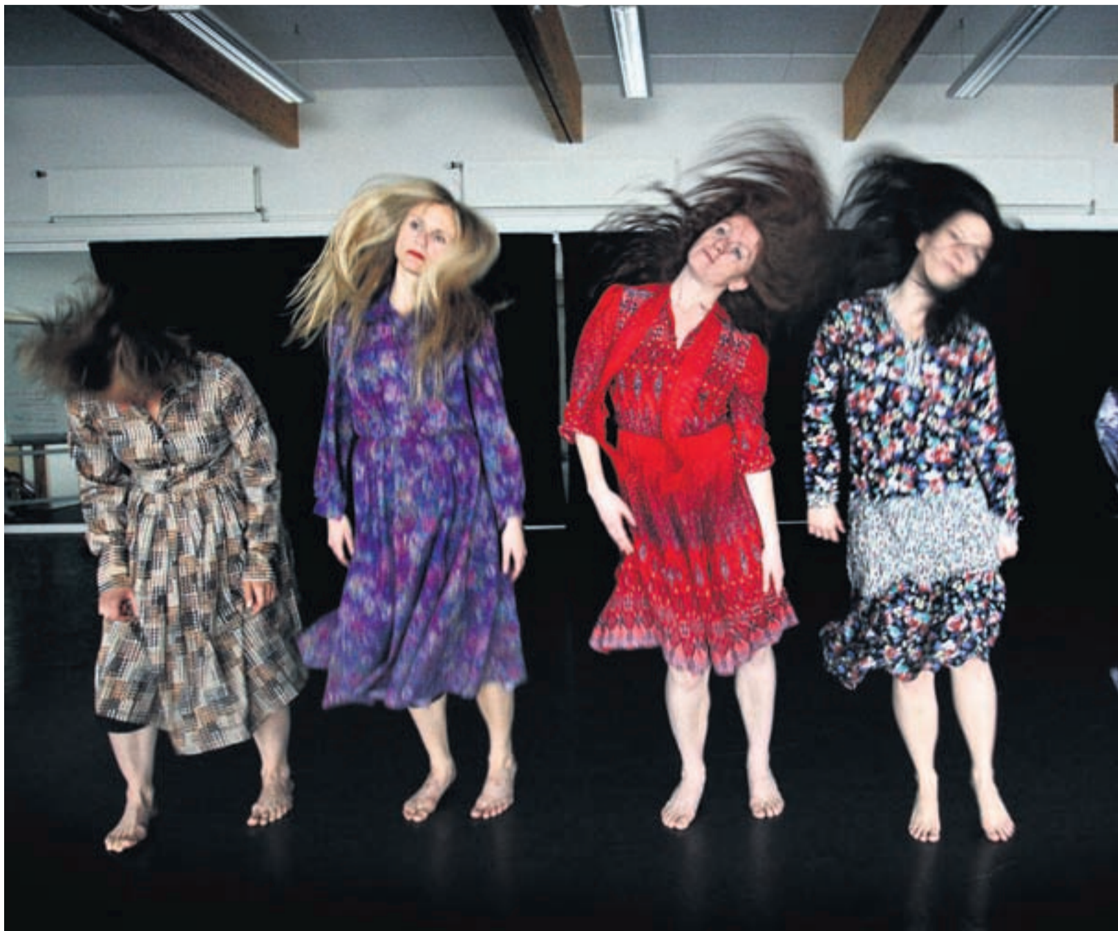
Í Teach Us How to Outgrow Our Madness takast fimm konur á við sína innri djöfla. Verkið verður sýnt á Stóra sviði Þjóðleikhússins í kvöld, á baráttudegi íslenskra kvenna.