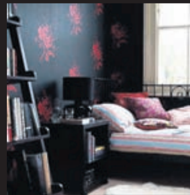
Veggfóður Prufaðu dökkan lit á einn vegg.

Það er alltaf gott að breyta til heima hjá sér og ekkert notalegra en að eiga afdrep frá skarkala umheimsins í svefnherberginu. Þessi herbergi verða oft út undan hjá okkur þegar við fegrum heimilið vegna þess að gestir sjá þau sjaldan en það er auðvitað full ástæða til að gæða þau notalegheitum og rómantik. Hvernig væri til dæmis að veggfóðra einn vegg, kaupa munúðarfullar rauðar gardínur í anda David Lynch eða skella litríkum púðum í fallegum efnum á rúmið? Fallega spegla má grafa upp í antíkverslunum og gera líka mikið fyrir andrúmsloftið. Svo er auðvitað skemmtilegt að leyfa bókum og fallegum klæðum að vera til sýnis því að minimalisminn þarf ekkert að vera allsráðandi í herberginu þar sem við elskumst og sofum.