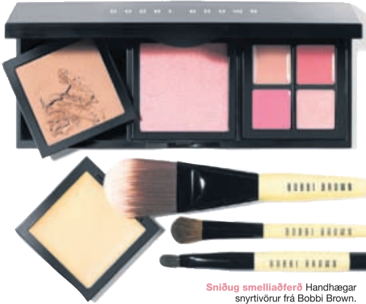
Sniðug smelliaðferð Handhægar snyrtivörur frá Bobbi Brown.