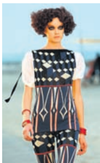
Skrautlegt Smart samfestingur sem minnir á hefðbundin Feneyjaklæði.