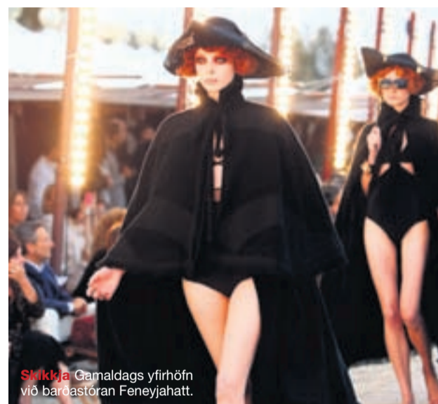
Stykkja Gamaldags yfirhöfn við bardastöran Feneyjahatt.

20 ÁRA AFMÆLISHRINGFERÐ FM957 ELDHÚSPARTY OG MIDNÆTURDANSLEIKUR