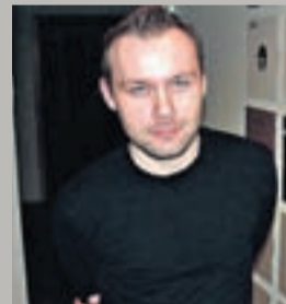
Thule Records hefur verið endurvakið, þó með örlítið breyttu sniði.