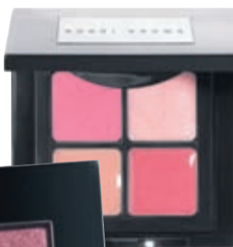
Gloss Rósráuðir náttúrulegir tónar.

„Customise“-vörurnar frá snyrtivörufrýr-tækinu bandaríska Bobbi Brown eru sérlega handhægar. Þar er hægt að velja um litapallettur fyrir kinnar, augu og varir sem smella í þartilgerð box sem er þægilegt að hafa í töskunni. Nú í fyrsta sinn er hægt að fá hið frábæra Bobbi Brown Foundation stick meik í „kompakt“ formi, það er að segja í litlu þar til gerðu boxi sem er frábært í snyrtibudduna. Þá er hægt að draga það fram til að lagfæra andlitið síðla dags og það er líka sniðugt ef maður vill bara farða sig lítið, eins og á nefið og undir augun. Í sumar eru varapalletturnar frá Bobbi Brown í náttúrulegum rósráðum og karamellulituðum tónum og kinnaliturnar Shimmer Blush er nú fánlegur í tveimur nýjum rósráðum litum.