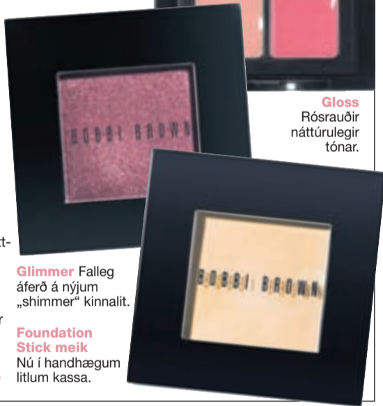
Glimmer Falleg áferð á nýjum „shimmer“ kinnalit.