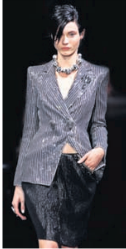
Vandað Athygli vöktu þau vönduðu efni sem notuð eru í línunni.