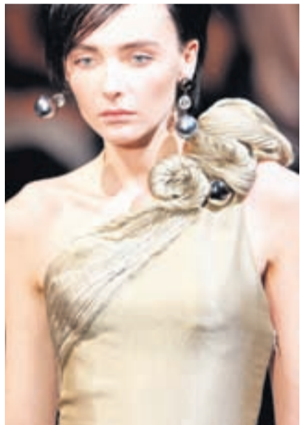
Íburður Nýjustu línu Armani hefur verið lýst í tveimur orðum: Bling bling. Þessi gyllti kvöld- kjóll rennir stoðum undir þá fullyrðingu.

Tískuhönnuðurinn Giorgio Armani blæs á allt kreppu- tal í nýjustu fatalínu sinni sem sýnd var nú á tískuvikunni í París. Eins og meistarans var von og vísa var fatnaðurinn klassískur á að líta þar sem svart, hvítt, grátt, silfrað og blátt var áberandi. Kvenleg snið í bland við strákslegan fatnað féllu í kramið og sérstaka athygli vöktu dýr og vönduð efni, loðfeldir og önnur munaðarvara, sem er í hrópandi mótsögn við ríkjandi efna- hagsástand.