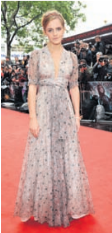
Emma Watson