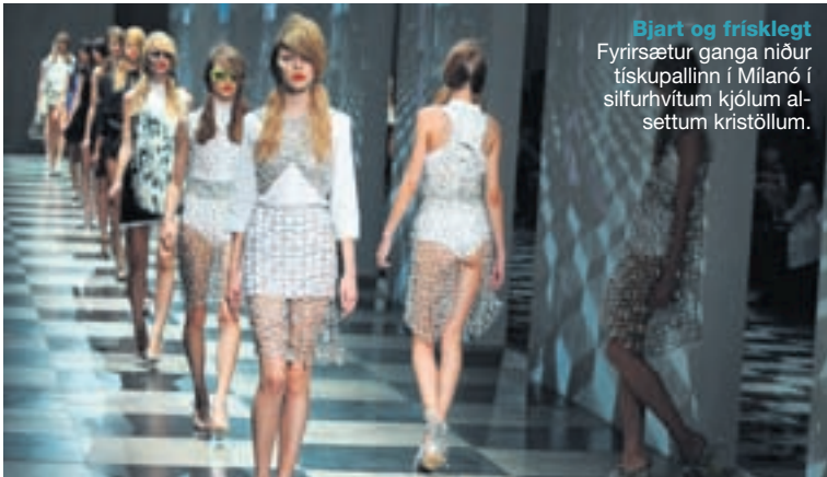
Bjart og frísklegt Fyrirsætur ganga niður tiskupallinn í Milanó í silfurhvítum kjólum alsettum kristöllum.