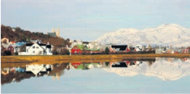
Spennandi tilboð Úr mörgu verður að velja á dömulegum dekurdögum næstu helgi.