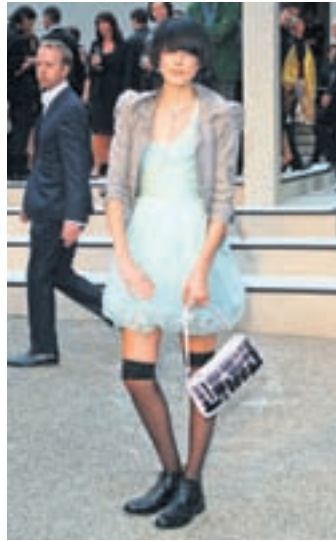
SKOSKA FYRIRSÆTAN Agyness Deyn var svöl með svart hár á sýningu Burberry í London um daginn.