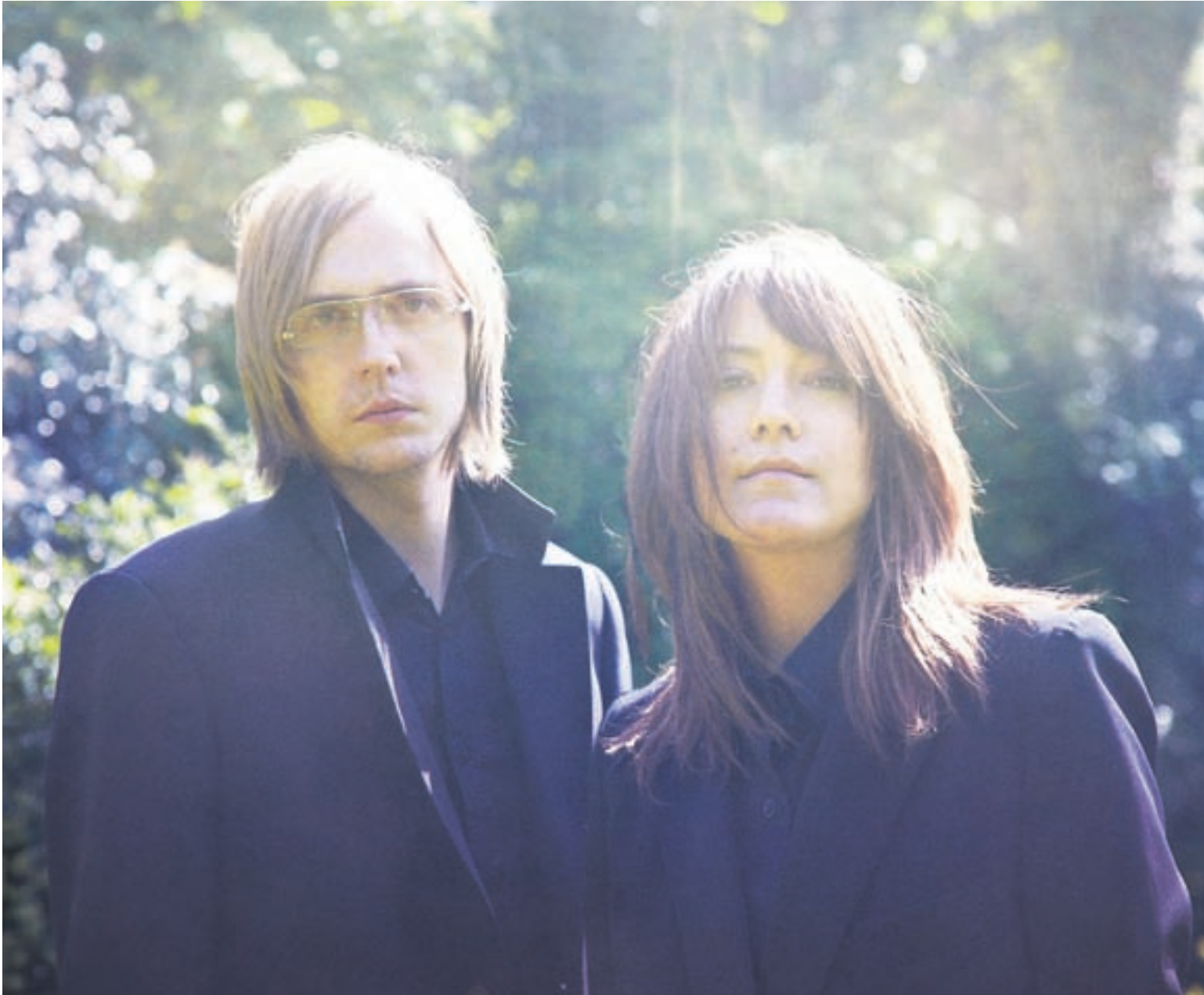
Kynþokkafullir heimsborgarar Lady & Bird.

Tja já, smá! Nú fékk franska plötubúðakeðjan FNAC ykkur Keren nýlega til að velja titla í sérstakar útstillingar í búðunum. Hvað kom út úr því? „Við völdum tíu diska, tíu