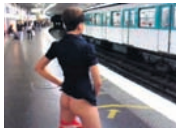
Kínki dagbækur Sænska ríkið styrkir framleiðslu Dirty Diaries.

Það eru vissulega skiptar skoðanir á klámi en Svíar eru framúrstefnulegir að vana á kynlífssviðinu. Dirty Diaries er samansafn klámmynda fyrir femínista, styrkt af sænska ríkinu, og engar tvær þeirra eru gerðar af sama leikstjóranum. Mikill metnaður hefur verið lagður í myndirnar og eins og textinn á heimasíðu Dirty Diaries segir þá snúast þær um fullnægingar og list fyrir opinn huga. Hér er að finna gagnkynhneigða og samkynhneigða erótík, sýniþörf, blæti og ögrun og myndirnar hafa fengið lofsamlega umfjöllun frá bæði sænsku og erlendu pressunni. „Kvikmyndaheimurinn samþykkir klám,“ sagði dagblaðið Dagens Nyheter. Dirty Diaries er með áhugavert manifesto þar sem lýst er