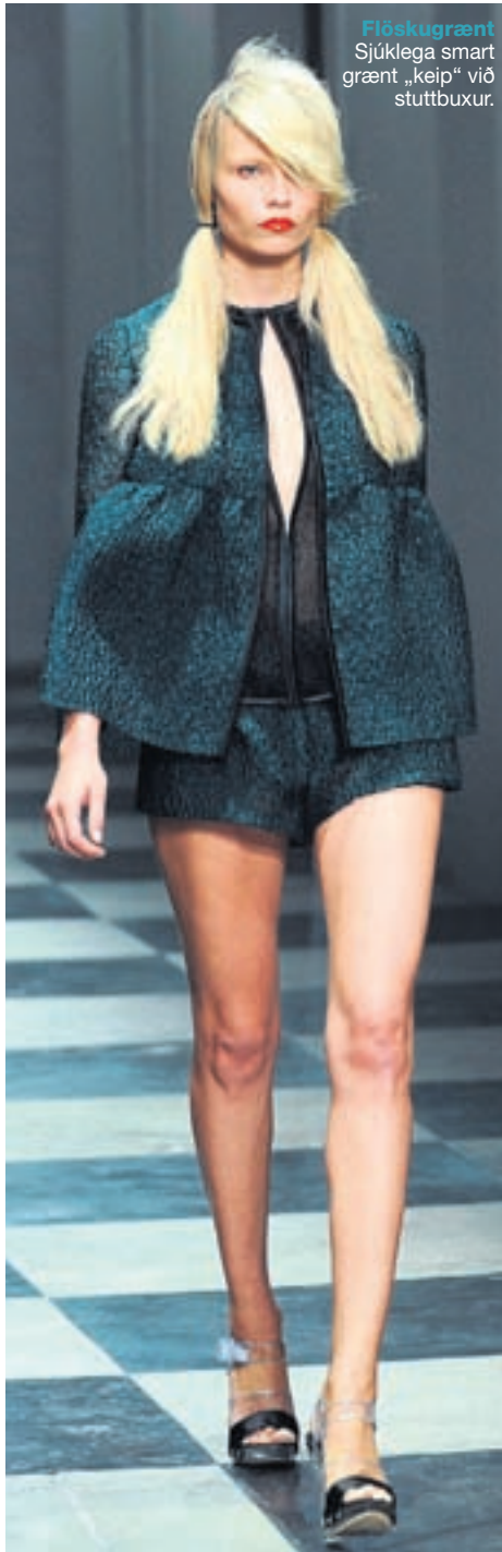
Flöskugrænt Sjúklega smart grænt „keip“ við stuttbuxur.