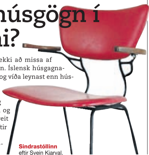
Sindrastóllinn eftir Svein Kjarval.

Hönnunarsafn Íslands, Lyngási 7, Garðabæ. Leiðsögn kl. 15-17. Aðgangur ókeypis.