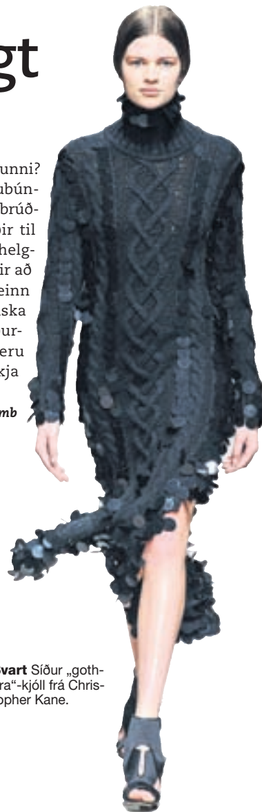
Svart Síður „gothara“-kjóll frá Christopher Kane.