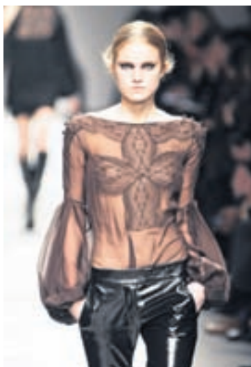
Kvenlegt Skemmtileg samsetning af finni blúndu við latex-buxur frá Givenchy.