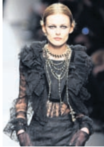
Blúndur Gamaldags blúnda virkar alltaf til að framkalla vampírúhrifin – þessi er frá Givenchy.