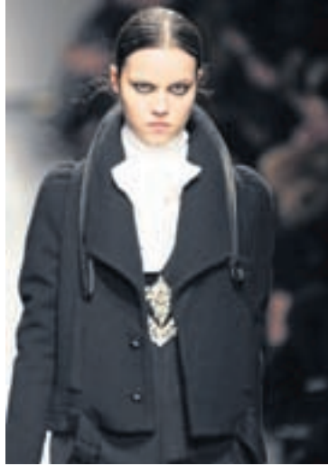
Gamaldags „goth“ Viktoríönsk blúnduskyrta við frakka frá Givenchy.