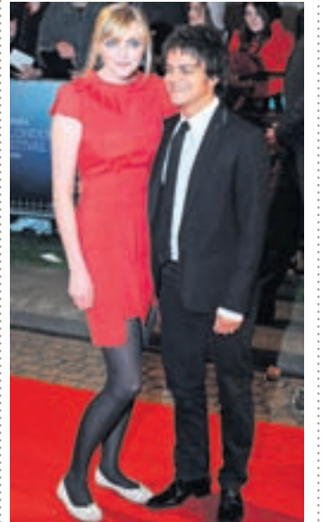
BRESKA FYRIRSÆTAN OG BARNABARN ROALDS DAHL, SOPHIE, mætti á frumsýningu á „Refnum frábæra“ í London í síðustu viku með kærastanum Jamie Cullum.