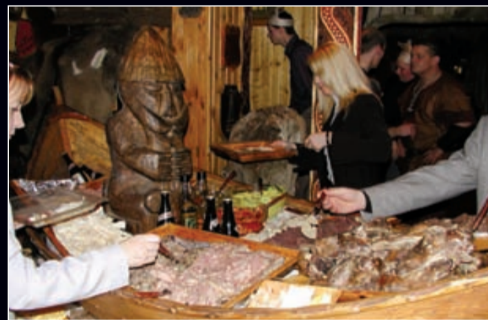
Þorrahlaðborð kr. 5.400 á mann

www.fjorukrain.is - Pöntunarsími 565 1213