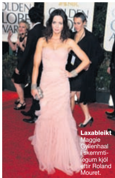
Laxableikt Maggie Gyllenhaal í skemmtilegum kjól eftir Roland Mouret.