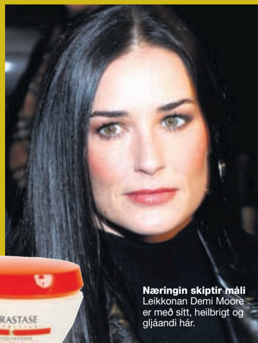
Næringin skiptir máli Leikkonan Demi Moore er með sitt, heilbriggt og gljáandi hár.