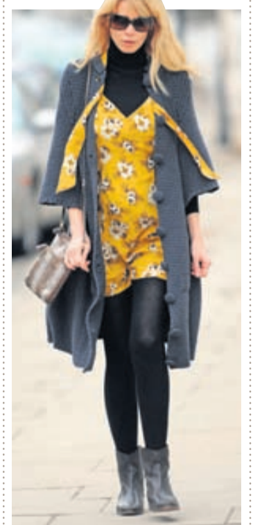
ÓLÉTT OG SÆT Ofurfyrirsætan Claudia Schiffer gengur með þriðja barn sitt og er nú komin fjóra mánuði á leið. Hér sést hún á gangi um Nottingham Hill-hverfi Lundúna í gær.