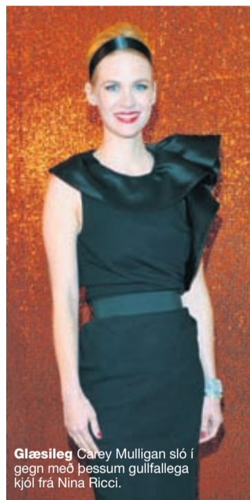
Glæsileg Carey Mulligan sló í gegn með þessum gullfallega kjól frá Nina Ricci.