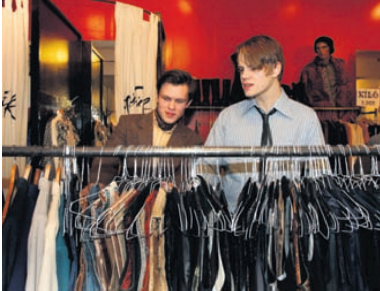
Jakkaföt valin Strákarnir ákváðu að vera flottir í tainu á næstu tónleikum.