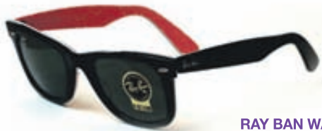
RAY BAN WAYFARER Verð 24.800 kr.

Flott sóglæraugu og fallegar umgjærðir breyta öllum í töffara!