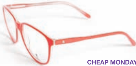
CHEAP MONDAY GLERAUGU Verð 25.800 kr.

LINSAN S: 551-5055, ADALSTRÆTI 9. WWW.LINSAN.IS