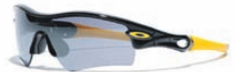
OAKLEY M: Livestrong 12-763 C: Jet Black L: Black Iridium Þessi glæraugu frá Oakley „Livestrong“ eru notuð af mesta afreksmanni í heimi í hjólræiðum, Lance Amstrong. Þau koma með auka nefstykki og harðri óskju. Vörn glers: 100% UVA / UVB / UVC gegn skaðlegum geislum upp að 400nm. Skoðið nánar á www.opticalstudio.is .