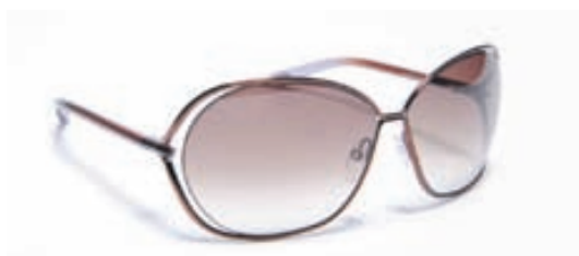
TOM FORD M:Carla 157 C:48F S:66/12 Þetta er hönnun sem er engu lík, hvernig skilgreinum við þessa hönnun, nútímaleg með „twisti“ af Hollywood glamor frá sjötta áratuginum. Skoðið nánar á www.opticalstudio.is .