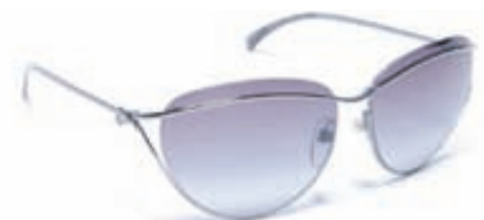
CHANEL M:4181 C:108/3C S:60/16 Eins og áður er fágun í hönnun á Chanel glæraugum sem eru í senn tímalaus og alltaf í tisku. Skoðið nánar 2010 ína á Chanel sóglæraugum og umgjörðum á www.opticalstudio.is