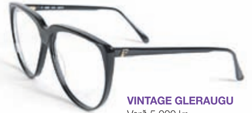
VINTAGE GLERAUGU Verð 5.000 kr.

LINSAN S: 551-5055, ADALSTRÆTI 9. WWW.LINSAN.IS