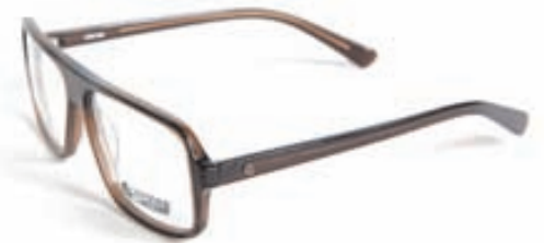
CHEAP MONDAY GLERAUGU Verð 25.800 kr.