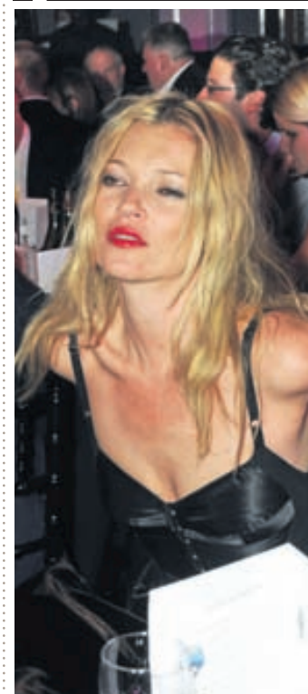
HRESS Fyrirsætan Kate Moss lék á als oddi á góðgerðasamkomunni Mummy Rocks í Lundúnum fyrir skömmu.