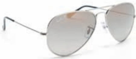
RAY BAN TITANIUM POLARIZED M:8041 C:086/M3 S:58/14. Ný útfærsla á Pilot Classic, Títaníum umgjörð og Polaroid linsa. Skoðið 116 Ray Ban myndir af úrváli Optical Studio á www.opticalstudio.is .

GLERAUGNAMÍÐSTÖÐIN Laugavegi 24, sími : 552-0800