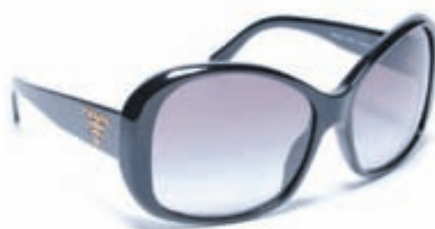
PRADA M:03M C:1AB-3M1 S:59/15 Prada sóglæraugu hafa löngum verið vinsæl hjá þeim sem hafa mótað tiskuna á hverjum tíma. Sennilega hefur Prada sóglæraugnalínan 2010 aldrei verið glæsilegri. Skoðið nánar á www.opticalstudio.is