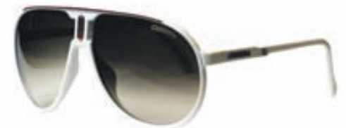
CARRERA Verð 34.500 kr.

GLERAUGNAMÍÐSTÖÐIN Laugavegi 24, sími : 552-0800