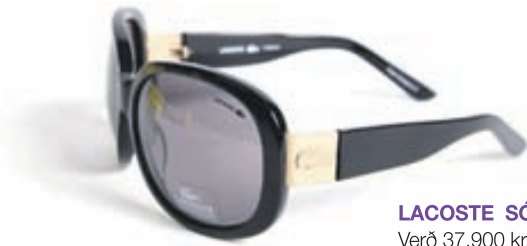
LACOSTE SÓGLERAUGU. Verð 37.900 kr.