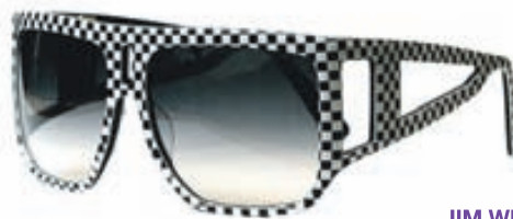
JIM WILDE Verð 24.500 kr.