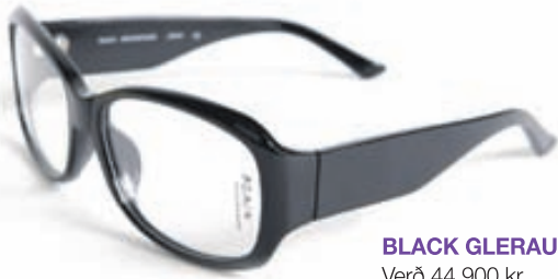
BLACK GLERAUGU Verð 44.900 kr.