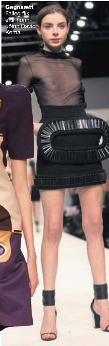
Gegnsætt Falleg flík eftir hönnuðinn David Koma.