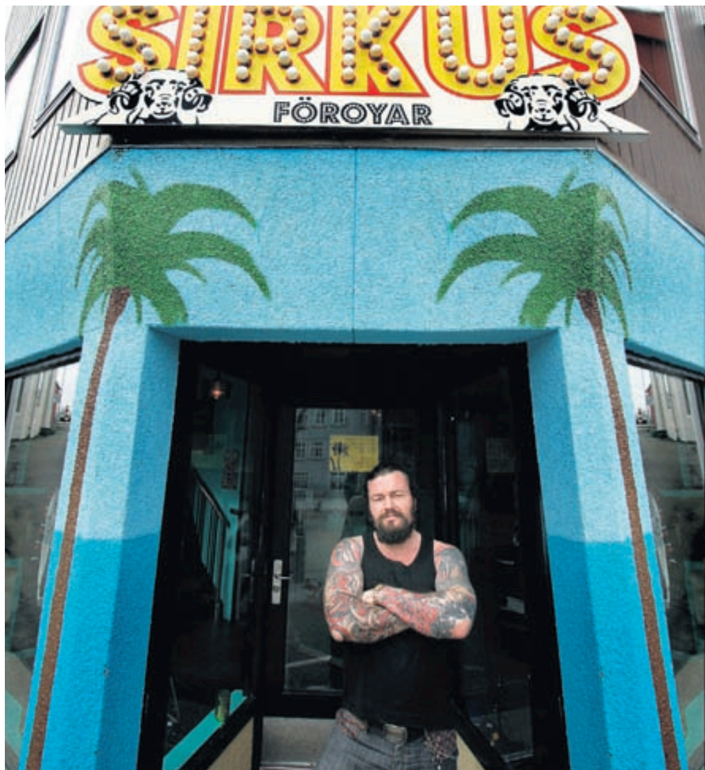
Færeyingar gestrisnir við Íslendinga Fjölur flúrar í sama húsi og skemmtistaðurinn Sirkus.