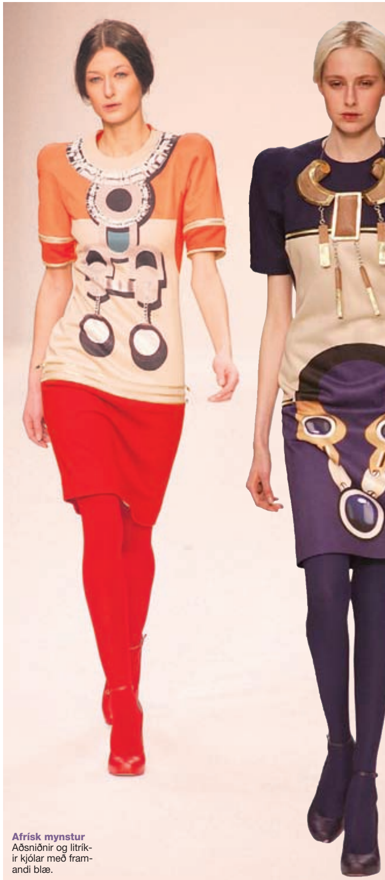
Afrísk myndur Aðsniðir og litríkir kjólar með framandi blæ.

VORBOÐI Þessir undraverðu skór eru úr vor- og sumarlínu kron by kron kron og eru tilvaldir til að lífga upp á dökkan fataskáp vetrarins.