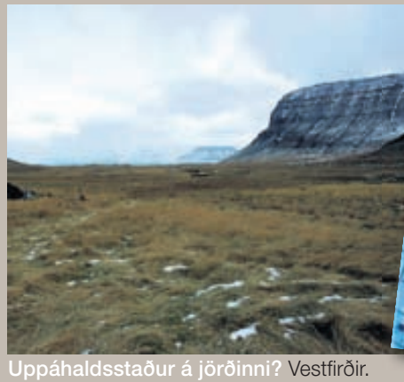
Uppáhaldsstaður á jörðinni? Vestfirðir.