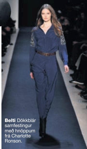
Belti Dökkblár samfestingur með hnöppum frá Charlotte Ronson.