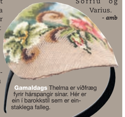
Gamaldags Thelma er víðfræg fyrir hársþangir sínar. Hér er ein í barokkstíl sem er einstaklega fallett.