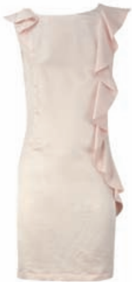
NUDE FRILL SHIFT DRESS Er einnig til í gráu og svörtu Verð: 16.990 kr.

VERSLUNIN - OASIS Kringlunni og Smáralind