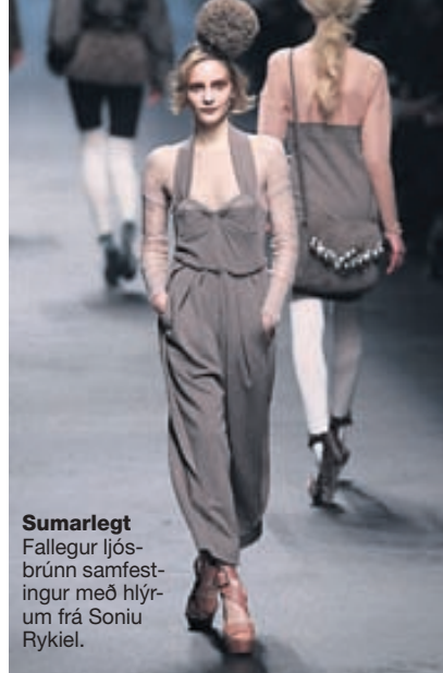
Sumarlegt Fallegur ljósbrúnn samfestingur með hlýrum frá Soniu Rykiel.