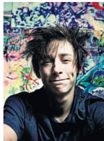
Lokar tímabundið Hönnuðurinn Mundi lokar verslun sinni tímabundið. Hönnun hans fæst þó áfram í GK Reykjavík.

Hinn 12. maí verður ný sumarlína frá Munda kynnt í versluninni GK Reykjavík og í tilefni þess verður efnt til veislu. „Línan mun innihalda léttu kjóla, jakkaföt og aðrar sumarlegar flíkur. Við ætlum að halda upp á þetta á miðviku-