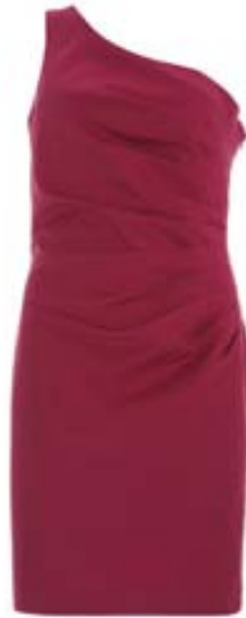
Verð: 14.990 kr.

VERSLUNIN WAREHOUSE Kringlunni og Smáralind