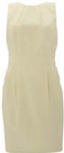
Verð: 15.990 kr.

VERSLUNIN WAREHOUSE Kringlunni og Smáralind