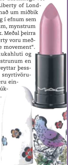
Fallegar umbúðir Mjúk-ir bleikir, gráir, bláir og grænir tónar einkenna litapallettuna

Snillingarnir hjá Mac hafa nú skapað dásamlega vorlega línu ásamt breska merkinu Liberty of London. Liberty er fyrirtæki sem var opnað um miðbik nítjándu aldar í Bretlandi og sérhæfði sig í efnum sem skörtuðu fögrum blóma- og fuglamyndum, mynstrum sem eru löngu orðin að tímalausri klassík. Meðal þeirra listamanna sem gerðu mynstur fyrir Liberty voru meðlimir listaklúkkunnar „The Pre-Raphaelite movement“. Liberty-tískuhúsið framleiðir fatnað, aukahluti og jafnvel gúmmístígvél með Liberty-mynstrunum en nú eru sumsé fáanlegar snyrtivörur skreyttar þessum „art nouveau“-mynstrum. Litirnir í snyrtivörulínunni sem Mac skapaði fyrir Liberty eru einmitt innblásnir af myndunum og eru í mjúkum bláum, grænum og bleikum tónum. Snyrtivörurnar eru svo fagrar að það ætti að verða hrein unun fyrir allar skvísur að eiga slíkt góss í veskinu í vor. Rómantískt, hippalegt og gamaldags.