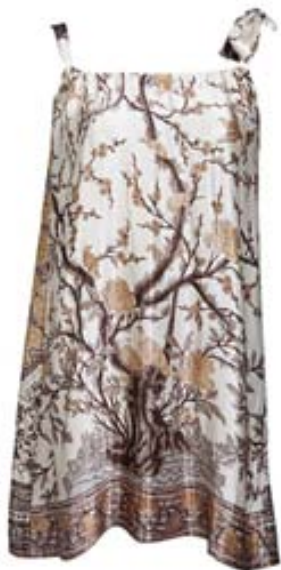
Verð: 49.990 kr.