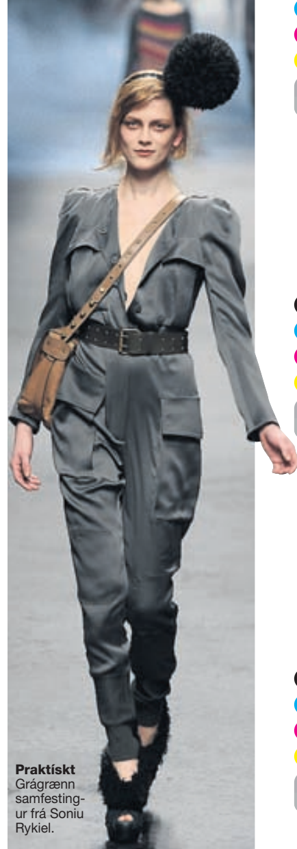
Praktískt Grágrænn samfestingur frá Soniu Rykiel.