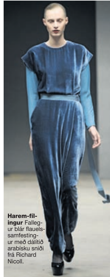
Harem-fil-ingur Fallegur blár flauels-samfestingur með dálítið arabísku sniði frá Richard Nicoll.