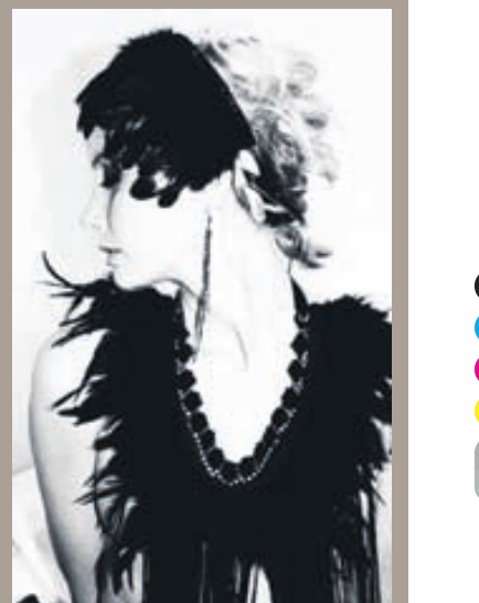
Fjaðrir Íslenska hönnunarteymið Varius gerir töff og örlítið gotneskt hárskraut úr hrafnstjórnum.