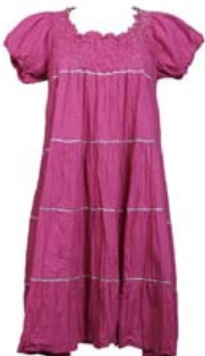
Verð: 29.990 kr. Einnig til í hvítum lit