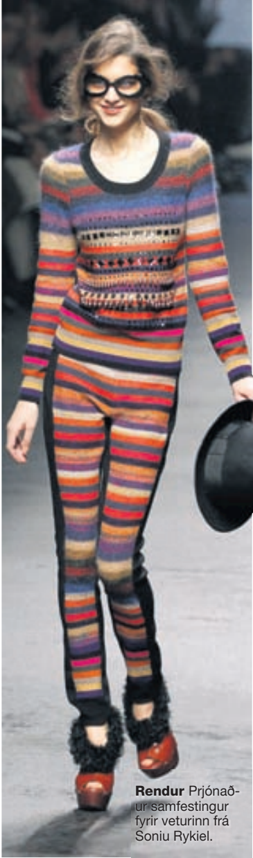
Rendur Þrjónaður samfestingur fyrir veturinn frá Soniu Rykiel.

Kisulórusamfestingar eru heila málið í sumar en fjöldinn allur af hönnuðum sýndi þá í margvíslegum útgáfum bæði fyrir vor og sumar og næsta haust og vetur. Franska tískudrottningin Sonia Rykiel virðist sérstaklega hrifin af þessari praktísku flík en hún var bæði með dásamlega víða blómasamfestinga og khaki-litaða „safari“ samfestinga fyrir vorið. Á sýningum fyrir haust og vetur sýndi hún svo kynþokkafulla röndóttu samfestinga í Rykiel-litapallettunni. Breski hönnuðurinn Richard Nicoll gerði skemmtilega samfestinga úr flaueli í falletum bláum og vínrauðum tónum og eins valdi bandaríski hönnuðurinn Charlotte Ronson bláa litinn á samfestinga sem voru eins og skyrtu að ofan. - amb