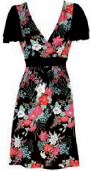
ORIENTAL FLOWER DRESS Verð: 14.990 kr.

VERSLUNIN - OASIS Kringlunni og Smáralind