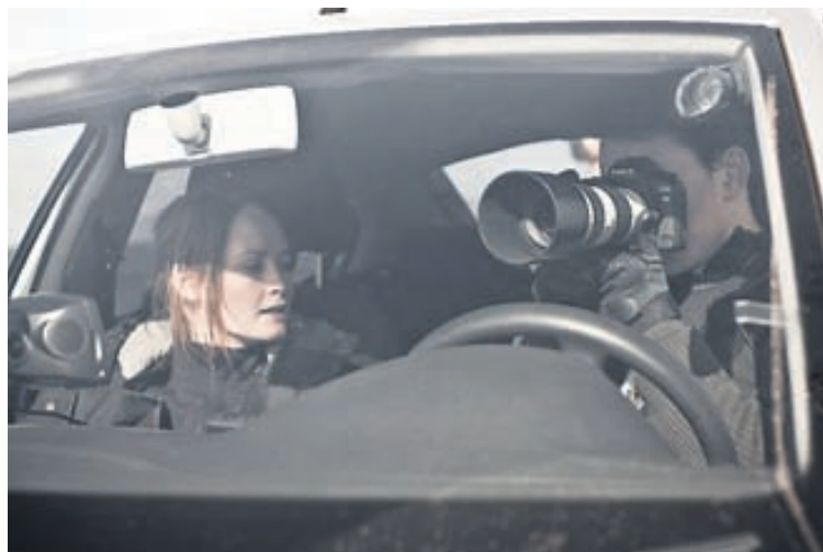
Glæpagengi takast á við lögregluna Hér sést víkingasveitin í tókum á Borgríki.

Spurð um hvort hún hafi öðlast nýja sýn á íslenska undirheima í gegnum tókum myndarinnar segist Ágústa Eva auðvitað hafa velt þeim málum meira fyrir sér en ella. „En ég held ekki að við þurfum að hafa neinar sérstakar áhyggjur. Til hvers að hafa áhyggjur? Þetta er ekkert verra en annars