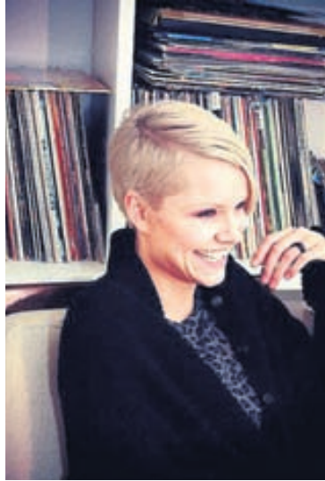
Skófikill María Birta Bjarnadóttir, eigandi skóverslunarinnar Maníu, segir ánægjulegt að vera komin í stærra húsnæði.

Manía er fyrst og fremst skóverslun en þar má einnig finna fjölbreytt úrval af sólgleraugum auk annarra fylgihluta. „Við seljum í raun allt sem byrjar á bókstafnum s, skó, sólgleraugu, sokkabuxur og skart,“ segir María Birta og hlær. Aðspurð viðurkennir hún fúslega að vera veik fyrir fallegum skóm líkt og flestar konur. „Jú,