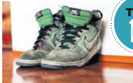
SKÓRNIR SEM AMMA GAF MÉR FYRIR SIRKA ÞREMUR ÁRUM OG ERU ENN GÖNGUFÆRIR ERU LÍKA Í MIKLU UPPÁ- HALDI.