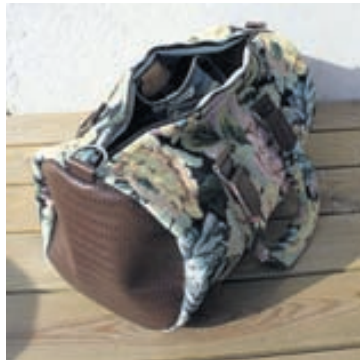
Fallegar töskur Aron hagnar skemmtilegar töskur úr leðri og skosku tweed efni. Töskurnar eru ætlaðar báðum kynjum.