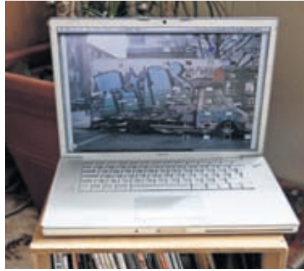
TÖLVAN MÍN ER EINS OG FRAMLENGING AF MÉR.