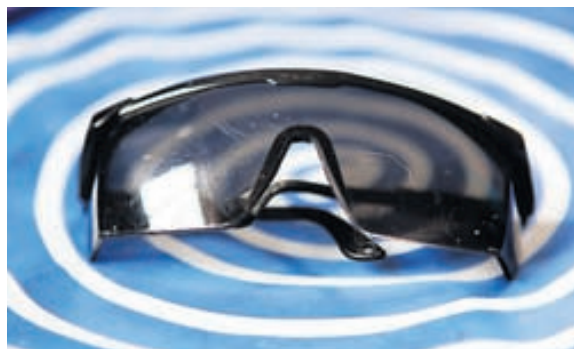
SÓGLERAUGUN SEM MAGGI, VINUR MINN, GAF MÉR HENTA EINSTAKLEGA VEL Í ÍSLENSKU VEÐURFARI.