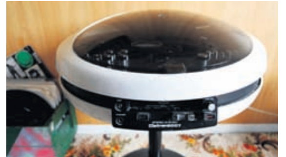
PLÖTUSPILARINN MINN ER HUNDGAMALL EN SPILAR VEL FUNKÍ ENN ÞÁ.