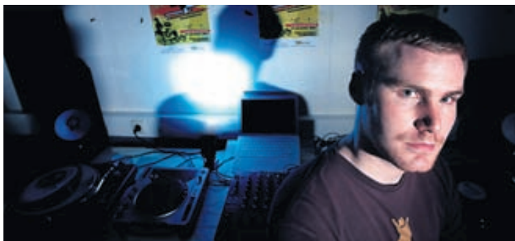
Sumar og sól á Venue Guðni Einarsson lofar góðri stemningu á skemmtistaðnum Venue annað kvöld.