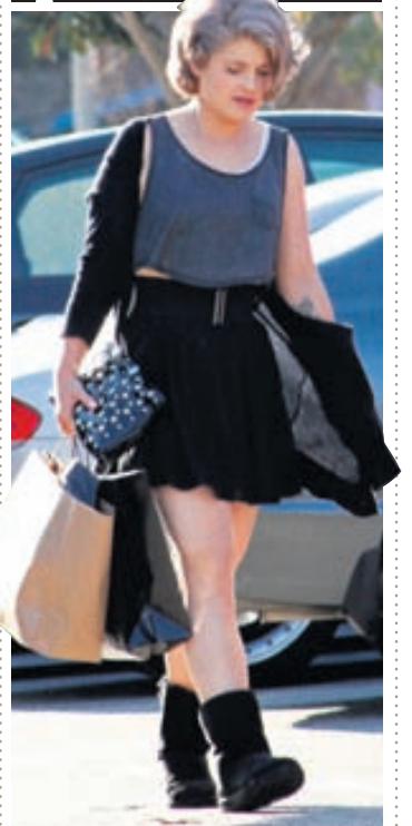
SVÖRT Í SÓLINNI Kelly Osbourne, sem hætti nýverið með unnusta sínum, sást við innkaup í vikunni. Þótt stúlkan sé dökkklædd virðist hún lítið sakna kauða.