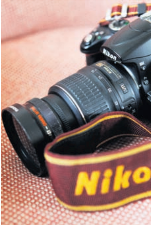
MYNDAVÉLIN ER MÉR MIKILVÆG TIL ÞESS AÐ FANGA AUGNABLIKIÐ.

Sumarið er brátt á enda og því um að gera að nýta síðustu dagana í útilegur, lautarferðir og aðra útivist.