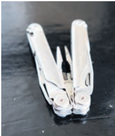
MEÐ LEATHERMAN-HNÍFNUM MÍNUM GET ÉG GERT NÆSTUM ALLT.