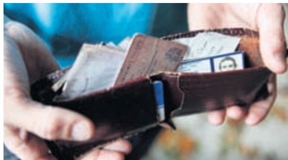
VESKIÐ MITT ER Í MIKLU UPPÁHALDI ÞEGAR ÞAÐ ERU PENINGAR Í ÞVÍ. AUK ÞESS ER HÆGT AÐ GEYMA ALLS KONAR DRASL Í ÞVÍ.

Grandagarði 5 • Reykjavík • S. 568 5305 salon@salon.is