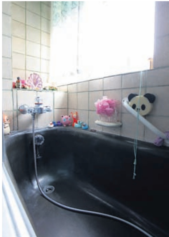
Í BÆÐKERINU FINNST MÉR BEST AÐ „CHILLA“.