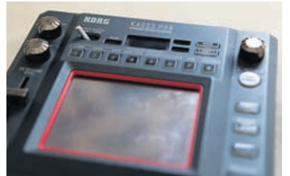
KAOSSPÆÐINN ER ÓMISSANDI TIL AÐ BÚA TIL RINGUL- REIÐ.