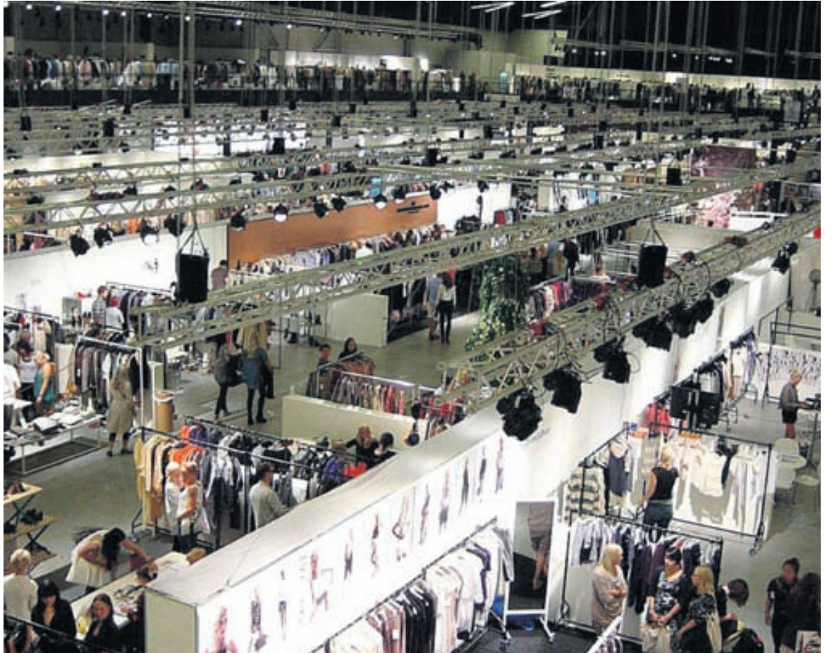
MARGT AÐ SJÁ „Eins og sést á myndinni er margt að sjá og þessi höll er stúf full af alls konar merkjum frá hinum ýmsu stöðum í heiminum.“