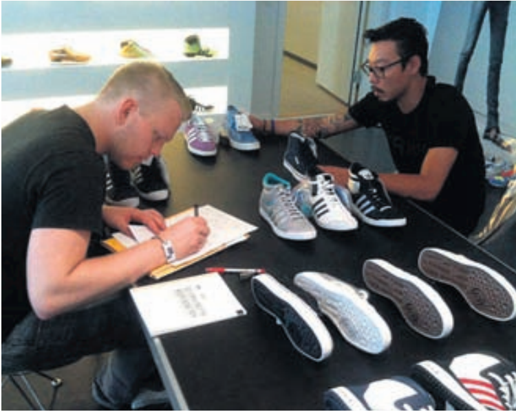
STRIGASKÓR „Þegar úrvalið er mikið þarf maður að geta greint vel hvað það er sem kemur til með að seljast. Hér er ég að panta inn sumar skó frá Adidas.“