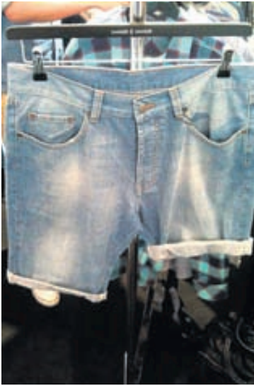
SUMARFÍLINGUR „Stuttbuxur og allt úr gallaefni á eftir að vera mjög vinsælt næsta sumar hjá herrum jafnt sem dömmum – nú vonar maður bara að næsta sumar verði eins gott og í ár.“