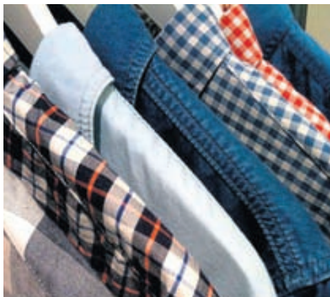
SKYRTUR OG AFTUR SKYRTUR „Galla- og köfl-óttar skyrtur eiga eftir að vera allsráðandi næsta vor og sumar.“