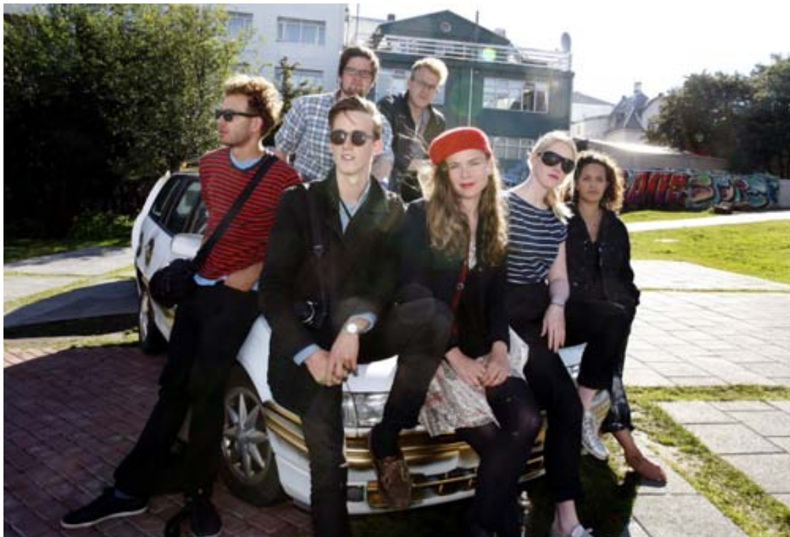
Hluti Festisvallsfólksins Meira en þrjátíu listamenn taka þátt í Festisvalli í Hjartagarðinum á menningarnótt.

Meðal annarra vægast sagt áhugaverðra verka má nefna