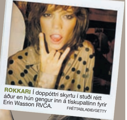
ROKKARI Í doppöttri skyrtu í stuði rétt áður en hún gengur inn á tískupallinn fyrir Erin Wasson RVCA.