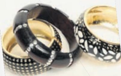
Armbönd gyllt og svört 1.390.-