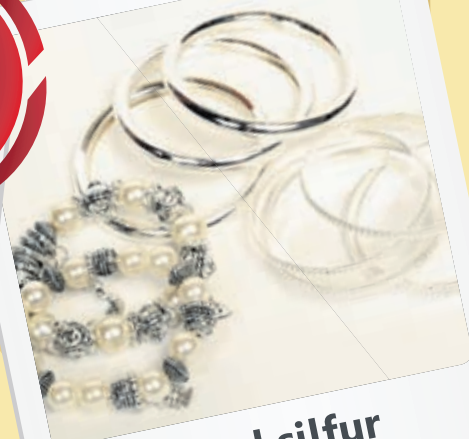
Armbönd silfur frá 590.- settið