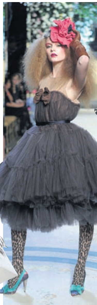
Prinsessukjöll Þessi kjóll var sá sem flestar stúlkur þráðu að eignast úr Lanvin-línunni fyrir H&M.