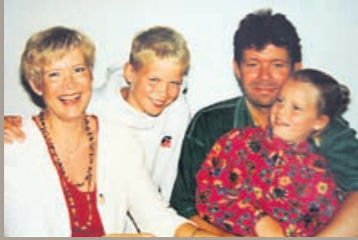
Fjölskyldumynd tekin stuttu eftir að við fjölskyldan fluttum til Íslands frá Danmörku. Við bjuggum þar í rúm fimm ár á meðan pabbi var í námi. Eftir þessa dvöl urðum við forfallnir Kim Larsen aðdáendur og vitum fátt betra en að heimsækja Danmörku.