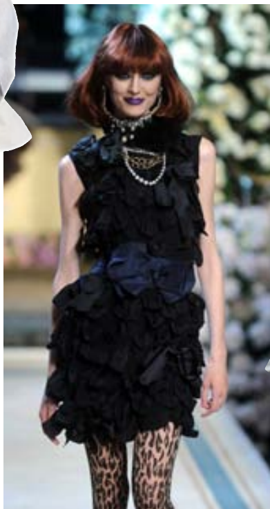
Flott! Æðislegur svartur kjóll við hlébarðasokkabuxur.