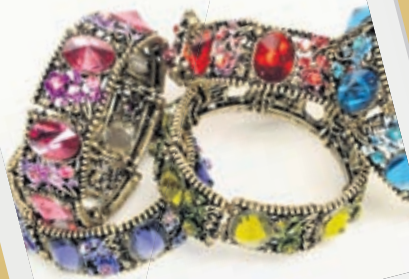
Armbönd marglit 790.-