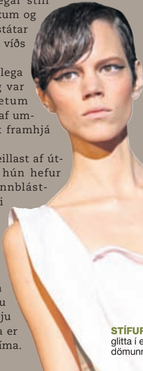
STÍFUR TOPPUR Hér sést glitta í eitt af 16 húðflúrum dömunnar.

Hönnuðir hafa heillast af útliti stúlkunnar og hún hefur verið það mikill innblástur fyrir fatahönnuði að tískuhúsin Chloé og Jill Stuart hafa nefnt tösku í höfuðið á henni og ungstirnið Alexander Wang nefndi eina af sínum vinsælustu skóm í höfuðið á Freju síðasta sumar. Freja er súpermódel okkar tíma.