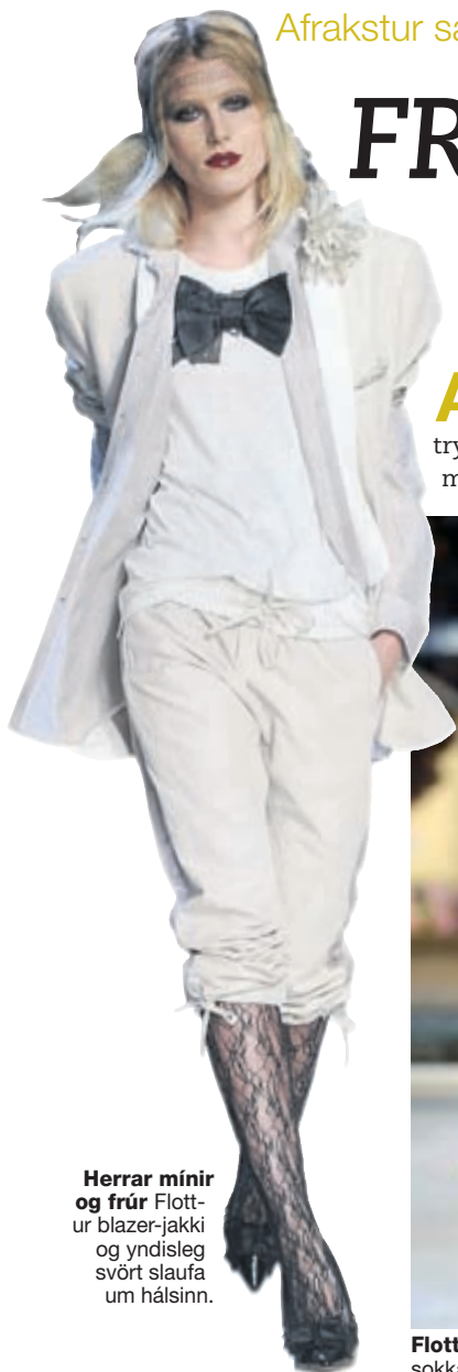
Herrar mínir og frúr Flottur blazer-jakki og yndisleg svört slaufa um hálsinn.

Afrakstur samvinnu sænska fatamerkisins H&M og tískuhússins Lanvin var frumsýndur í New York í síðustu viku. Tískusýningin var litrík, tryllt og vægast sagt skrautleg og minnti einna helst á ávöxt ástarævintýris milli pönksins og níunda áratugarins. - sm