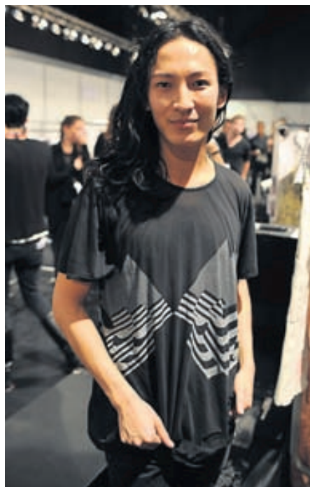
Næstur til að hanna fatnað fyrir almúgann?

N ú þegar fatalína Lanvin fyrir H&M er komin í búðir eru tiskuspekingar strax byrjaðir að velja sér hvaða hönnuður verður næst fyrir valinu.