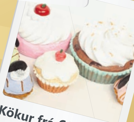
Kökur frá 690 settið