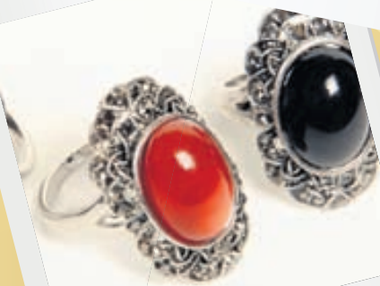
Hringar svartir og rauðir 890.-