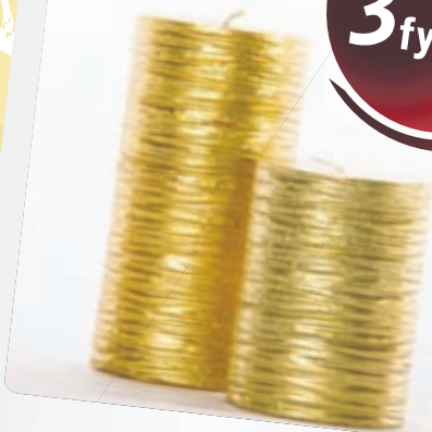
Kerti 3 fyrir 2