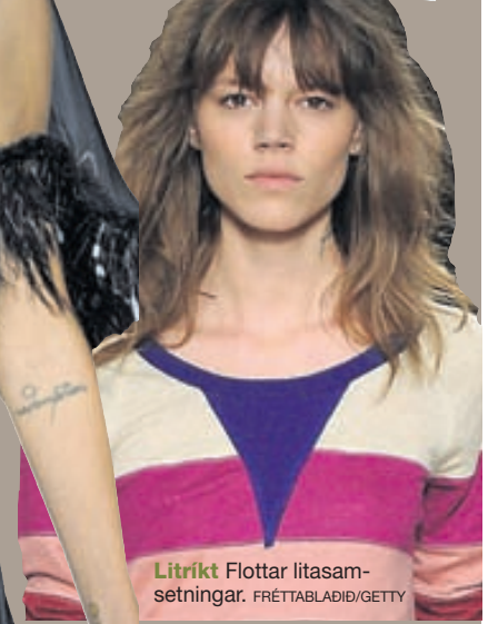
Litríkt Flottar litasamsetningar.