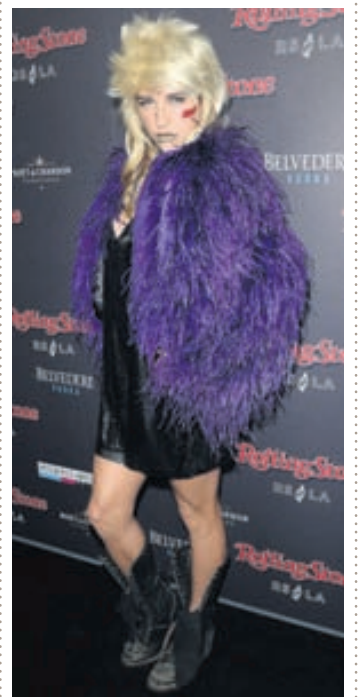
SKRAUTLEG Söngkonan Kesha mætti í þessari munderingu í veislu sem tímaritið Rolling Stone hélt eftir bandarísku tónlistarverðlaunahátíðina sem haldin var á sunnudaginn.