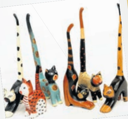
Trédýr frá 490.-