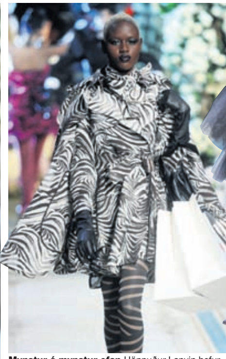
Mynstur á mynstur ofan Hönnuður Lanvin hefur verið óhræddur við að leika sér með ýmis dýramynstur í línunni fyrir H&M.