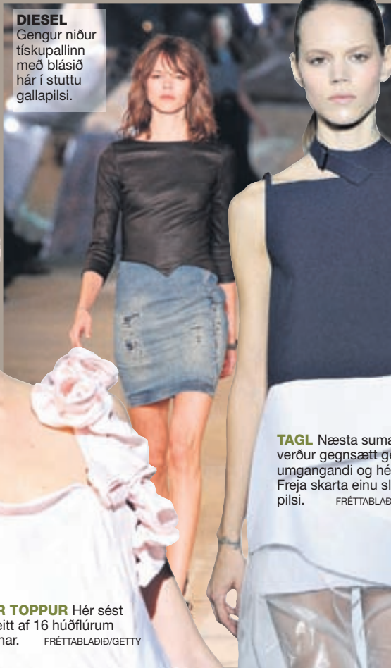
DIESEL Gengur niður tískupallinn með blásið hárl í stuttu gallapílsí.