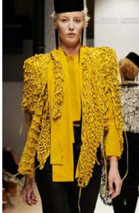
Flottir nýliðar Útskriftasýning nemenda úr Danmarks Design Skole sýndi að þar leynast margir hæfileikaríkir unghönnuðir.