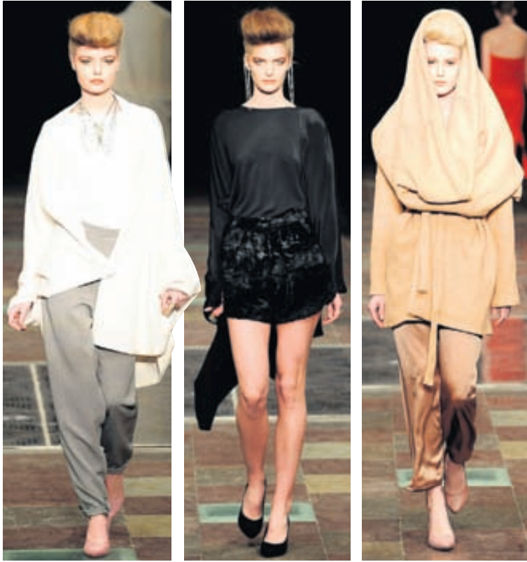
Eftirtektarverð Einföld hönnunin er gædd lífi með stóru og skrautlegu hálsmeni. Fallegar svartar stuttbuxur og þægilegur bolur við. Falleg kamellitúð yfirhöfn við þægilegar buxur frá Vallenes.