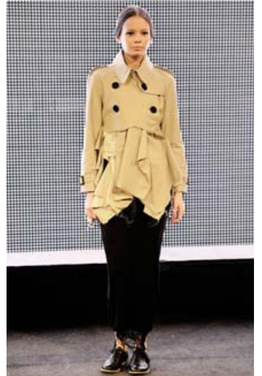
Tjásulegt Ófrágengnir endar og flatbotna skór frá einum nemenda TEKO-hönnunarskólans.