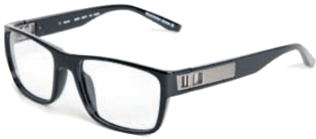
ÖGA GLERAUGU Sterkar og vandaðar umgjarðir. Verð 38.900 kr.