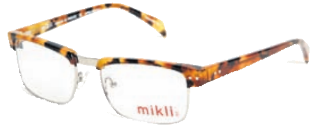
MIKLI GLERAUGU Flott hönnun og fallegir litir Verð 44.900 kr.

LINSAN AÐALSTRÆTI 9, S. 551-5055 facebook.com/linsan.is