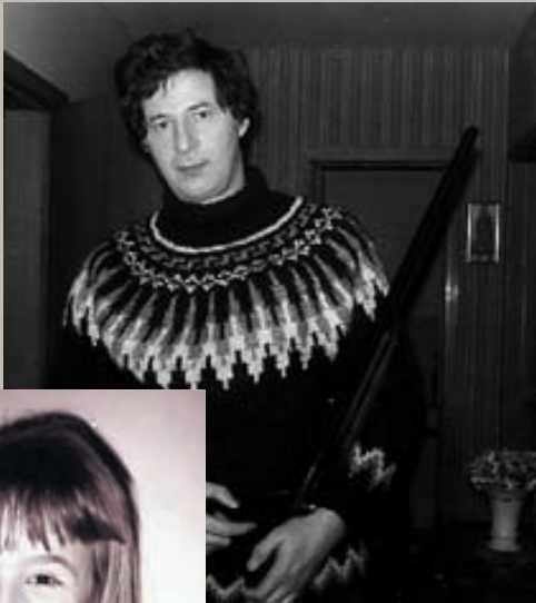
Parna er pabbi á leið í skytt-eri en hann var mikill veiðimaður.