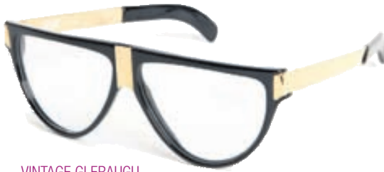
VINTAGE GLERAUGU Gott úrval Verð 5000 kr.