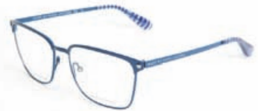
MARC BY MARC JACOBS