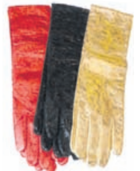
Langir leðurhanskar 70% afsl. verð áður 10.000 kr. verð nú 3.000 kr.