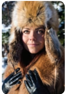
Allar húfur og kragar með 15% afsl. + 1 par af leðurhönskum fylgir frítt með