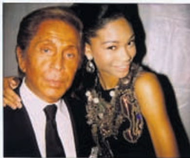
Góðir vinir Iman ásamt hönnuðinum Valentino Garavani.