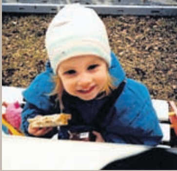
Þessi mynd er tekin af mér þegar ég er rétt rúmlega tveggja ára í fyrstu íbúðinni sem mamma og pabbi fluttu inn í á Vesturgötunni í Reykjavík.