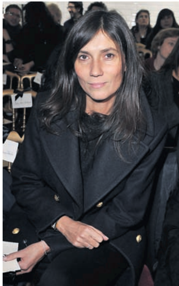
Nýjir tímar Fyrsta tölublað Vogue undir ritstjórn Emmanuelle Alt er væntanlegt. Staðfest hefur verið að ofurfyrirsætan Giselle Bündchen muni prýða forsiðuna.