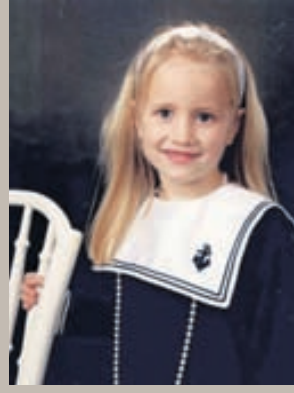
Þarna er ég kannski um sex ára gömul.