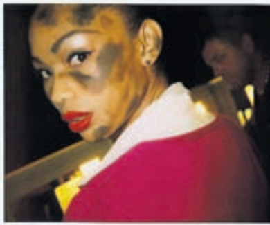
Á uppleið Iman baksviðs á tískuvíkunni í París árið 2007.

hennar raunverulega nafn. Iman hefur gengið tískupallana á sýningum allra helstu tískuhúsa heims auk þess sem hún hefur prýtt forsíður tímarita á borð við Vogue, Elle, i-D og Vanity Fair.