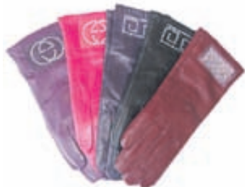
Leðurhanskar með skrautsteinum 50% afsl. verð áður 4.990 kr. Verð. 2.495 kr.