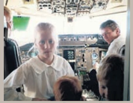
Þarna eru ég og bræður mínir (það rétt sést í kollana á þeim). Þetta var í fyrsta sinn sem ég fór inn í flugstjórnarklefa og þarna ákvað ég að verða flugmaður.