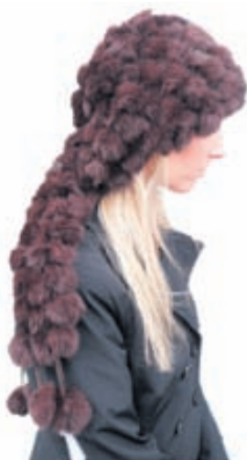
Kanínu hettutrefill 50% afsl. verð áður 6.970 kr. verð nú 3.485 kr.