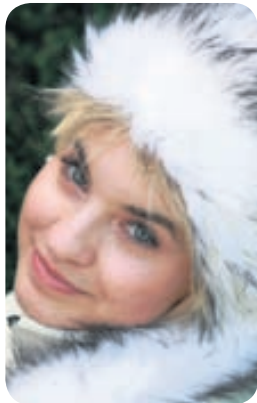
Allar húfur úr gervifeld frá HAUER með 20% afsl.