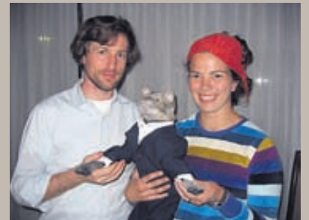
Parna er ég ásamt Spike Jonze við tókur á tónlistarmyndbandi fyrir Björk. Ég fékk það hlutverk að farðan þennan gervikött sem var upphaflega svartur. Eitt furðulegasta og vonlausasta verkefni sem ég hef tekið að mér.