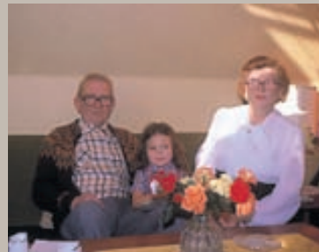
Parna er ég ásamt ömmu minni og afa frá Færeyjum.