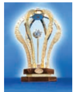
Alþjóðleg viðurkenning fyrir framúrskarandi árangur í framleiðslu á rúmum og springdýnum