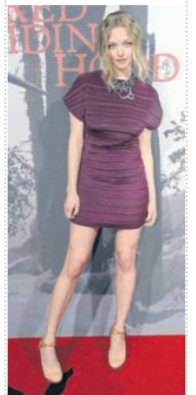
FRÍSKLEG Leikkonan Amanda Seyfried mætti í þessum fjólubláa kjól á frumsýningu kvikmyndarinnar Red Riding Hood.