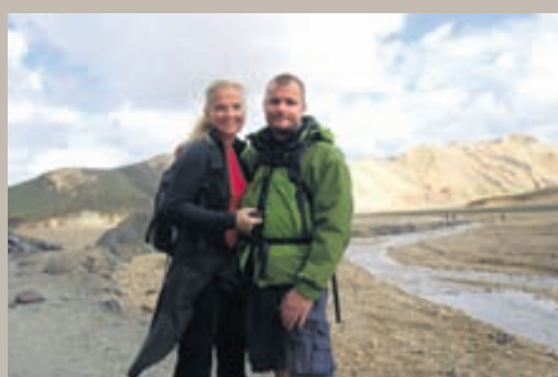
Þarna erum við eiginmaðurinn í Landmannalaugum.