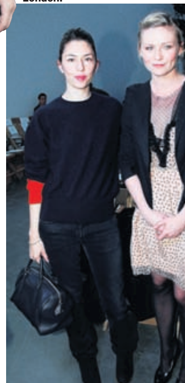
Kirsten Dunst og Sofia Coppola á sýningu Rodarte í New York.