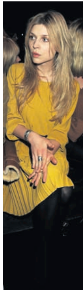
Leikkonan Clémence Poésy á Mulberry Salon-sýningunni í London.