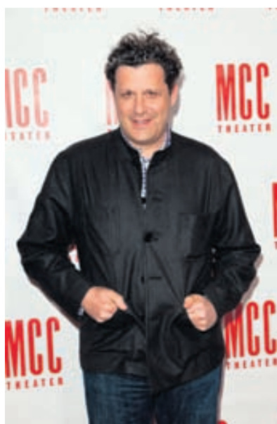
Ekki hrifinn Isaac Mizrahi vonar að Galliano muni aldrei aftur starfa innan bransans.

„Ég var aldrei sérstaklega hrifinn af því sem Galliano gerði. Ég var hrifnari af því sem McQueen og Vivienne Westwood gerðu. Og nú kemst ég að því að hann hatar gyðinga og ég hugsaði með mér: „Bæ, bæ Galliano“. Ég held að hann muni aldrei starfa innan bransans aftur. Ég vona það alltént í það minnsta,“ sagði Mizrahi í viðtali við The Cut.