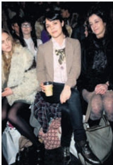
Söngkonan Bat for Lashes á sýningu Belle Sauvage í London.