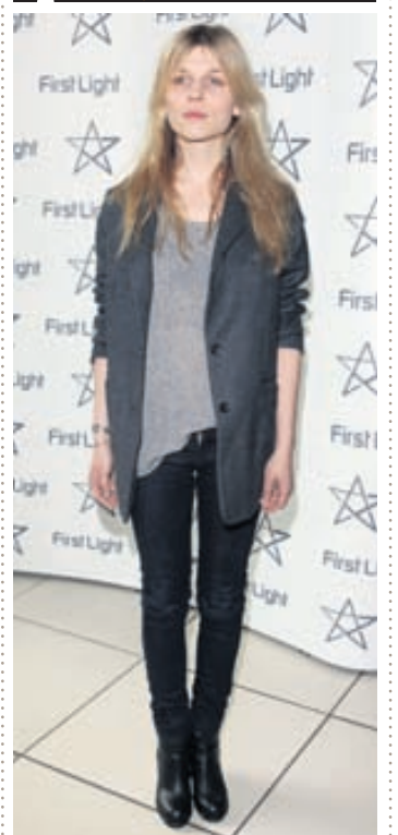
LEIKKONAN CLEMENCE POESY mætti afslöppuð og sæt á verðlaunahátíð í London um helgina.