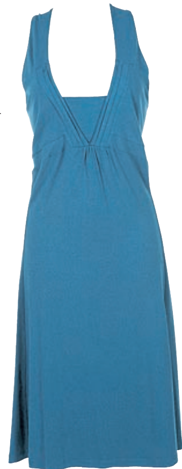
Blágrænn kjóll Verð: 15.860 Stærðir: 44 - 56 Litir: Svartur og turkis