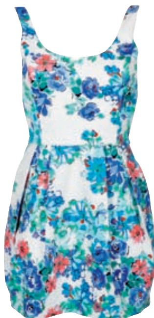
Mynstraður kjóll Verð: 8.995 Stærðir: XS - XL Litir: Mynstur og svartur.