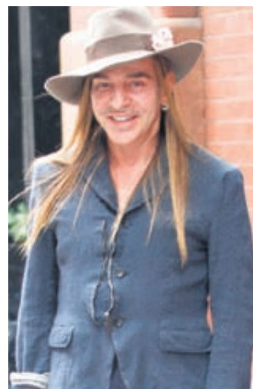
Í vanda John Galliano er atvinnulaus og stendur í miðjum málaferlum.