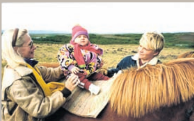
Stolt á hestbaki í Mývatnssveit eins árs gömul með mömmu og Gumma bróður.