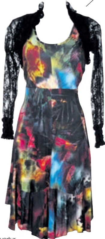
Mynstraður kjóll Verð: 16.980 Stærðir: 42 - 54 Litir: Mynstur og svartur.