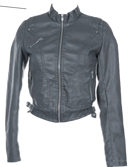
Jakki: Verð: 11.995 Stærðir: XS - XL Litir: Svartur og brúnn