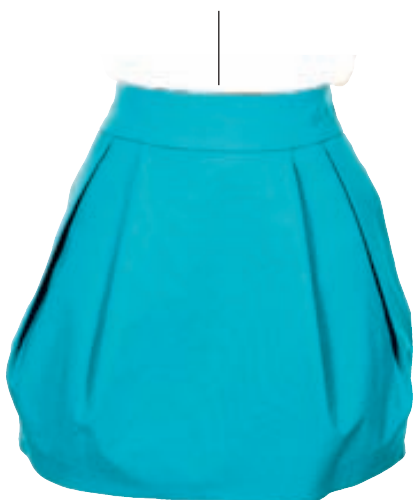
Pils; Verð: 6.995 Stærðir: 34 - 42 Litir: margir litir