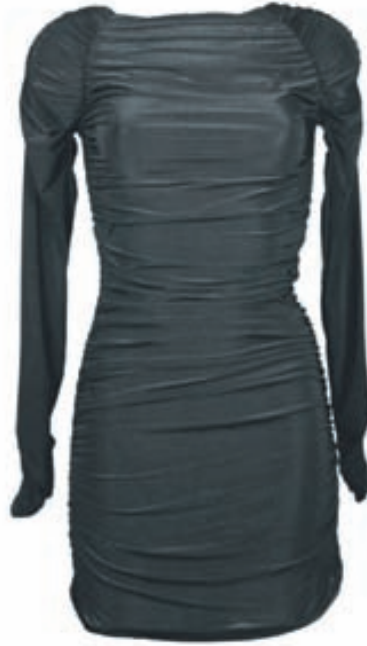
Svartur kjóll Verð: 7.990 Stærðir: SM - ML Litir: Svartur og metal.