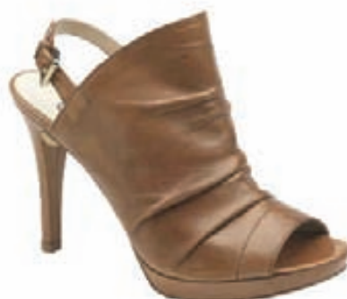
Tveir litir: Kamelbrúnt og svart. Verð 19.690 kr.-