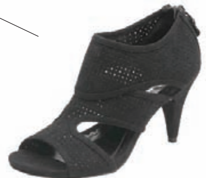
Þrjú litir: Svartur, ljós og blár. Verð 9.890.kr-