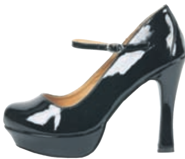
1 litur, stærðir 36-41. Verð 14.900 kr.

Fátt er skemmtilegra en að mæta í nýrri flík eða nýjum skóm á árshátíð