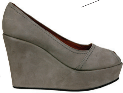
SHOE BIZ Leður innan og utan Litir: Svart og beige Verð: 21.990,-

Fást í GS skóm Kringlunni og Smáralind www.facebook.com . GS skór www.ntc.is