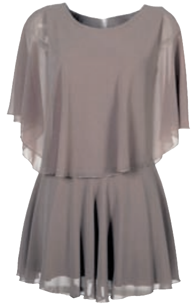
Kjóll Verð: 9.990 Stærðir: 1 og 2 Litir: Fjólublár, hvítur, beige og rústbrúnt.