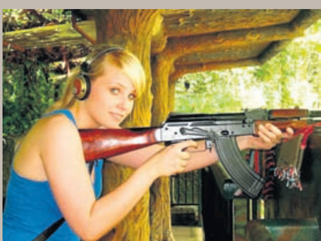
Parna er ég að prófa Kalashnikov AK-47 hriðskotabyssu í Víetnam.