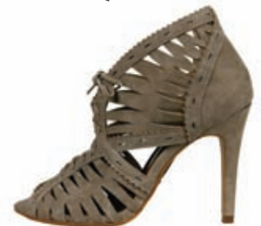
2 litir, svart og ljóst. Stærðir 36-41. Verð 15.900 kr.

Bianco Kringlunni. S: 5332130. www.facebook.com/biancoiceland