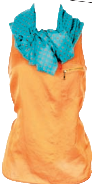
Toppur: Verð: 4.995 Litir: Margir litir Klútur: 3.995 Einnig til bleik/fjólublár.