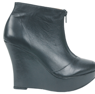
Einn litur. Stærðir 36-41. Verð 17.995 kr.