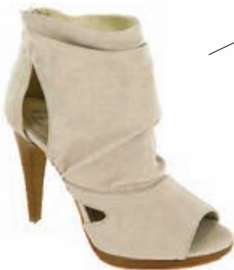
Tveir litir: ljós og svartur. Verð kr 12.490.-

Bata skóverslun Smáralind www.facebook.com/Bata Smáralind Island