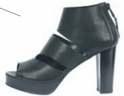
Billi Bi Leður innan og utan Litur: svart Verð: 31.990,-