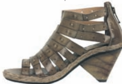
BDA Leður innan og utan Til í svörtu og ljósbrúnu Verð: 17.990,-