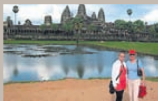
Ég og mamma fyrir framan Angkor Wat hindúahofið í Kambódíu.