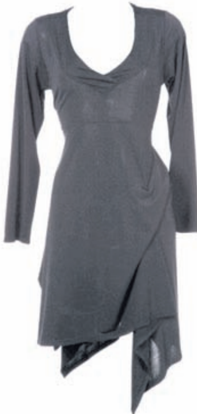
Svartur kjóll Verð: 15.980 Stærðir: 42 - 52