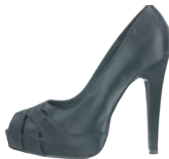
2 litir, svart og ljóst. Stærðir 36-41. Verð 14.900 kr.

Bianco Kringlunni. S: 5332130. www.facebook.com/biancoiceland