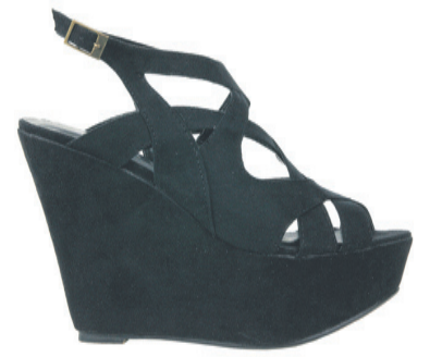
Einn litur. Stærðir 36-41. Verð 8.995 kr.

Fæst í Kaupfélaginu Kringlunni og Smáralind www.facebook.com . Kaupfélagið Kringlunni/Smáralind