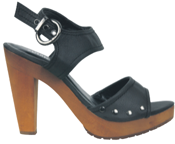
Einn litur. Stærðir 36-41. Verð 8.995 kr.