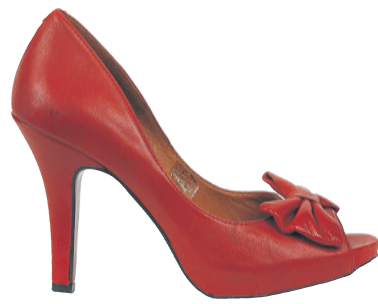
2 litir, svart og rautt. Stærðir 36-41. Verð 17.995 kr.