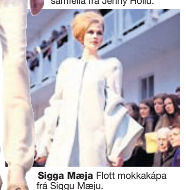
Sigga Mæja Flott mökkakápa frá Siggju Mæju.