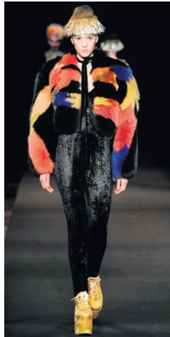
Litagleði Svartar leggins og litríkur mittisjakkvi við. Skórnir voru skreyttir af liðsmönnum Moon Spoon Saloon fyrir sýninguna.

Litaglööð og ærslafull hönnun Moon Spoon Saloon: