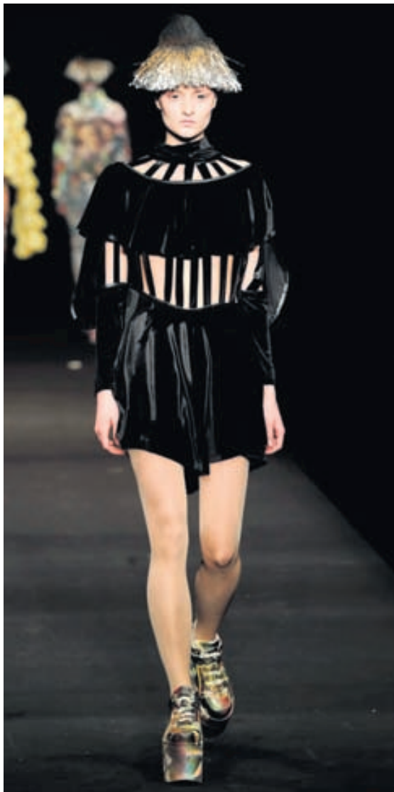
Sundurskorið Svartur kjóll með skemmtilegum smáatriðum frá Moon Spoon Saloon.

Mörkinni 6 | Sími: 568 2533 | Fax: 568 2535 | Netfang: fi@fi.is