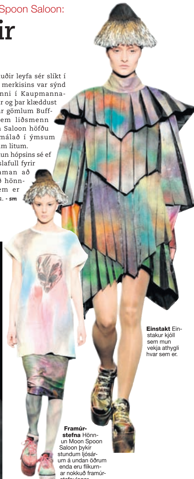
Einstakt Einstaktur kjóll sem mun vekja athygli hvar sem er.