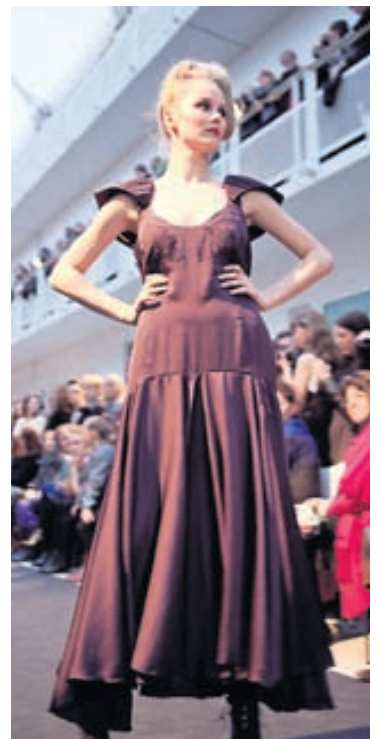
Gígja Ísis Fallegur síðkjóll frá Gígju Ísisi.