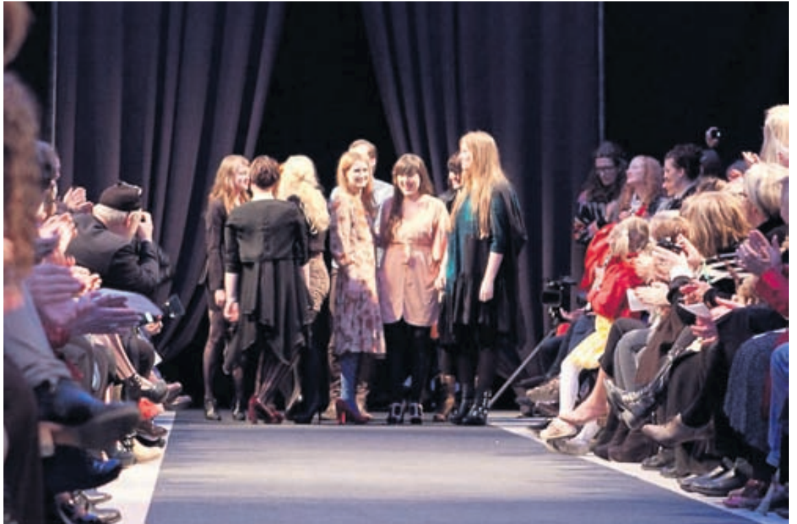
Ánægðir nemendur Útskriftarnemendur pakka fyrir sig.