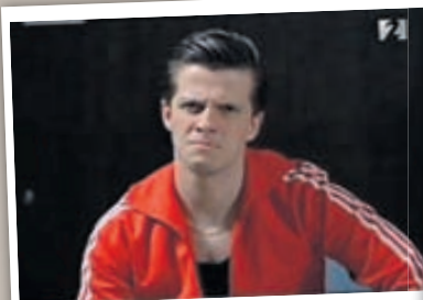
Ingvi úr Fangavaktinni alltaf jafn hress.