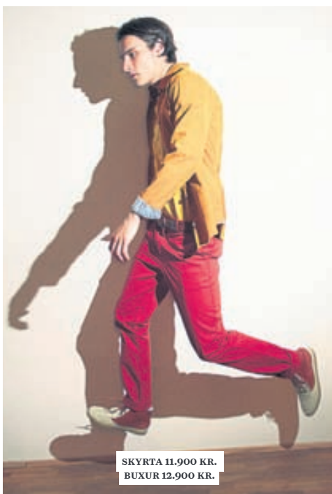
SKYRTA 11.900 KR. BUXUR 12.900 KR.