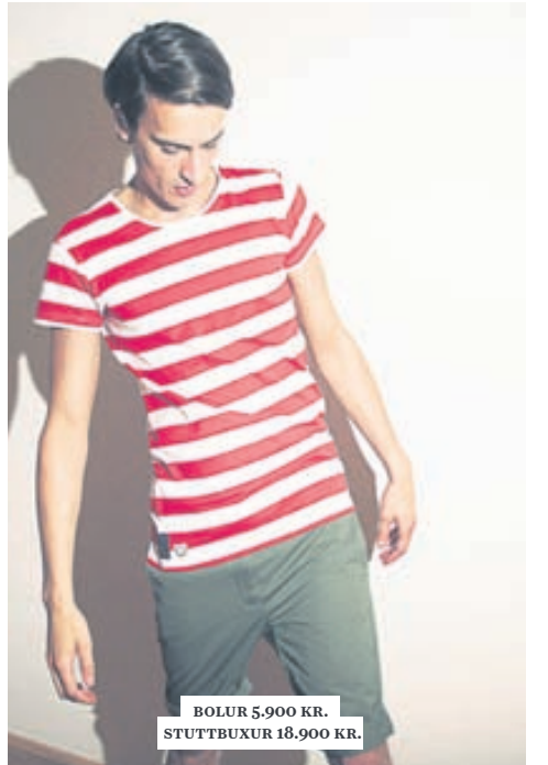
BOLUR 5.900 KR. STUTTBUXUR 18.900 KR.