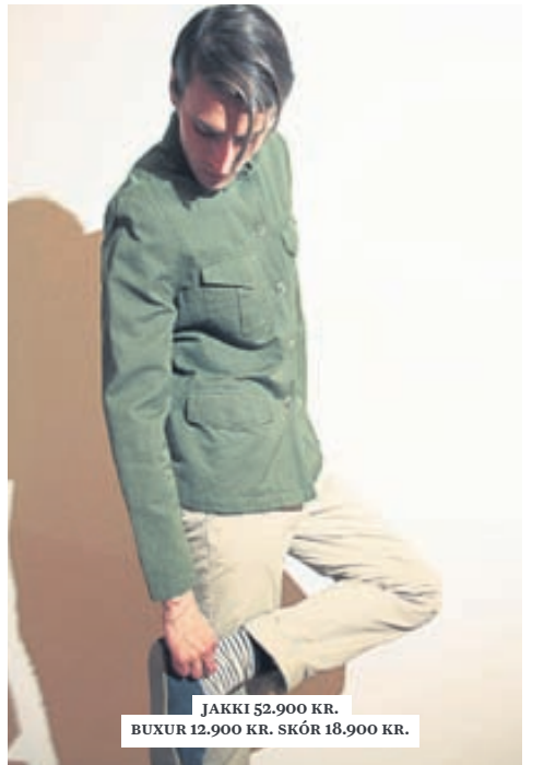
JAKKI 52.900 KR. BUXUR 12.900 KR. SKÓR 18.900 KR.