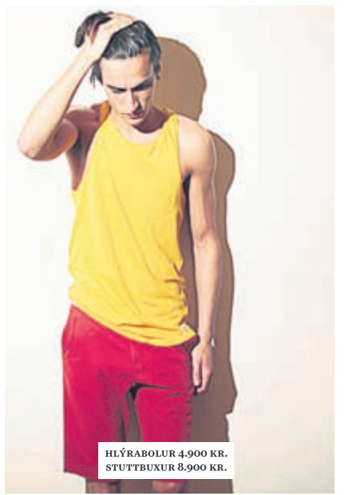
HLÝRABOLUR 4.900 KR. STUTTBUXUR 8.900 KR.