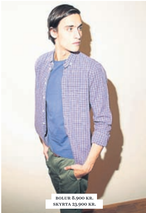
BOLUR 8.900 KR. SKYRTA 23.900 KR.