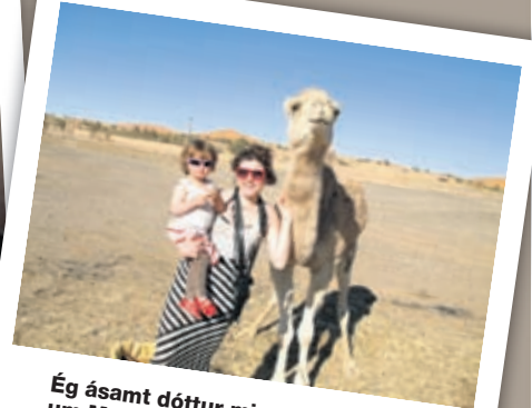
Ég ásamt dóttur minni á ferðalagi um Marokkó í vetur.