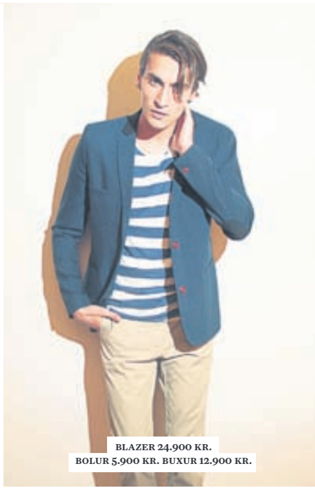
BLAZER 24.900 KR. BOLUR 5.900 KR. BUXUR 12.900 KR.