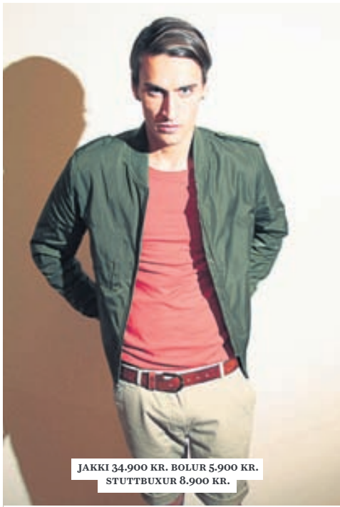
JAKKI 34.900 KR. BOLUR 5.900 KR. STUTTBUXUR 8.900 KR.