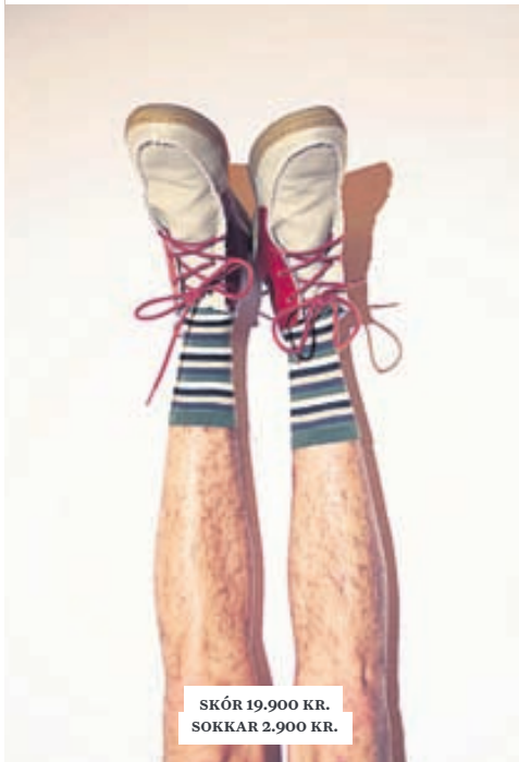
SKÓR 19.900 KR. SOKKAR 2.900 KR.