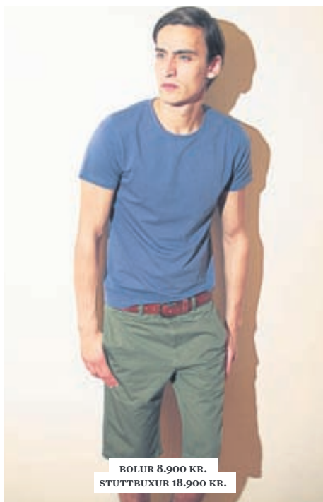
BOLUR 8.900 KR. STUTTBUXUR 18.900 KR.