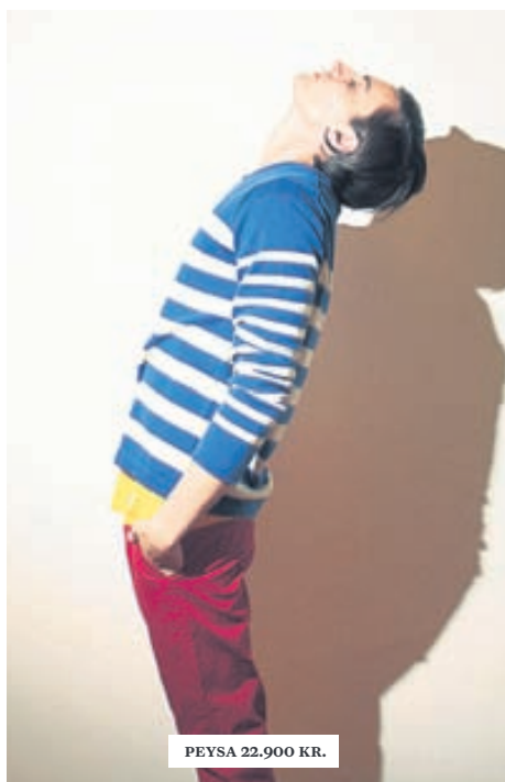
PEYSA 22.900 KR.