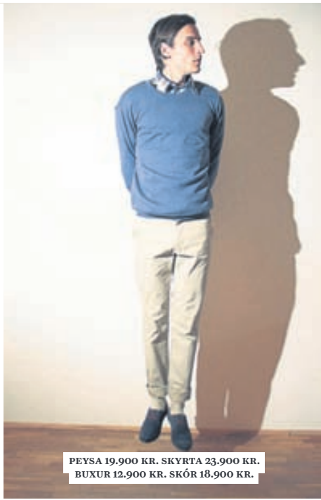
PEYSA 19.900 KR. SKYRTA 23.900 KR. BUXUR 12.900 KR. SKÓR 18.900 KR.