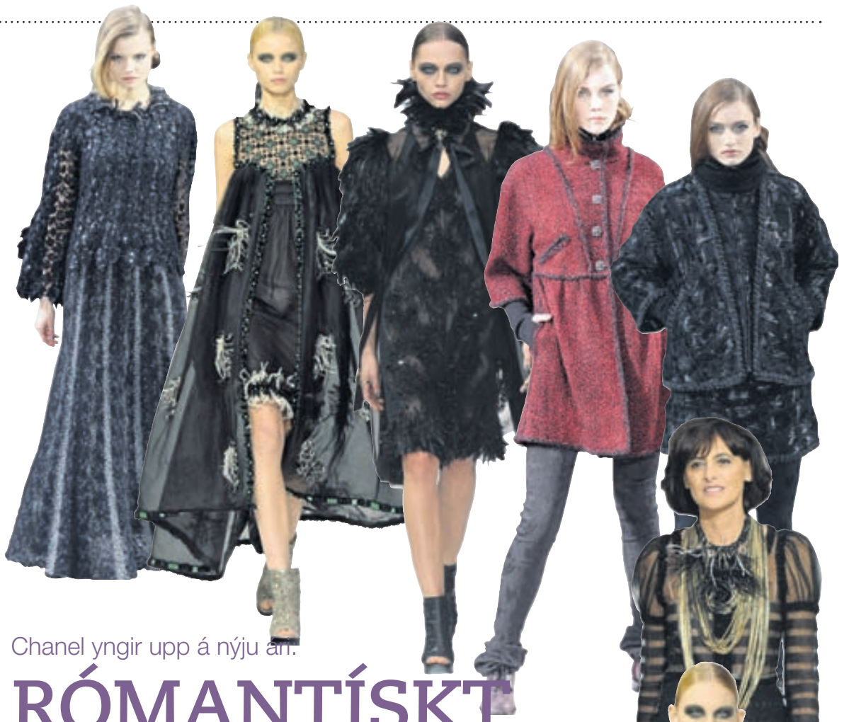
Chanel yngir upp á nýju ári.