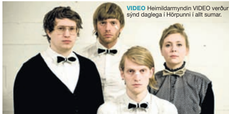
VIDEO Heimildarmyndin VIDEO verður sýnd daglega í Hörpunni í allt sumar.

BLEIKAR VARIR Í sumar verður útlitið bleikt og verður allt vaðandi út í fallegum bleikum tönnum, bæði í fatnaði og snyrtivörum. Þessi fallegi bleiki varalitur frá Estée Lauder mun sóma sér vel í snyrtibuddum allra kvenna í sumar.