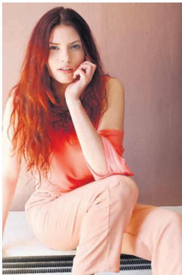
Sumarleg Bleiki liturinn verður vinsæll í sumar, bæði í fatnaði og snyrtivörum.