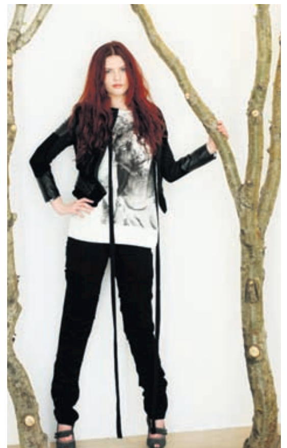
Svart á hvítu Flíkurnar í Kiosk eru fjölbreyttar og fallegar.