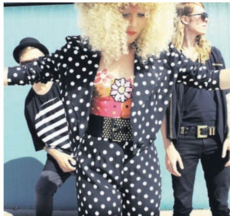
Steed Lord Danssveitin Steed Lord er búsett í Los Angeles. Hljómsveitar meðlimir léku og leikstýrðu nýrri auglýsingu fyrir tískumerkið WeSC.

Annars er það að fréttu af sveitinni að hún lauk nýverið tókum