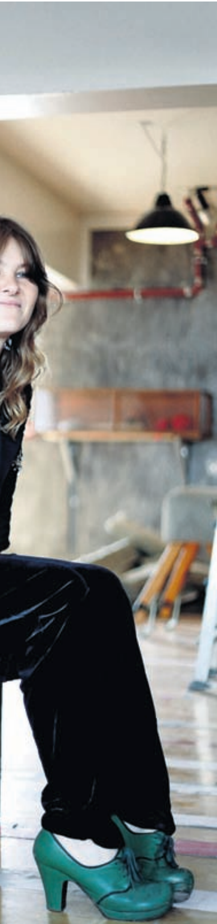
Undir. Hún hefur sungið með danssveitinni

lega með nafnið með sér og stendur fyllilega undir því.“