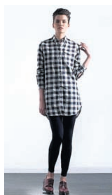
Þessi köflötti skyrtukjöll úr smíðu Dr. Martens minnr óneitanlega á bresk vinnuföt.

Áhugasamir Íslendingar geta keypt vörurnar á vefsíðunni www.drmartens.com eða í verslunum Dr. Martens í Englandi, Bandaríkjunum og Asíu. - hþt