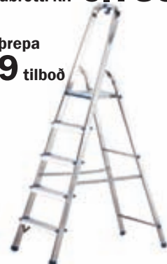
Tröppur 5 þrepa kr. 5.999 tilboð