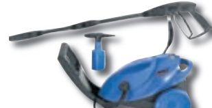
Háprýstipvottatæki frá kr. 9.995