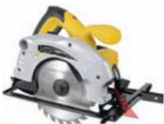
Hjólsög kr. 17.999