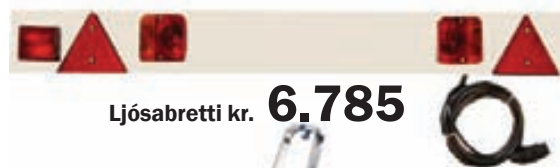
Ljósabretti kr. 6.785