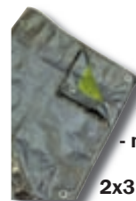
Yfirbreiðslur - margar stærðir 2x3M kr. 580