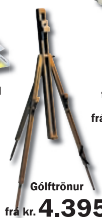
Gólftrönur frá kr. 4.395