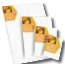
Strígar, ótal stærðir frá kr. 195