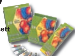
Olíu/Acrýl/Vatnslitasett 12/18/24x12 ml frá kr. 495