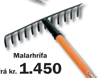
Malarhrifa frá kr. 1.450