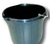
Fötur - margar gerðir frá kr. 495