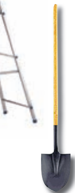
Malarskóflur frá kr. 1.195