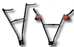
Reiðhjólafestingar á kúlu F/2-hjól kr. 4.785 F/3-hjól kr. 9.760