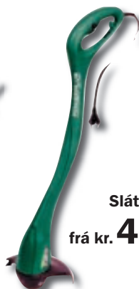
Sláttuorf frá kr. 4.245