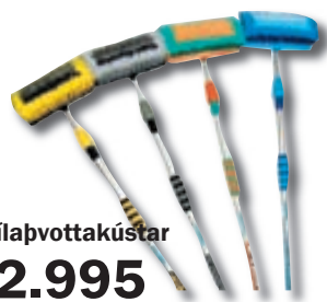
Bílaþvottakústar kr. 2.995