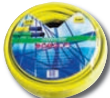
Garðslanga 15 mtr kr. 1.970