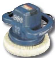
Bílabónvélur 3 gerðir frá kr. 4.995