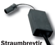
Straumbreytir 230V->12V kr. 3.985