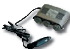
12V Fjöltengi kr. 1.995