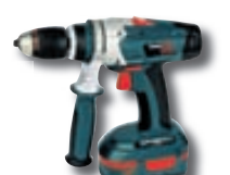
Hleðsluborvélur fjöl margar gerðir frá kr. 3.995