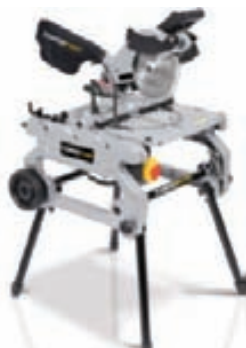
Veltisög kr. 49.995