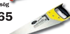
Trésög 650 mm kr. 695