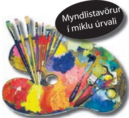
Myndlistavörur í miklu úrvali