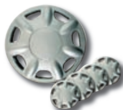
Hjólkoppar 12/13/14/15" frá kr. 795