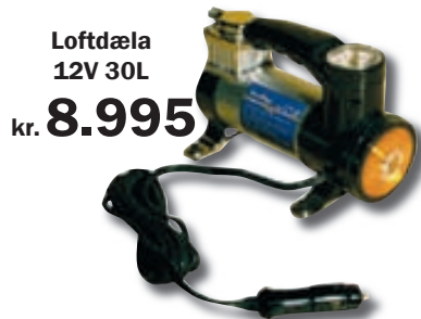
Loftdæla 12V 30L kr. 8.995