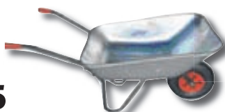
Hjólbörur 80L kr. 6.999