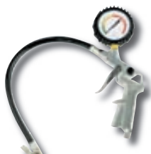
Loftmælir kr. 2.750