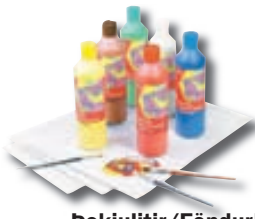
Þekjulitir/Föndurlitir frá kr. 480