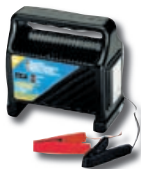
Hleðslutæki 12V 6A kr. 4.995