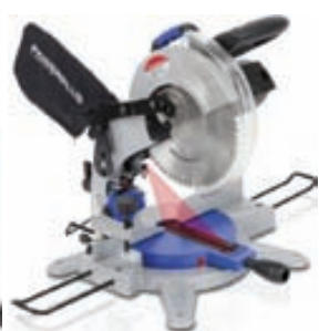
Bútsög kr. 19.995