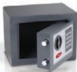
Öryggisskápur kr. 6.930