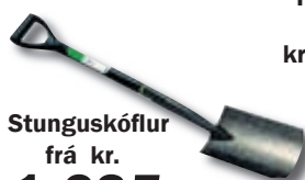
Stunguskóflur frá kr. 1.695