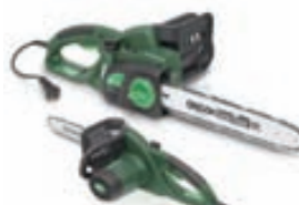
Keðjusög kr. 17.999