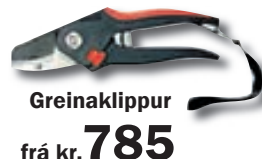
Greinaklippur frá kr. 785