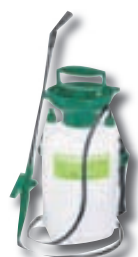
Úðabrúsi 5L kr. 2.695