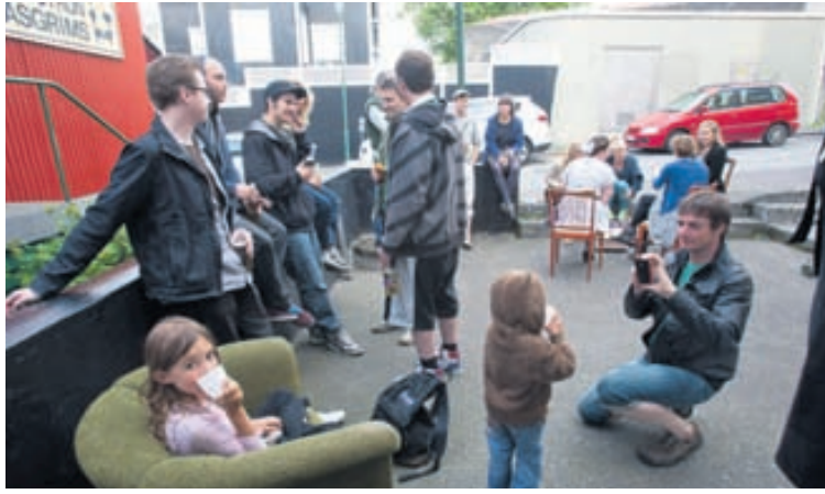
Fjölmennnt Líkt og sjá má ríkti góð stemning á opnun Work Shop.