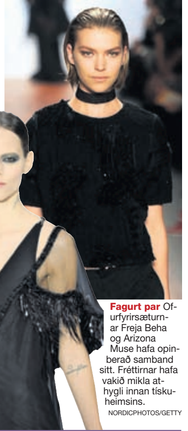
Fagurt par Ofurfyrirsæturnar Freja Beha og Arizona Muse hafa opinberað samband sitt. Fréttirnar hafa vakið mikla athygli innan tískuheimins.

Stúlkurnar eru um þessar mundir á meðal tíu vinsælustu fyrirsæta heims. Hin danska Freja Beha hefur verið í sýningum allra helstu hönnuða heims, prýtt forsíður i-D, W Magazine og fjölda Vogue-hefta auk þess sem bæði skór og töskur hafa verið nefndar eftir henni. Arizona Muse hefur einnig sýnt fyrir helstu hönnuði heims og prýtt ýmsar forsíður og tvisvar hefur hún deilt forsíðunni ásamt núverandi kærustu sinni, Freju.