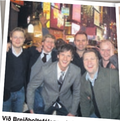
Við Breiðholtsfélagarnir í stórborgarferð.