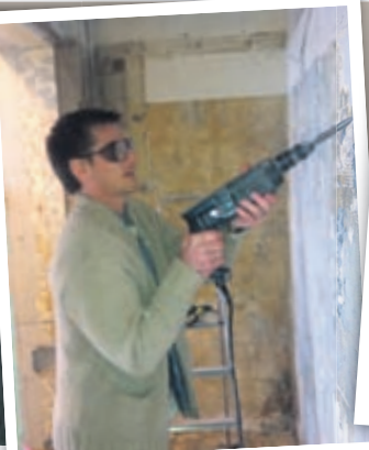
Ég í framkvæmdum á Kexinu.