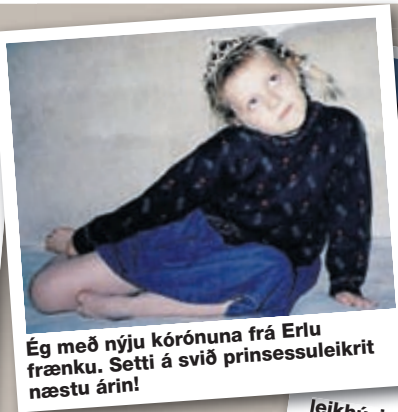
Ég með nýju kórónuna frá Erlu frænku. Setti á svið prinsessuleikrit næstu árin!