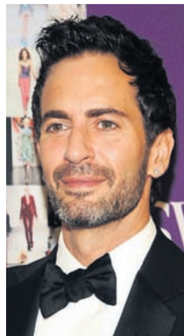
Til Dior? Marc Jacobs er orðaður við stöðu yfirhönnuðar hjá tískuhúsinu Dior.