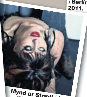
Mynd úr Stræti í leikstjórn Stefáns Baldurssonar í Nemendaleikhúsinu vorið 2010.