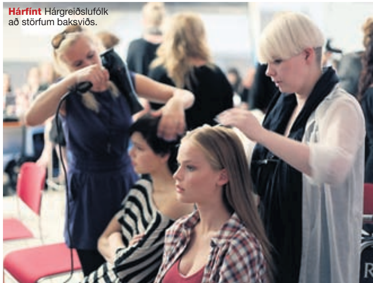
Hárfint Hárgreiðslufólk að störfum baksviðs.