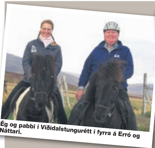
Ég og pabbi í Víðidalstungurétt í fyrra á Erró og Náttari.