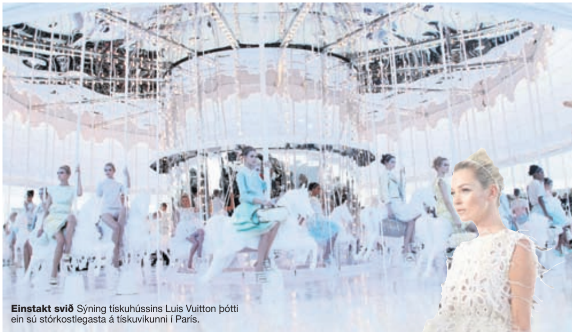
Einstakt svið Sýning tiskuhússins Luis Vuitton þótti ein sú stórkostlegasta á tiskuvíkunni í París.