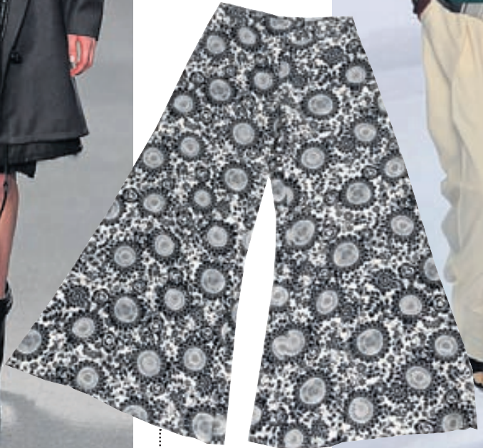
Buxur frá Topshop.