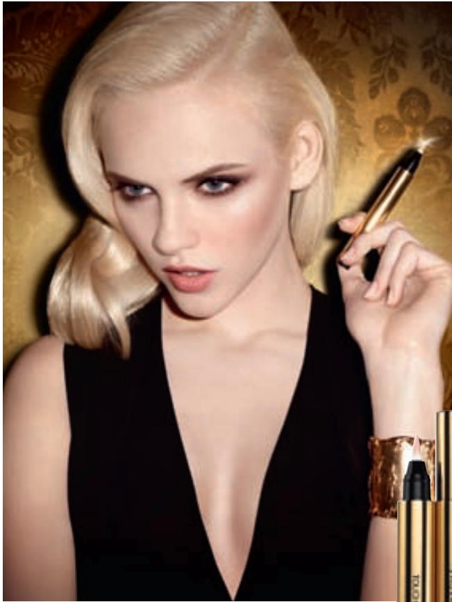
Make-up: Tere Radanov N8, Touche Éclat N2, Cèdre de Blush N3, Ombre Solo N2, Dessin de Regard N8, Mascara Volume Effet Flax Oils N1, Rouge Pur Couture N5