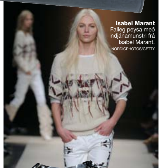
Isabel Marant Falleg peysa með indjámunstri frá Isabel Marant.