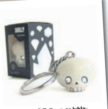
Nýjasta afurð Tulipop er lykla- kippan Skully.