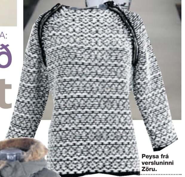
Peysa frá versluninni Zöru.