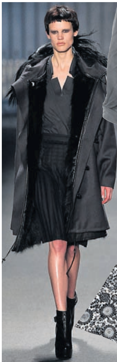
Úlpa frá Companys.

H austvörurnar flæða nú inn í tiskuverslanir um allt land. Á tiskupöllum síðasta vetur mátti sjá mikið af fallegum, þykkum peysum, stórum úlpum og settlegum handtöskum. Föstudagur fór á stúfana og fann nokkrar fallegar flíkur fyrir haustið.