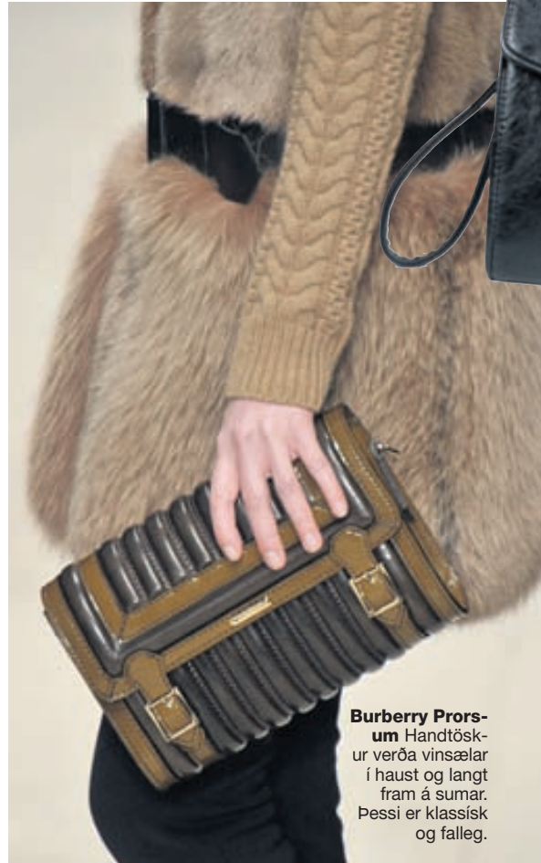
Burberry Prorsum Handtöskur verða vinsælar í haust og langt fram á sumar. Þessi er klassísk og falleg.