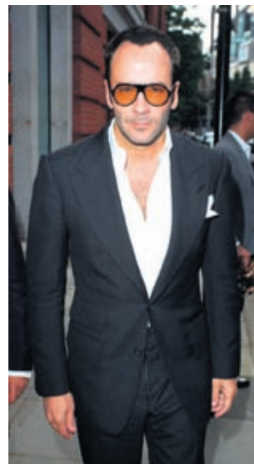
Snyrtivörur frá Ford Hönnuðurinn Tom Ford hefur sent frá sér nýja snyrtivörulínu.

Hönnuðurinn segist einnig hafa verið heillaður af snyrtivörum allt frá því að hann var barn. „Ég var duglegur að prófa hitt og þetta þegar kom að snyrtivörum og þegar ég var fjórtán ára þurfti ég að fara upp á slyastofu því agúrkurnar sem ég hafði lagt á augnlokin höfðu þveröfug áhrif og ég bólgnáði allur upp.“ - sm