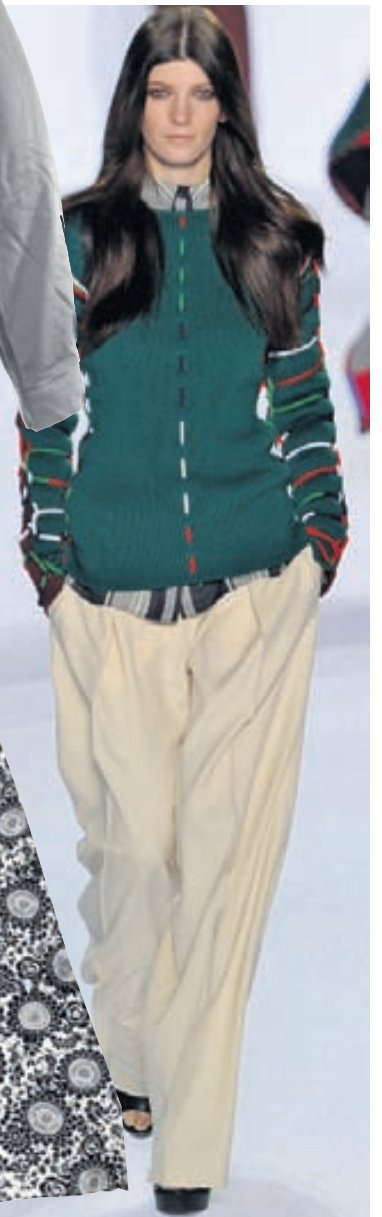
Chloé Víðar buxur sem þessar verða algengar í haust.