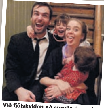
Við fjölskyldan að sprella á gaml- árskvöld 2010.