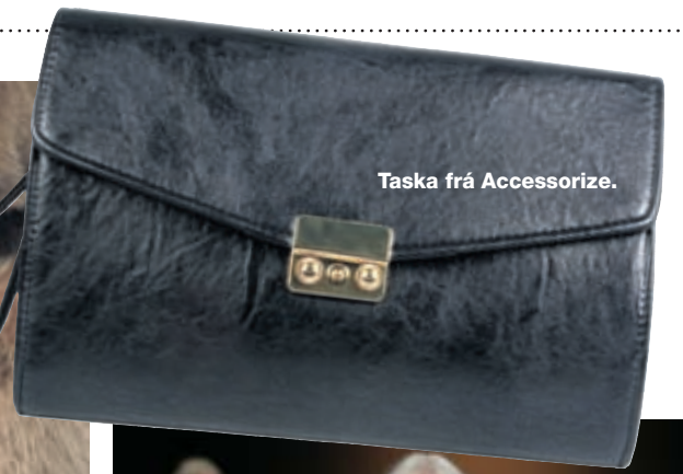
Taska frá Accessorize.