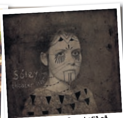
Stuttskífan sem varð upphafið að sólóferlinum.