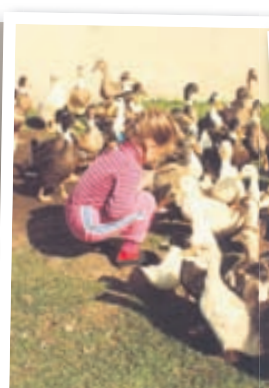
Gaman, gaman með dýrunum.