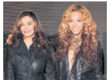
Á ný mið Beyoncé og móðir hennar, Tina Knowles, hanna nýja meðgöngulínu.

urnar vinna nú í sameiningu að hönnun nýrrar meðgöngulínu fyrir verðandi mæður. „Ég vil hanna fatnað fyrir óléttar konur sem fær þær til að finnast þær flottar og kynþokkafullar meðan á meðgöngunni stendur. Víð og flæðandi efni eru til dæmis mjög klæðileg á meðgöngunni, en ég vil líka geta gengið um í pinnahælunum mínum,“ sagði söngkonan í viðtali við Bazaar.