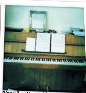
Píanóið mitt sem hljómar svo fallega. Ég sem alla tónlistina mína á þetta píanó og gæti ekki verið án þess.