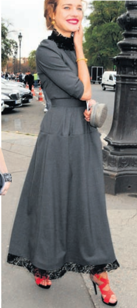
Fyrirsætan Natalia Vodianova er gjarnan mynduð í kringum tiskuvikurnar.