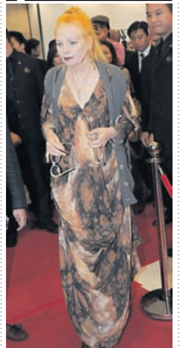
TÖFF Hönnuðurinn Vivienne Westwood var flott á opnun nýrrar verslunar sinnar í Shjanghai í Kína. Westwood hefur verið á meðal fremstu hönnuða heims allt frá upphafi áttunda áratugarins.