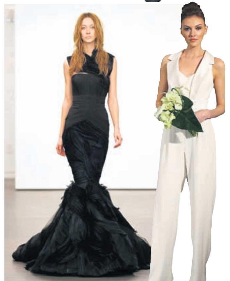
Svartur brúðarkjöll Hönnuðurinn Vera Wang sýndi nokkra svarta brúðarkjóra og aðra í gráum tónum.