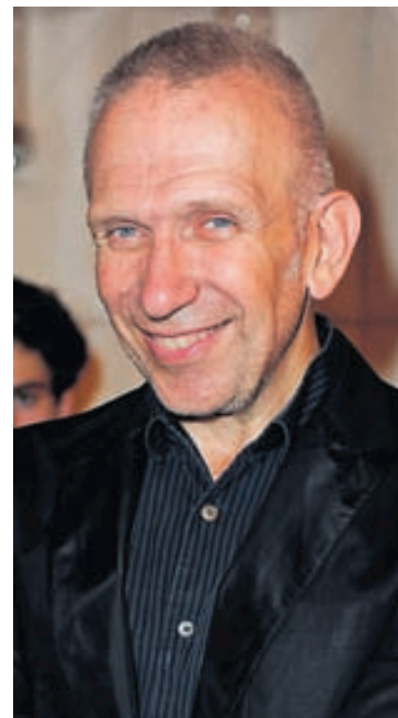
Öttast Wintour Jean Paul Gaultier er ekki aðdáandi Önnu Wintour, ritstjóra bandaríska Vogue.