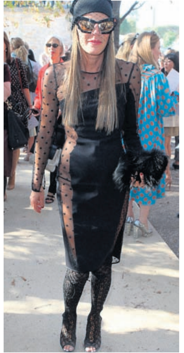
Nýjar fyrirmyndir Fólkið innan tiskuiðnaðarinnar leggur mikinn metnað í klæðnað sinn þegar það sækir sýningar á tiskuvikunum. Anna Dello Russo er meðal annars þekkt fyrir að klæða sig ólíkt öllum öðrum.