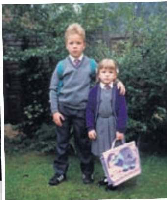
Ég og bróðir minn á fyrsta skóladeginum mínum úti í Bretlandi.