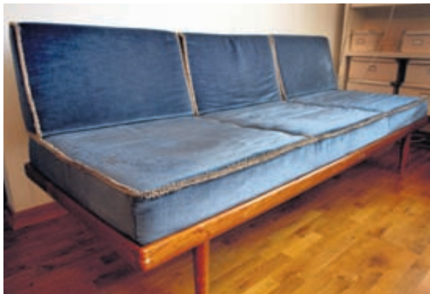
Uppáhaldshúsgagnið: Blái sófinn frá afa mínum. Hann var inni á skrifstofunni hans og hann var vanur að leggja sig á honum. Það sést enn á áklæðinu hvorum megin fæturnir voru.