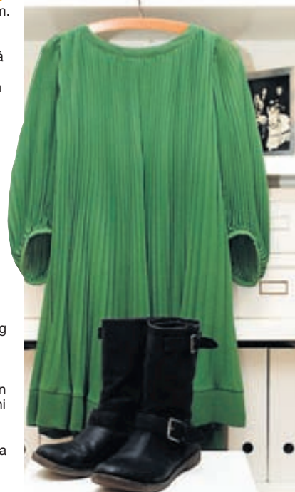
Uppáhaldsflíkin: Það eru annars vegar svört stígvél sem ég keypti í Sviss. Ég var alveg handviss um að ég myndi nota þau óspart og ég hef varla farið úr þeim síðustu vikurnar. Hins vegar er það grænn kjóll sem ég er með í láni frá systur minni og ég veit ekki hvort ég mun geta skilað honum. Þetta er ein klæðilegasta flík sem ég hef gengið í.