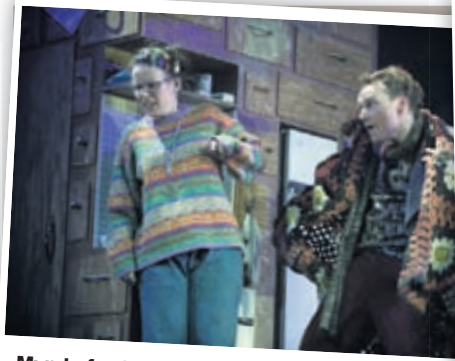
Mynd af mér í hlutverki Ástu í Gauragangi.