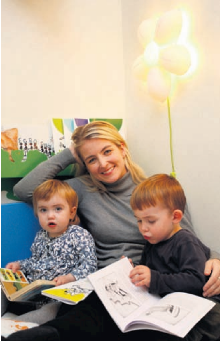
Uppáhaldsstaðurinn: Mér líður best uppi í rúmi hjá syni mínum, þar eyðum við löngum stundum við lestur.