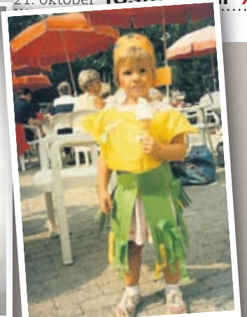
Þarna var ég nýbúin að stíga á stökk í sumarhúsabyggð í Hollandi, búningurinn er eigin hönnun.