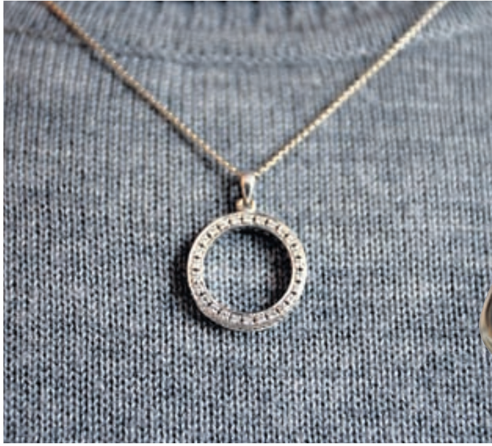
Uppáhaldsskartið: Þetta hálsmen fékk ég í morgungjöf frá eiginmanni mínum. Það er bæði fallett og táknað og svo kom það líka að góðum notum á meðgöngunni, þar sem það passaði vel upp á giftingarhringinn þegar bjúgurinn náði yfirhöndinni.