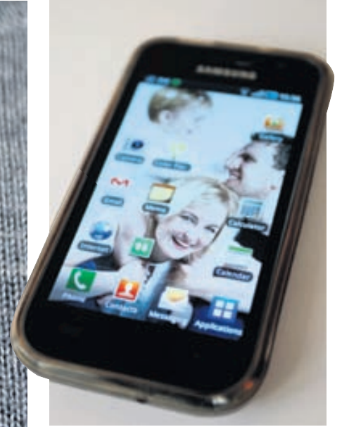
Uppáhaldshluturinn: Síminn minn. Ég grip í hann til að mynda gullkorn barnanna minna, hann geymir tölvupóstinn minn, spilar uppáhaldstónlistina mína, vekur mig á morgnana ef börnin eru ekki fyrir til og er bara alveg ótrúlega traustur félagi.