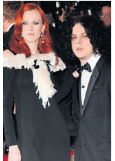
Fyrrverandi hjón Elson ásamt fyrrverandi eiginmanni sínum og barnsfóður, tónlistarmanninum Jack White, árið 2009.