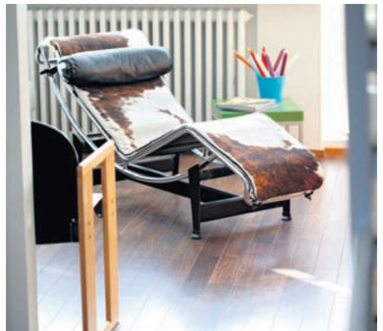
Corbusier-stóllinn sem var á æskuheimilinu er í miklu uppáhaldi. Ég notaði hann mikið sem rennbraut þegar ég var lítil, móður minni til mikillar mæðu. Finnst hann samt eiginlega bara flottari svona vel snjáður, sérstaklega af því að það er algjörlega mér að kenna.

www.valhusgogn.is Opið virka daga kl. 10-18 - Laugardaga kl. 11-16 Sími 581-2275 ■ 568-5375