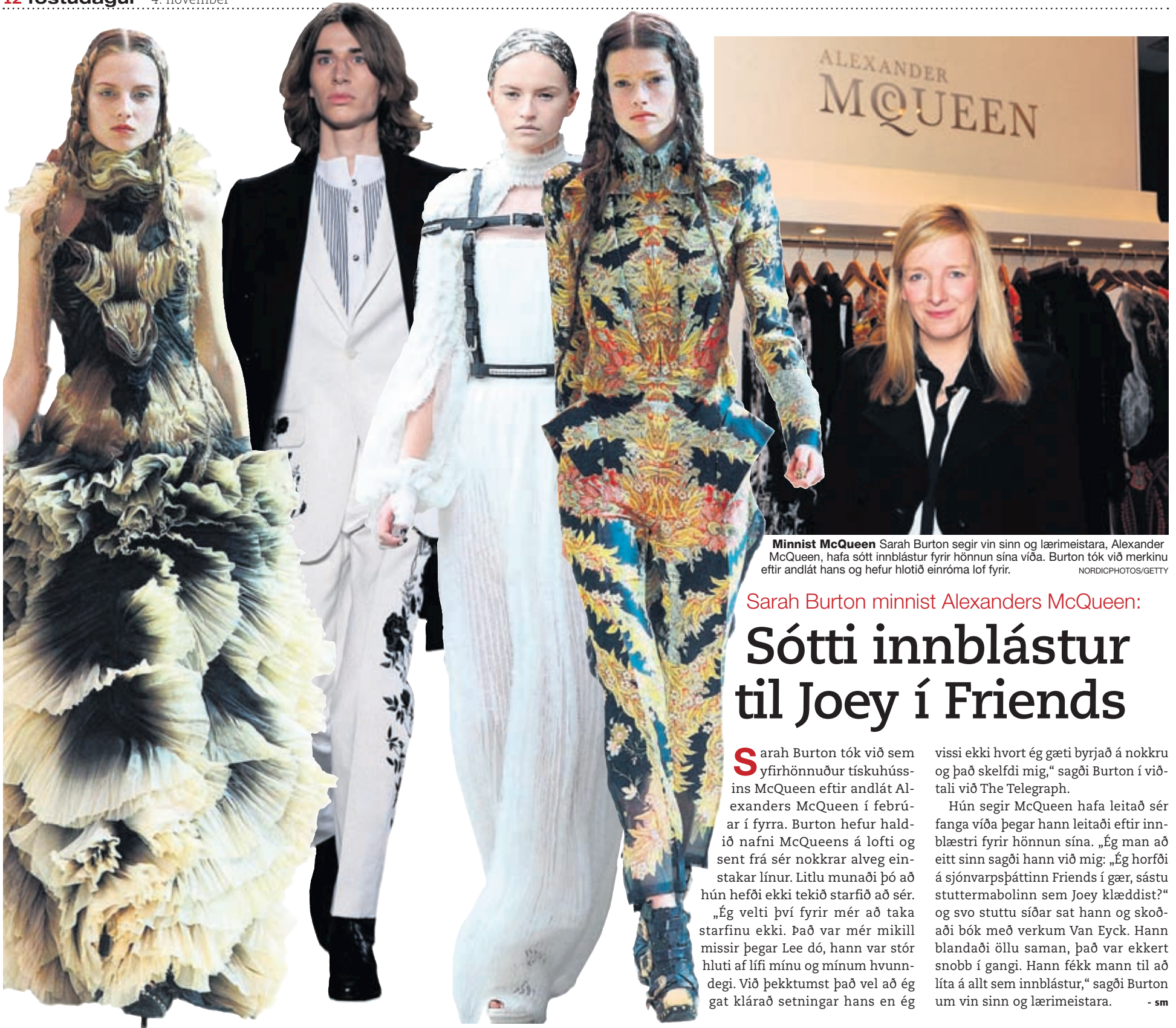
Minnist McQueen Sarah Burton segir vin sinn og lærimeistara, Alexander McQueen, hafa sótt innblástur fyrir hönnun sína víða. Burton tók við merkinu eftir andlát hans og hefur hlotið einróma lof fyrir.