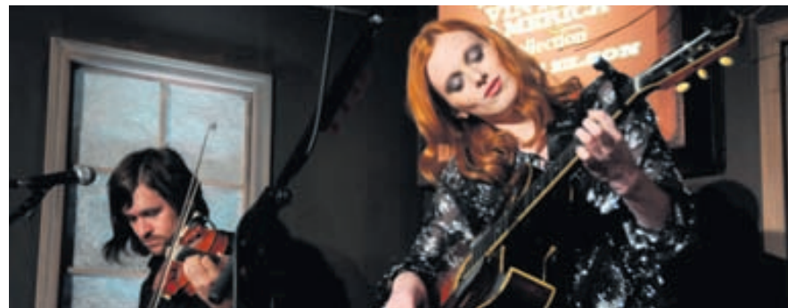
Á sviði Fyrirsætan er einnig þekkt söngkona og hér sést hún á sviði í New York í september síðastliðnum.