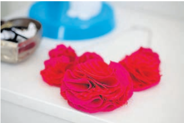
Hvað skart varðar eru Hálsakotin sem ég hanna sjálf í mestu uppáhaldi í augnablikinu, nota þau við flest tækifæri, flika upp á hvaða dress sem er.