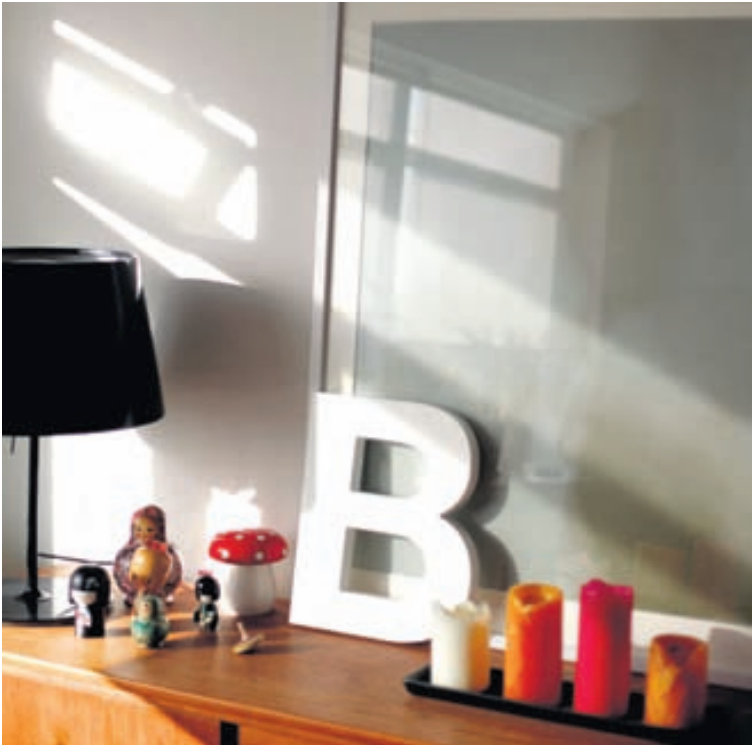
Uppáhaldshluturinn á heimilinu er handgerða B-ið sem kærasti minn gerði og gaf mér um síðustu jól. Svo mikil natni og hugsun sem fór í þessa gjöf og hitti alveg í mark.