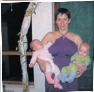
Mynd af mér með tvíburana fyrir skírn árið 2008.