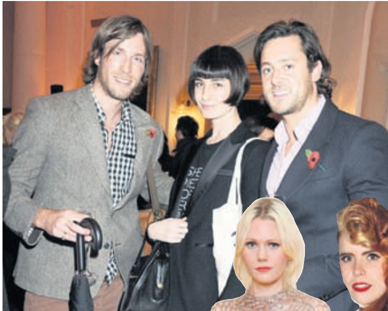
Góðar stundir Breska fyrirsætan Erin O'Connor ásamt góðvinum sínum.