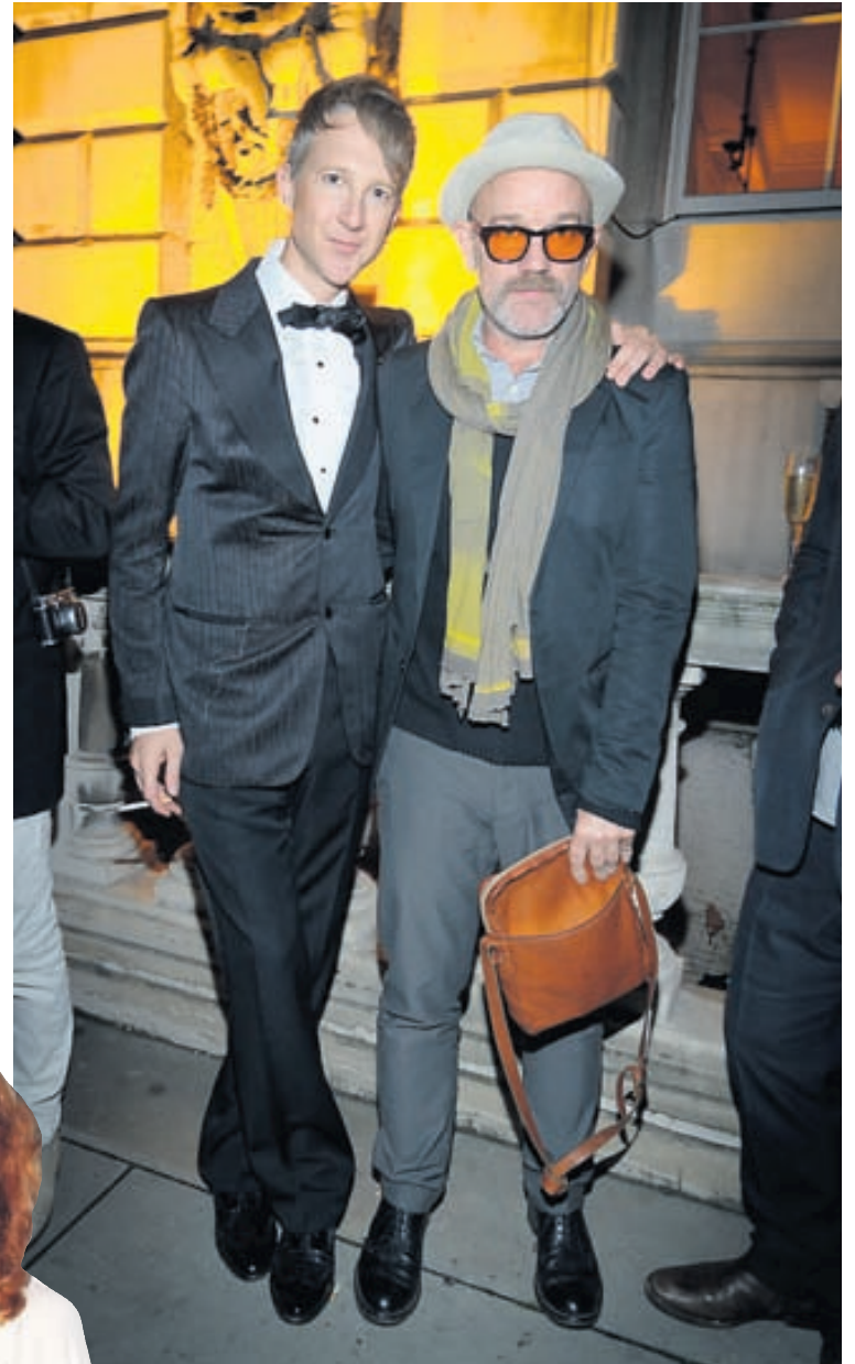
Ritstjórnirinn og tónlistarmaðurinn Jefferson Hack, ritstjóri og stofnandi blaðsins, var glaður að sjá er hann spjallaði við Michael Stipe, fyrrum söngvara REM.