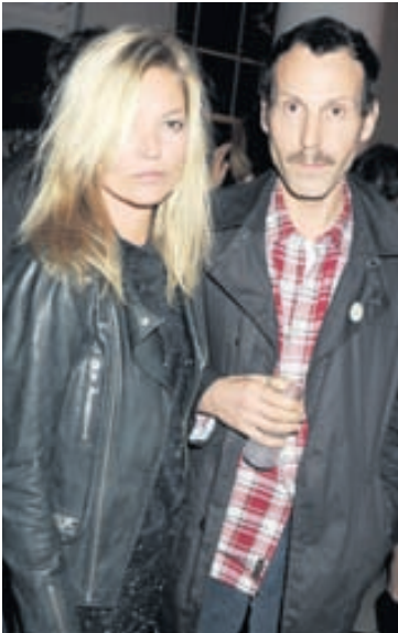
Góðir vinir Fyrirsætan Kate Moss, fyrrverandi forsíðustúlka Dazed & Confused og barnsmóðir Hack, ásamt Marlon Richards, syni rokkarans Keith Richards.

og list. Jefferson Hack, annar af tveimur stofnendum blaðsins, sagðist ánægður með árangurinn enda hefðu þeir félagar runnið blint í sjóinn þegar tímaritið var stofnað árið 1991. Á meðal gesta voru fyrrverandi forsíðustúlka blaðsins Kate Moss, hönnuðurinn Sarah Burton og tónlistarmaðurinn Michael Stipe. - sm