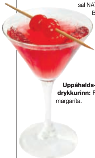
Uppáhaldsdrykkurinn: Frosin margaríta.

Einn hlutur sem þú vissir ekki um mig: Hef setið ráðstefnu í fundarsal NATO í Brussel.