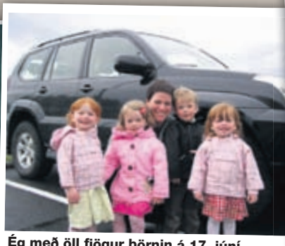
Ég með öll fjögur börnin á 17. júní.