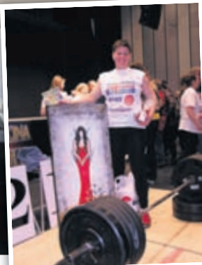
Mynd af mér eftir verðlaunaafhendingu um síðustu helgi.