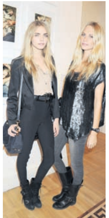
Fyrirmyndarsystur Systurnar og fyrirsæturnar Cara Delevingne og Poppy Delevingne voru ófeimnar fyrir framan myndavélina.