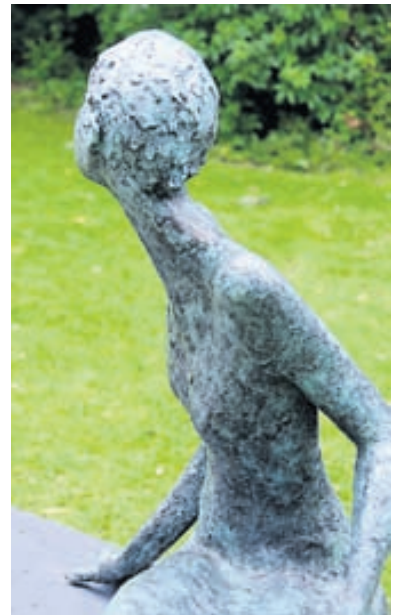
Leyndur garður Styttu í Iveagh-garðinum.