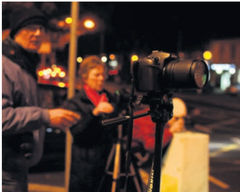
Kvöldkennsla Ljósmyndakennsla með bekknum mínum að kvöldi til.