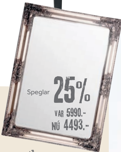
Speglar 25% VAR 5990.- NÚ 4493.-