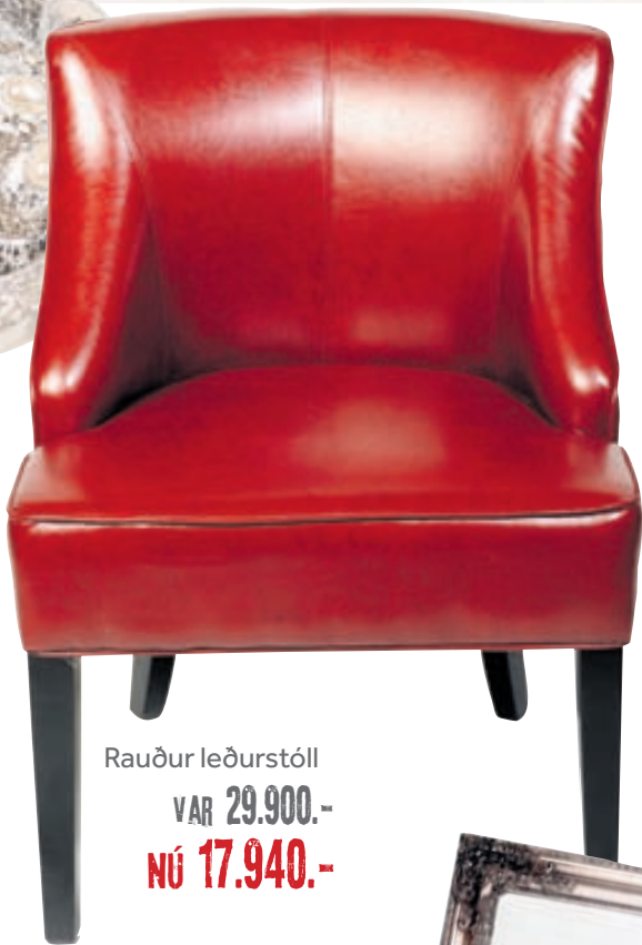
Rauður leðurstóll VAR 29.900.- NÚ 17.940.-