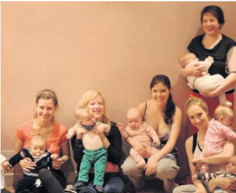
Ungbarnajóga Baby yoga í hádeginu með brjóstgjafahópnum mínum.