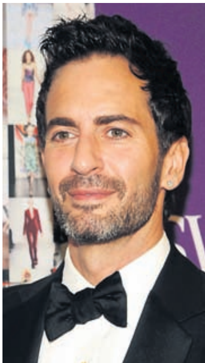
Ekki með Ólíklegt er að Marc Jacobs taki við sem yfirhönnuður Dior.

Ekki hefur tekist að fylla í skarð Johns Galliano hjá franska tiskuhúsinu Dior. Bandaríski hönnuðurinn Marc Jacobs þótti líklegur til starfsins en nú hefur það fengist staðfest að hann taki ekki við sem næsti yfirhönnuður Dior.