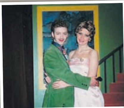
Úr fyrsta menntaskólaleikritinu mínu. Verkið hét Ég vil auðga mitt land og var sett upp hjá ML í leikstjórn Brynju Ben heitinnar.