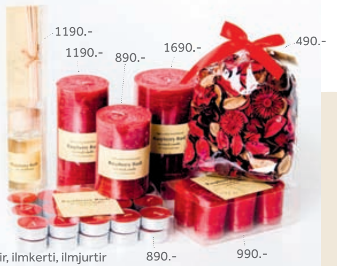
Ilmir, ilmkerti, ilmjurtir

Alþjóðatónlistin Putu Mayo er spiluð í verslunum og fæst í The Pier