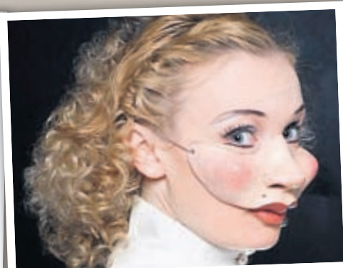
Ég sem Ólívía greifynja í Prettándakvöldi sem var lokasýning Nemendaleikhússins og unnin í samstarfi við Þjóðleikhúsið.