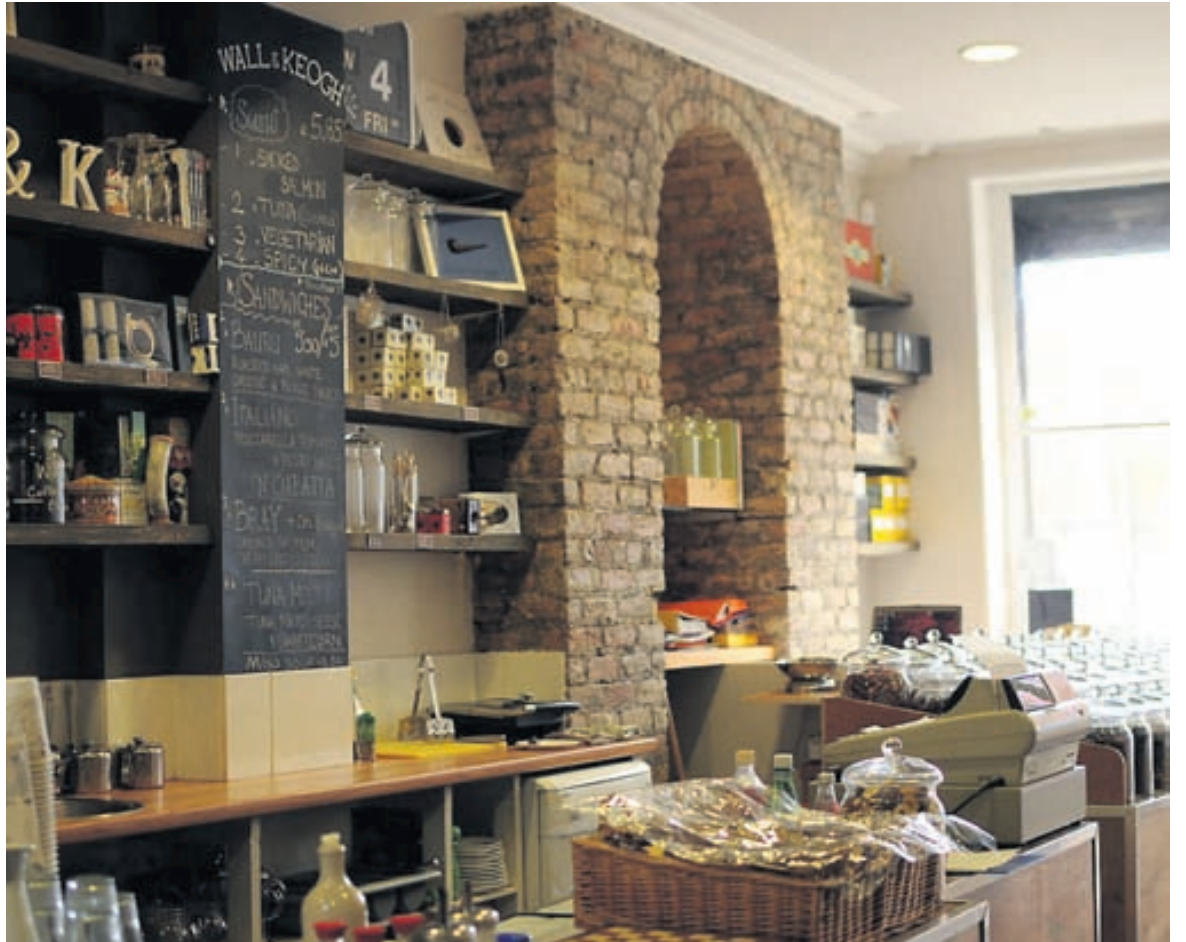
Teverslun Kaupi mér Maté-te í Wall & Keogh tehusi.