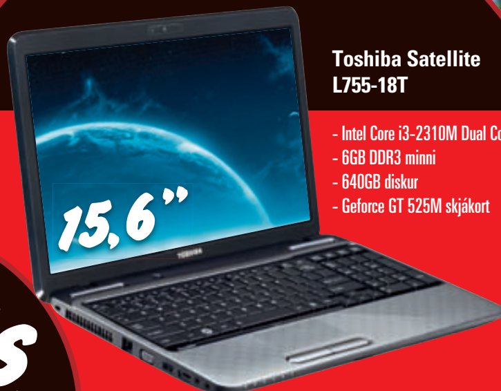
Toshiba Satellite L755-18T