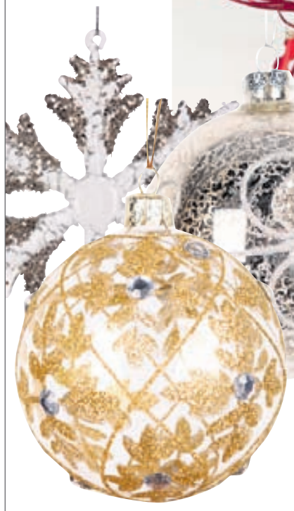
Jólaskraut á tré FRÁ 390.-