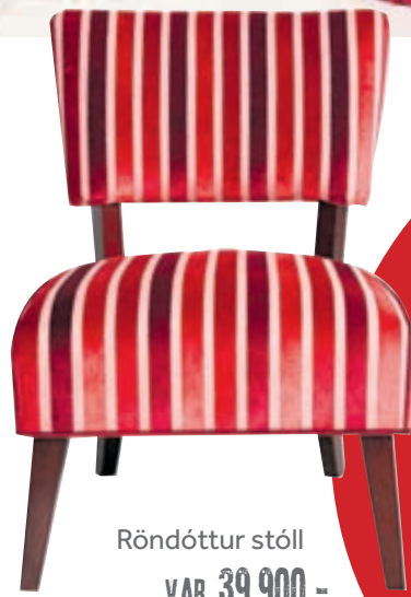
Röndóttur stóll VAR 39.900.- NÚ 24.900.-