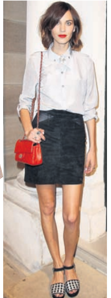
Skyrtu og pils Chung er hún sótti tískuviðburð í Sydney í Asíu nú í september.