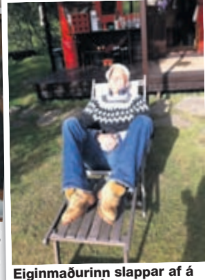
Eiginmaðurinn slappar af á besta stað á Íslandi, Birkilaut við Hekalurætur.