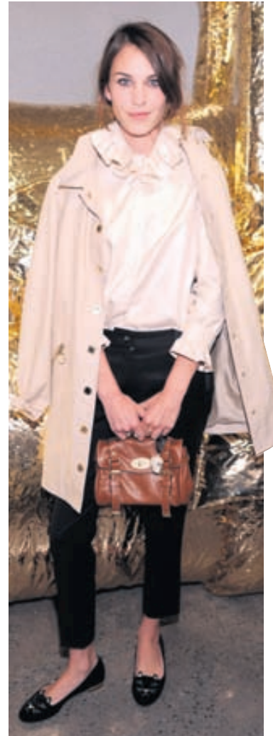
Klassísk Alexa Chung nú í september klædd í ballerínuskó og fallega skyrtu.