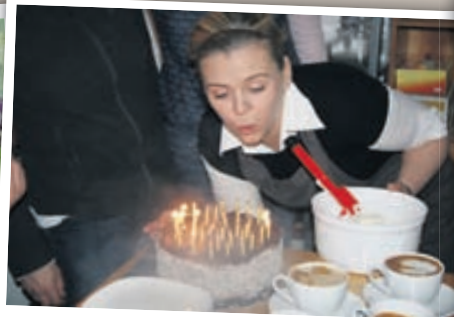
Nokkuð dæmigerð mynd fyrir síðustu fjögur ár. Ég átti afmæli þennan dag en gaf mér greinilega ekki tíma til að taka niður svuntuna þegar eiginmaðurinn birtist með afmælisköku. Hún var borðuð í hópi kærs samstarfsfólks.