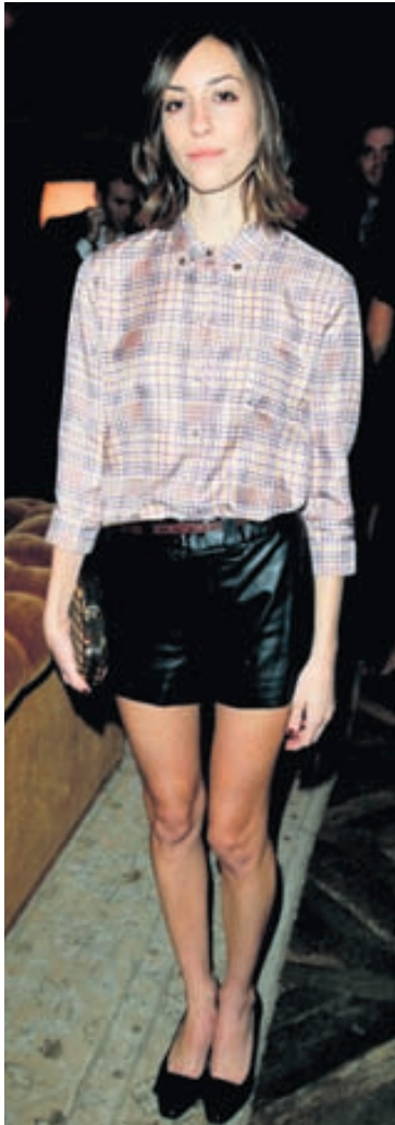
Stuttbuxur og skyrtu Coppola er alls ekki ólík Alexu Chung í útliti.