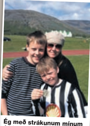
Ég með strákunum mínum á fótboltamóti á Laugarvatni.