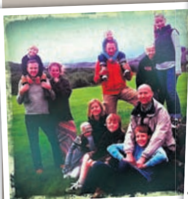
Öll fjölskyldan samankomin í Birkilaut.