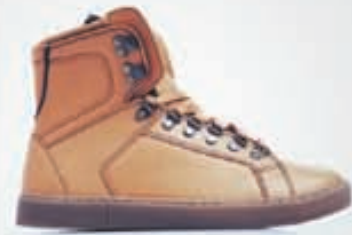
SHOE THE BEAR Skör 25.900kr.