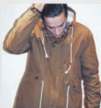
SUIT Jakki 39.900kr.