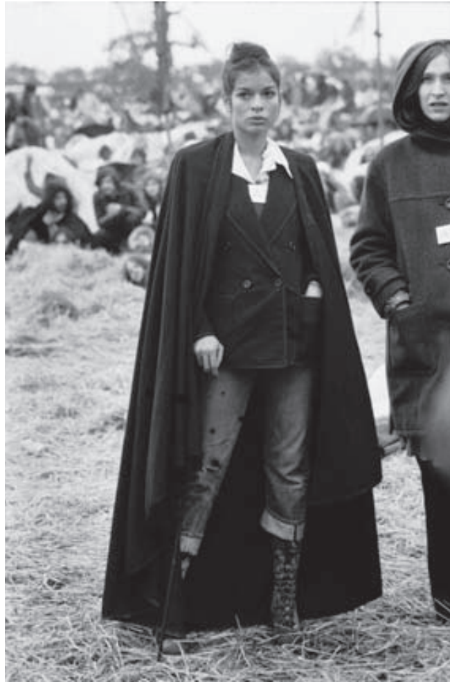
Fyrirmynd Bianca Jagger veitir fólki enn innblástur þegar kemur að tísku.

Dúkkuhúsið ★ Vatnsstígur 3 ★ 101 Reykjavík ★ Sími 5170044