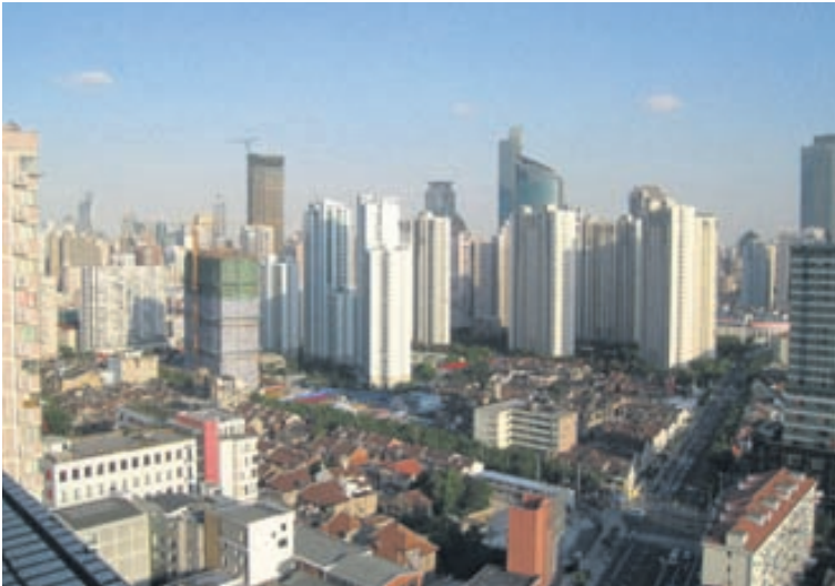
Horft yfir borgina Útsýnið af svölunum hjá okkur.