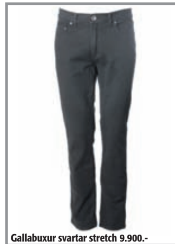
Gallabuxur svartar stretch 9.900.-