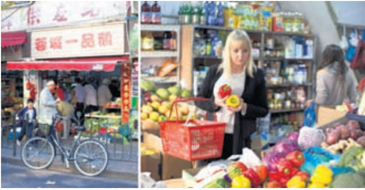
Innkaup Að versla hjá Avocado Lady. Kaupkonan á horninu.