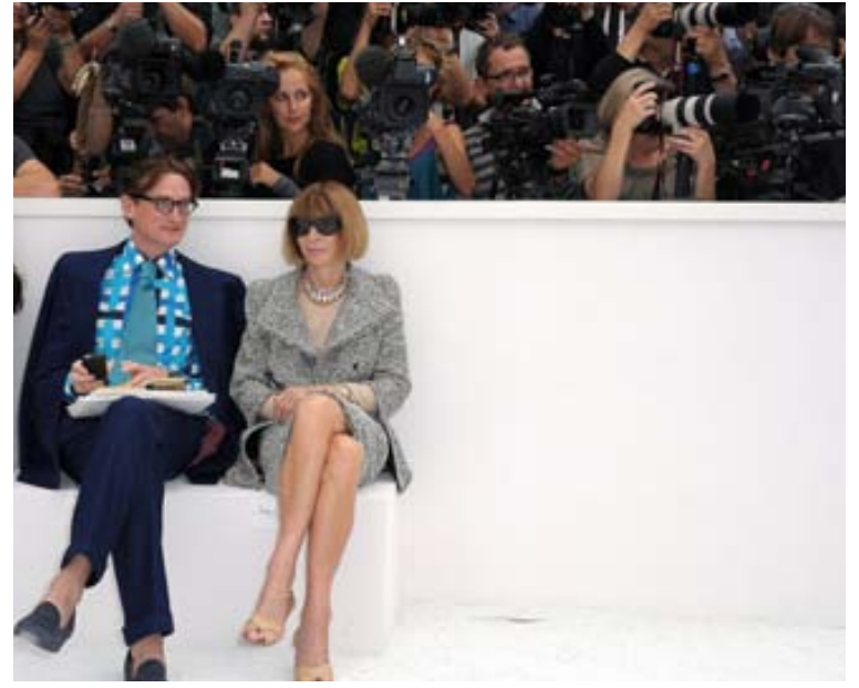
Anna Wintour Ritstjóri bandaríska Vogue er ein þeirra sem sækja allar helstu tiskusýningar á tiskuvikunum. Hún sást meðal annars á sýningu Louis Vuitton, Alexander McQueen, Chanel, Stello McCartney, Lanvin, Dior og Ninu Ricci.