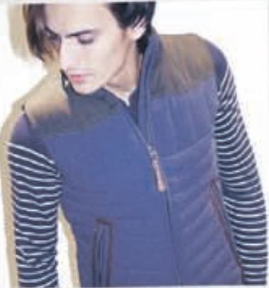
SUIT Vesti 22.900kr. Bolur 9.900kr.