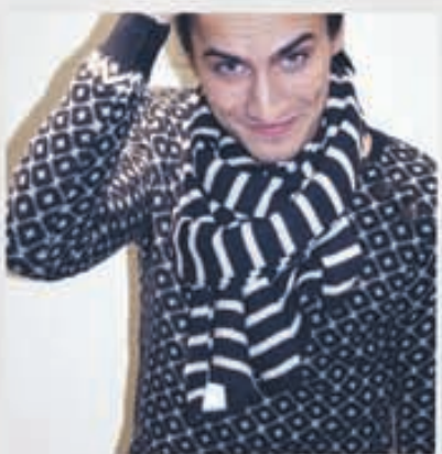
SUIT Trefill 12.900kr. Peysa 14.900kr.