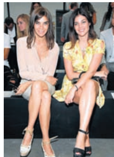
Carine og Julia Restoin-Roitfeld Fyrirverandi ritstjóri franska Vogue og dóttir hennar eru tíðir gestir á hinar ýmsu tiskusýningar. Þær sjást íðulega á fremsta bekk hjá Louis Vuitton, Chanel, Givenchy, Fendi, Gucci, Jean Paul Gaultier, Alexander Wang og Theyskens' Theory.