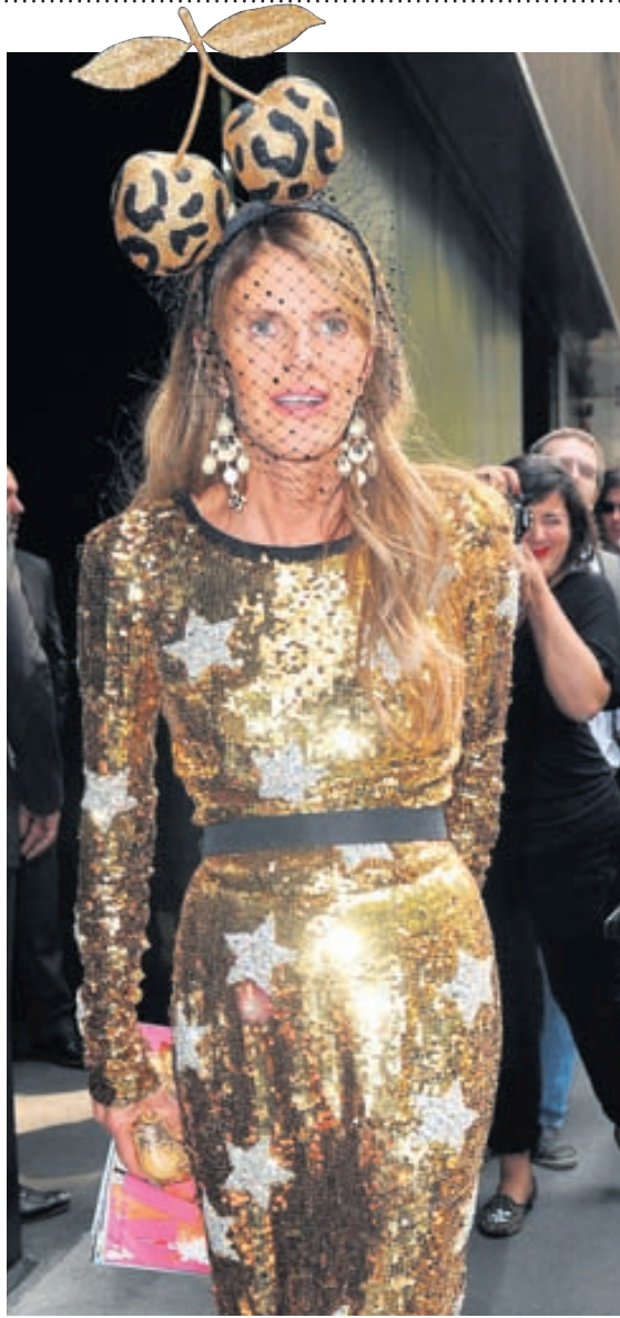
Anna Dello Russo Hin ítalska Dello Russo starfar hjá japanska Vogue og er áberandi í fremstu sætaröð á tiskusýningum húsa á borð við Louis Vuitton, Alexander McQueen, John Galliano, Hermes, Givenchy og Balmain.