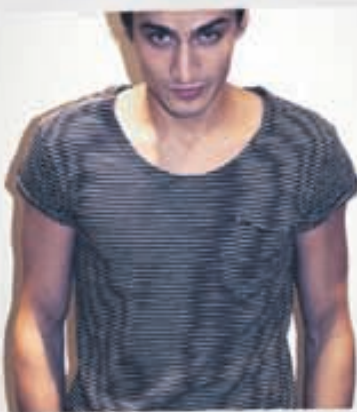
WON HUNDRED Bolur 8.900kr.