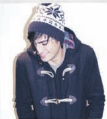
SUIT Frakki 39.900kr. Hífa 5.900kr