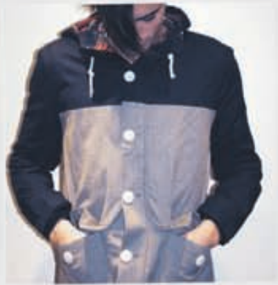
SUIT Jakki 26.900kr.