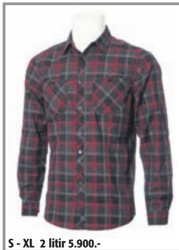
S - XL 2 litir 5.900.-