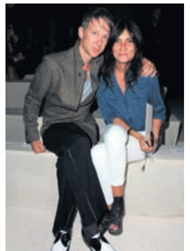
Emmanuelle Alt Stílistinn tók við sem ritstjóri franska Vogue í byrjun árs og hefur síðan þá sést á fremsta bekk hönnuða á borð við Alexander McQueen, John Galliano, Celine, Barbara Bui, D&G og Jean-Paul Gaultier.