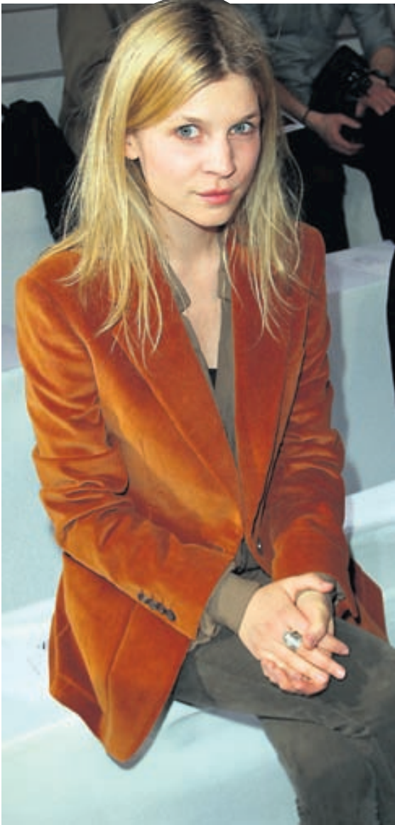
Clemence Poesy Leikkonan franska er í upphaldi hjá hönnuðinum Karl Lagerfeld og sést íðulega á fremsta bekk á Chanel-sýningum en einnig hjá Erdem, Chloé og Mulberry Salon.