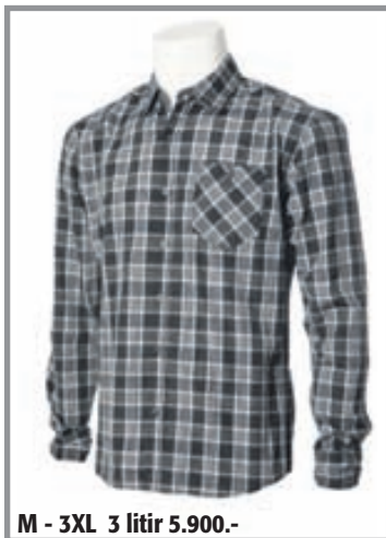
M - 3XL 3 litir 5.900.-