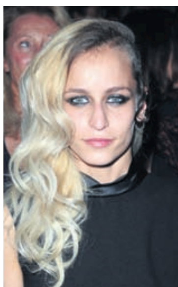
Andlit Chanel Fyrirsætan Alice Dellal gæti tekið við af Blake Lively sem andlit töskulínu tiskurans Chanel.