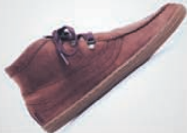
SHOE THE BEAR Skör 23.900kr