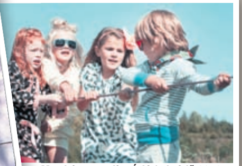
Mynd úr sumarlinu Ígló fyrir árið 2012. Elísabet Davíðsdóttir, ljósmyndari og fyrirsæta, tók þessa mynd.