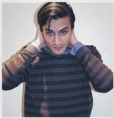
FILIPPA K Peysa 26.900kr.