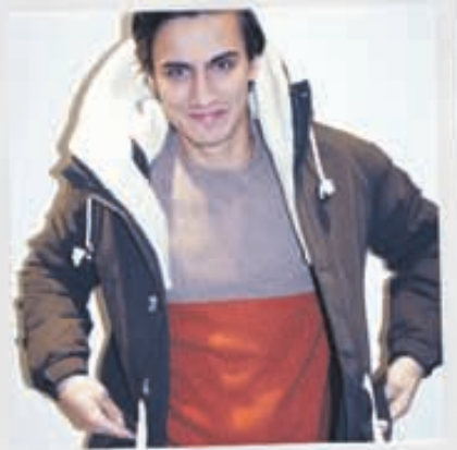
SUIT Úlpa 39.900kr. Peysa 14.900kr.