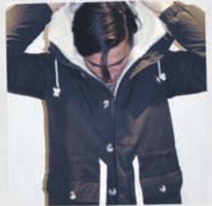
SUIT Úlpa 39.900kr