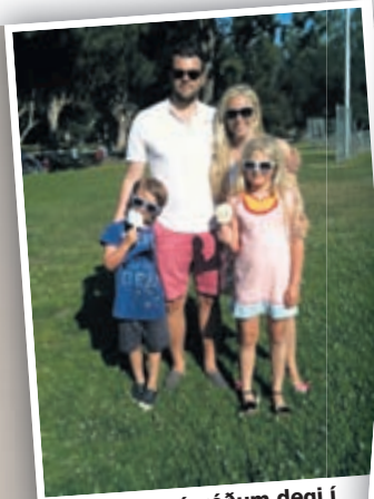
Fjölskyldan á góðum degi í Griffith Park í LA.