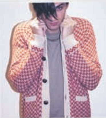
SUIT Peysa 19.900 Bolur 4.900kr.