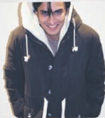
SUIT Úlpa 39.900kr