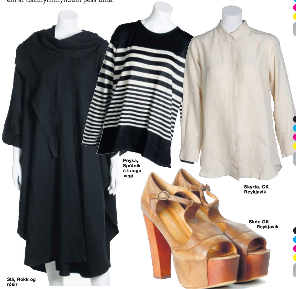
Peysa, Spútnik á Laugavegi

Jagger var áberandi í skemmtanalífinu í New York snemma á áttunda áratugnum og var nánin vinkona listamannsins Andy Warhol. Hún þótti ávallt mjög smekkleg til fara og var ein af tískufyrirmyndum þess tíma.