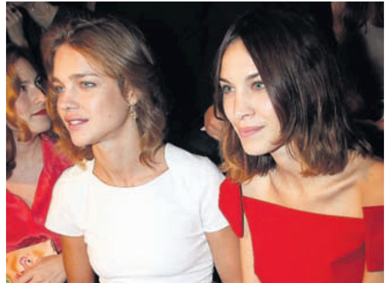
Alexa Chung Breska sjónvarpskonan er gjarnan gestur á sýningum stóru tiskuhúsanna og mátti meðal annars sjá hana á sýningum Valentino, Chanel, Proenza Schouler, Yves Saint Laurent, Cynthia Rowley og Burberry Prorsum.

Fremsti bekkur tiskusýninga er gjarnan þéttsetinn af fræga fólkinu. Nokkur þekkt andlit sjást þó oftast í fremstu sætaröð og má þar nefna leikkonuna Clemence Poesy og fyrirsætuna og sjónvarpskonuna Alex Chung auk áhrifafólks úr tiskuheiminum á borð við Önnu Wintour, Carine Roitfeld og Önnu Dello Russo.