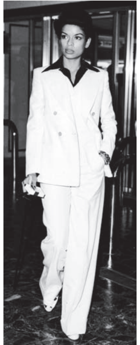
Hvítklædd Jagger klæddist gjarnan jakkafötum og síðum víðbuxum. Hún var óhrædd við að fara sínar eigin leiðir þegar kom að tísku.