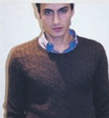
SUIT Peysa 12.900kr.