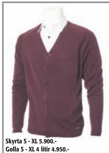
Skýrta S - XL 5.900.- Golla S - XL 4 litir 4.950.-