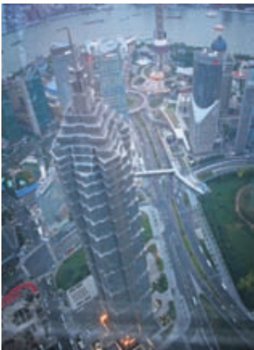
Magnað útsýni Útsýnið úr efsta útsýnis-punkti borgarinnar í Shanghai World Financial Center.