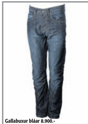
Gallabuxur bláar 8.900.-