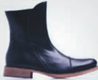
SHOE THE BEAR Skör 36.900kr.