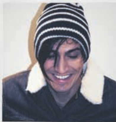
SUIT LEE Hífa 5.900kr. Jakki 32.900kr.