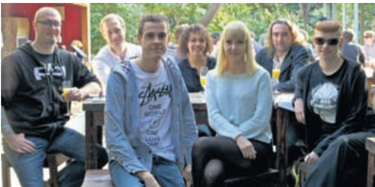
Í góðra vina hópi Við ásamt vinum á góðri stundu í garðinum á veitingahúsinu Cotton's.