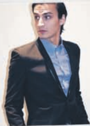
SUIT Jakkaföt 58.800kr.