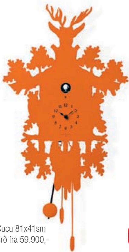
Cucu 81x41sm verð frá 59.900,-