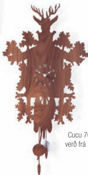
Cucu 70x34sm verð frá 26.900,-