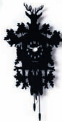
Cucu 34x18sm verð frá 12.900,-