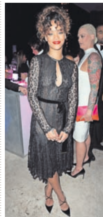
ÁRAMÓTAGLEÐI Söngkonan Rihanna sótti veislu í boði rapparans Sean „Diddy“ Combs á Miami á gamlárskvöld. Hún klæddist fallegum svörtum kjól með blúnduermum.