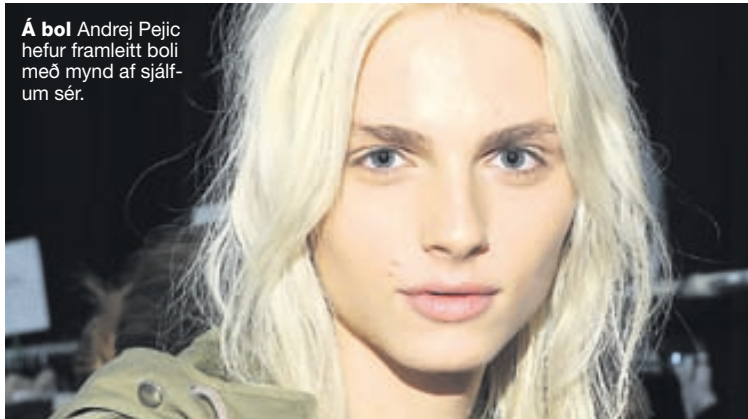
Á bol Andrej Pejic hefur framleitt boli með mynd af sjálfum sér.