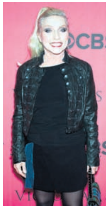
Rokkari Harry á sýningu Victoria's Secret árið 2010. Hún er enn jafn töff og fyrir þrjátíu árum.

* Hljómsveitin Blondie hætti um hríð í byrjun níunda áratugarins þegar Stein veiktist af sjaldgæfum húðsjúkdómi. Harry tók sér þá frí frá tónlistinni á meðan hún hjúkraði Stein aftur til heilsu. Þarið hætti saman í byrjun tíunda áratugarins en þau eru enn nánir vinir.