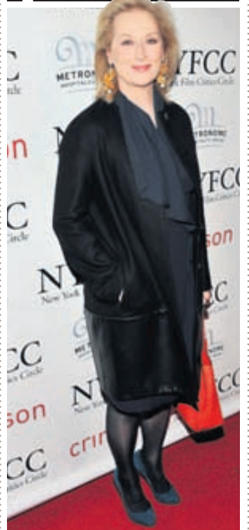
GLÆSILEG Hin frábæra leikkona Meryl Streep var glæsileg að venju er hún sótti New York Film Critics-hátíðina í New York á mánudaginn var.