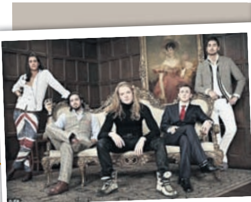
* Auglýsingaplakat fyrstu seríu Made in Chelsea.