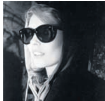
Blondie Harry orðin ljóshærð og pönkuð.