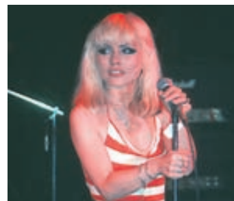
Flott Harry þótti sérstaklega töff bæði á sviði og í daglegu lífi.