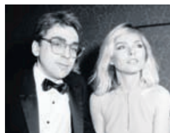
Ástfangin Harry ásamt kærasta sínum og samstarfsfélagi, Chris Stein, árið 1981.