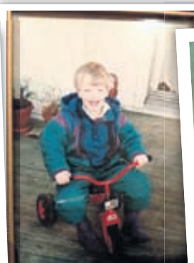
Fjögurra ára í Stavanger í Noregi.