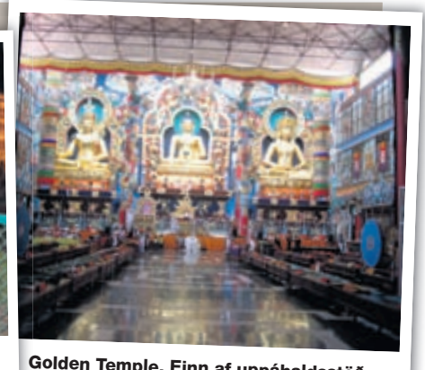
Golden Temple. Einn af upphaldsstöðunum mínum á Indlandi, Bylakuppe, þar sem búa um 10.000 flóttamenn frá Tíbet.