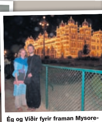
Ég og Víðir fyrir framan Mysorehöllina sem er lýst upp á hverju kvöldi með 97.000 perum.