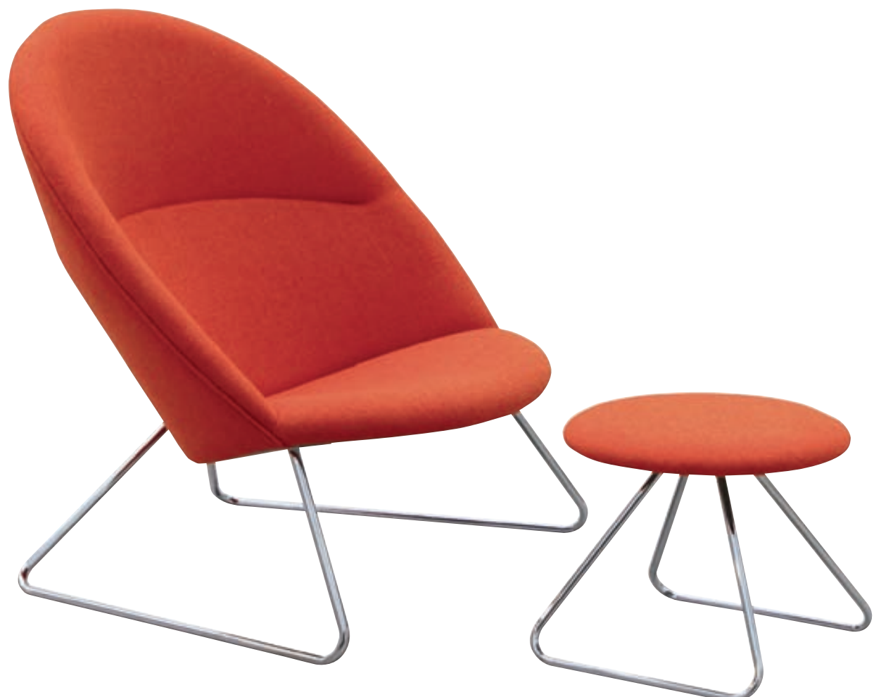
DENNIE Hönnun: Nanna og Jørgen Ditzel