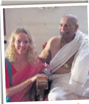
Ég ásamt jógakennaranum mínum heitnum, Sri K. Pattabhi Jois, í Mysore á Indlandi.