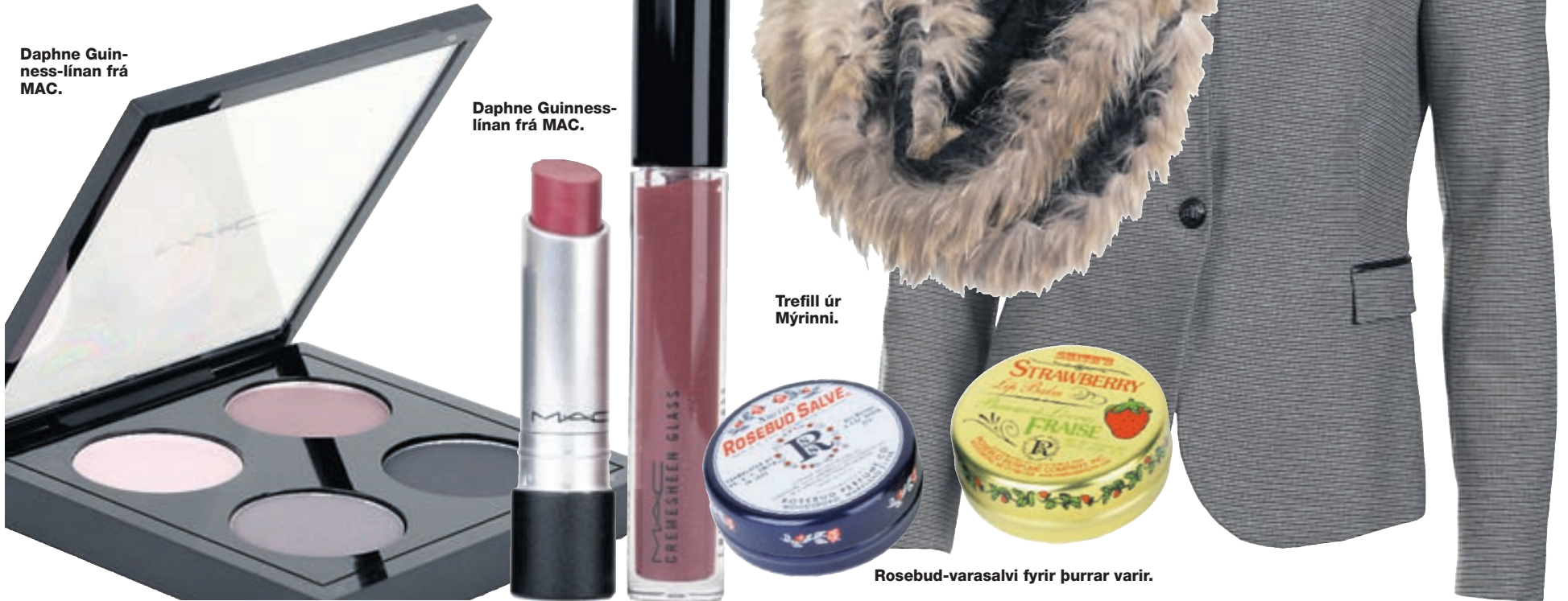
Daphne Guinness-línan frá MAC.

Nýju ári fylgir oft nýtt upphaf og fyrirheit um nýja tíma. Það er þó ýmislegt sem má taka með sér yfir í nýtt ár, eins og tískustrauma haustsins 2011. Þessa fyrstu mánuði ársins heldur tískan áfram að vera klassísk og full af jarðlitum. Haldið fast í þykku peysurnar og ökkla-stígvélin en bætið við aðsniðnum jökkum sem minna á enska sveitasælu og varalit í fjólurauðum lit.