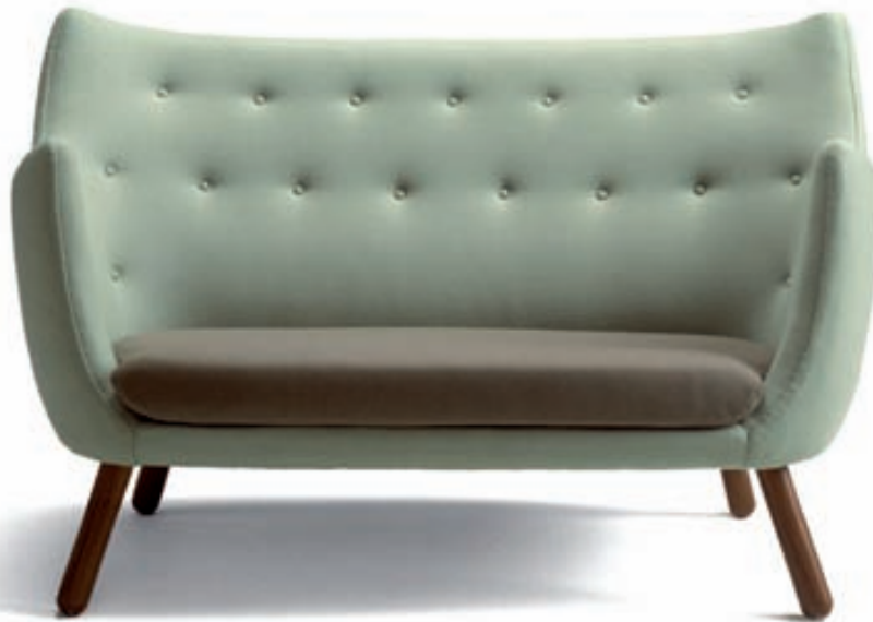
POETEN Hönnun: Finn Juhl