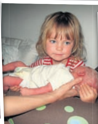
Elín dóttir mín að halda á systur sinni í fyrsta skipti.