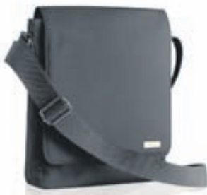
Þessi glæsilega hliðartaska frá GUERLAIN fylgir kaupum á nýja G NOIR maskaranum