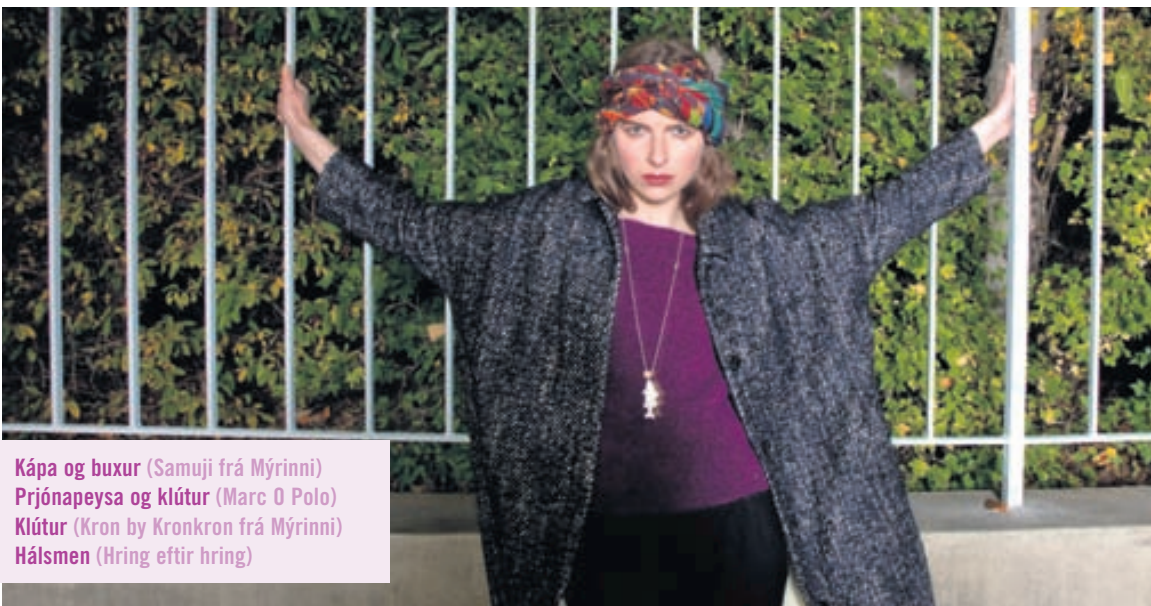
Kápa og buxur (Samuji frá Mýrinni) Þrjónapeysa og klútur (Marc O Polo) Klútur (Kron by Kronkron frá Mýrinni) Hálsmen (Hring eftir hring)

Haustið er komið í allri sinni dásamlegu dýrð og dulúð. Að því tilefni fékk Lífið fagfólk með meiru til að setja saman það heitasta í tísku, hári og förðun.