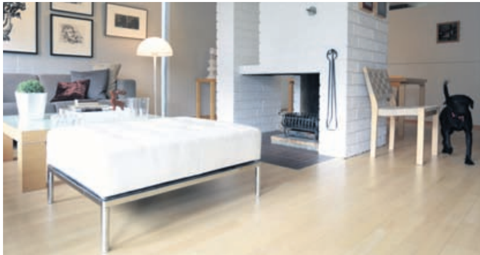
Heimili Hönnu Birnu er einstaklega stílhreint, bjart og fallegt!