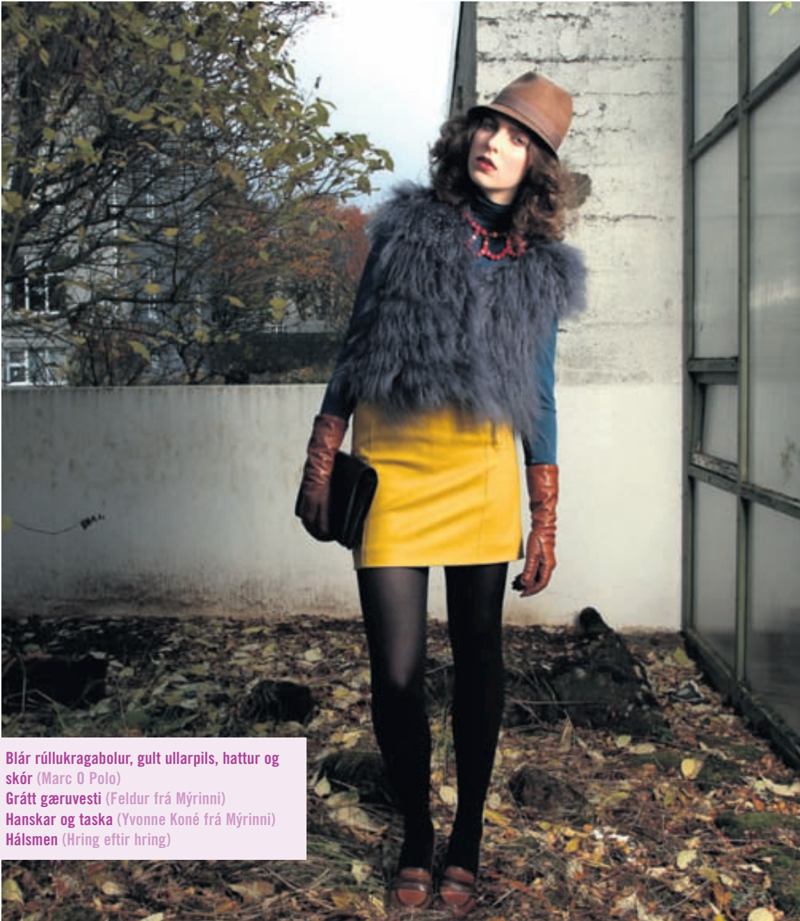
Blár rúllukragabólur, gult ullarpils, hattur og skór (Marc O Polo) Grátt gæruvesti (Feldur frá Mýrinni) Hanskar og taska (Yvonne Koné frá Mýrinni) Hálsmen (Hring eftir hring)