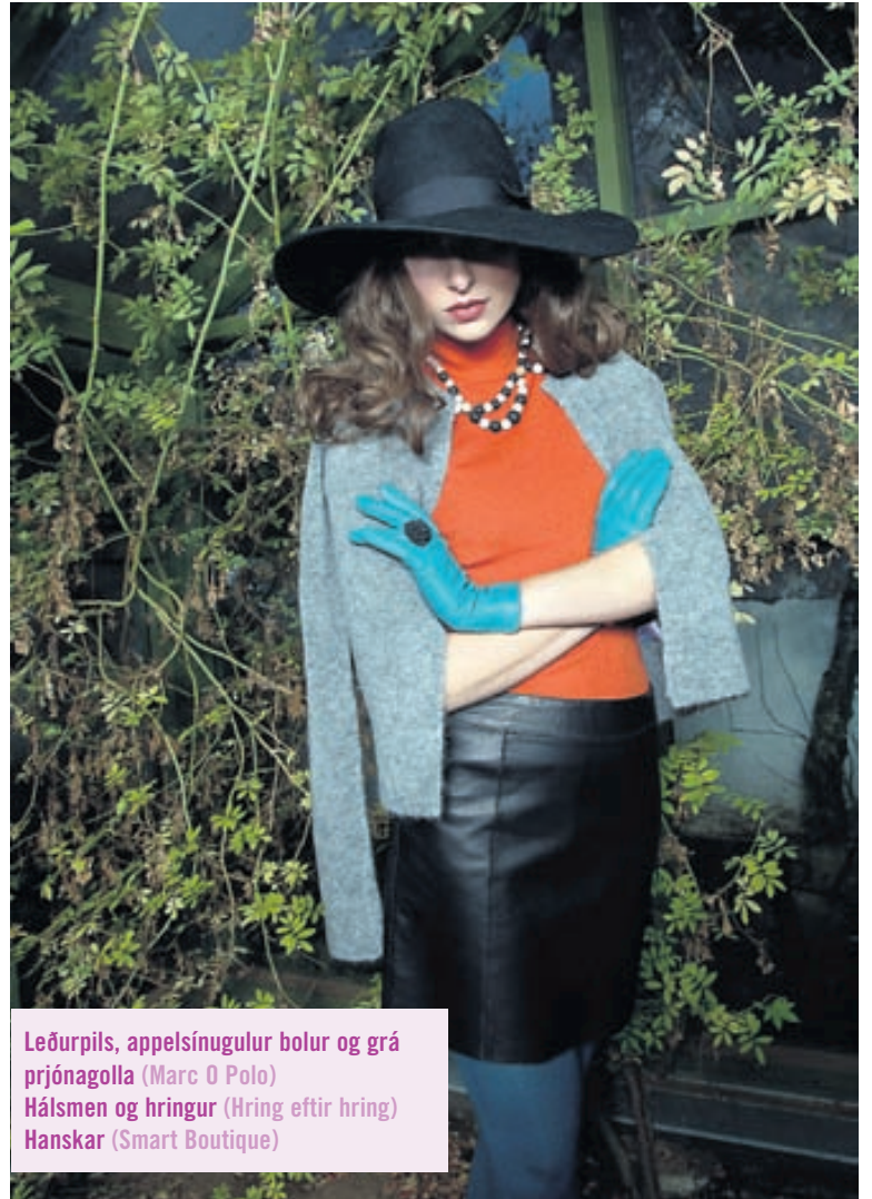
Leðurpils, appelsínugulur bolur og grá þrjónagolla (Marc O Polo) Hálsmen og hringur (Hring eftir hring) Hanskar (Smart Boutique)