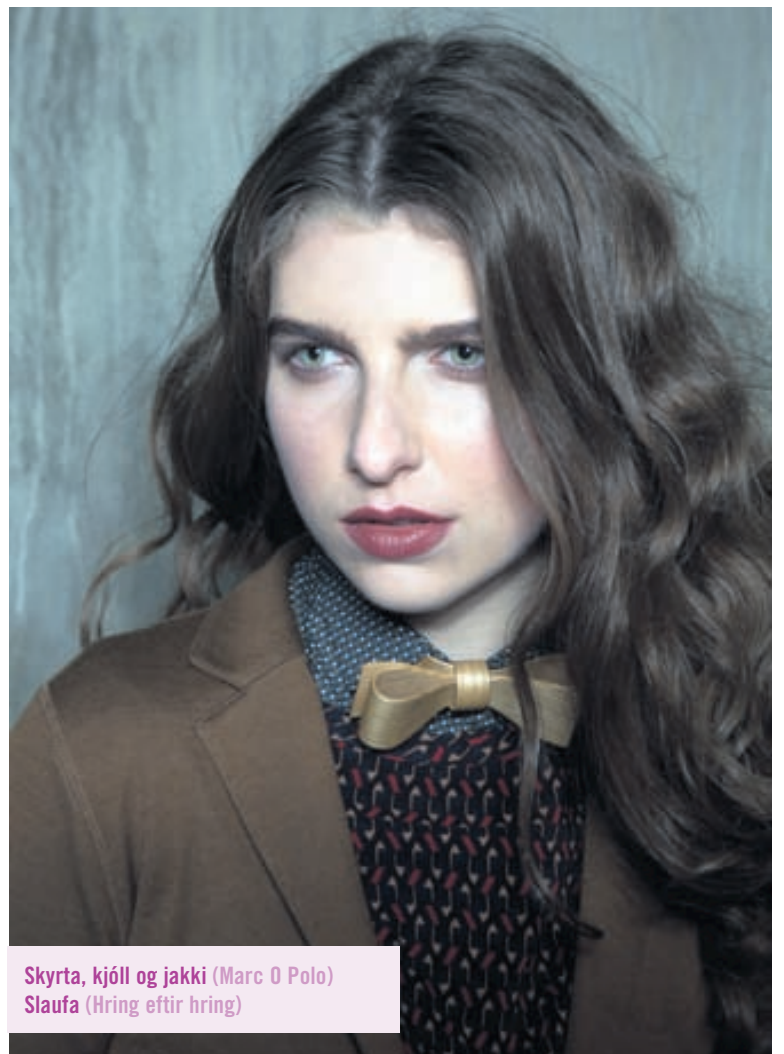
Skyrta, kjóll og jakki (Marc O Polo) Slaufa (Hring eftir hring)

FÖRÐUN: FRÍDA MARÍA MED BOBBY BROWN HÁR: FRÍDA MARÍA MED LABEL.M STÍLISTI: ERNA BERGMANN LJÓSMYNDUN: BJÖRG VIGFÚSDÓTTIR ADSTOÐARLJÓSMYNDARI: ARNDÍS